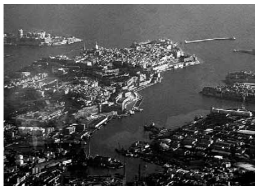
Views of Valletta, Malta (www.ufficiodelturismo.it: www.panoramio.com) View of the Grand Harbour (www.commonswikimedia.org) Vistas de la ciudad the Valeta (www.ufficiodelturismo.it: www.panoramio.com) Vista del Grand Harbour (www.commonswikimedia.org)

noche" (Theuma, 2004). Las conexiones de transporte marítimas – tan importantes en las décadas anteriores a la hora de mantener vivo el tejido de las ciudades – se veían sustituidas por las redes viarias internas, cambiando así unas conexiones marítimas eficaces por unas redes de carreteras lentas y congestionadas. Durante 30 años (años '60 hasta los '90) se hizo caso omiso al Grand Harbour. Los intentos de reanimar la zona eran esporádicos e ineficaces. En 1996 el Gobierno recién elegido intentó solucionar el problema. No obstante, no se logró aprobar los cambios propuestos y lo que empezó como un planteamiento muy innovador (la construcción de un puerto deportivo en pleno puerto) se volvió muy polémico, provocando la derrota del nuevo Gobierno Laborista (1996-1998) en las próximas elecciones. En retrospectiva, se podría decir que este suceso desencadenó una serie de acontecimientos que permitieron al Grand Harbour recuperar su papel como núcleo importante para las actividades económicas y sociales en Malta, además de convertirse en un hub de actividad en el Mediterráneo, sirviendo de enlace no solamente para las ciudades que compartían el puerto sino también para otras ciudades europeas.