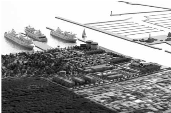
Porto Corsini Marinara, Porto Turistico Internazionale Porto Corsini Marinara, International Tourist Port

This program to regenerate the urban-port areas not only aims to fight their decline, but in doing so, taking into account the quality of sustainable development and the respect for the territory and the environment, it creates the conditions for these areas to develop commercial, industrial and tertiary sector activities, and to cultivate the unobtrusive type of integration which has always distinguished the relationship of the city of Ravenna with its port.