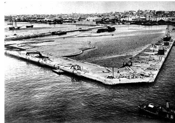
Construcción de la Rambla Sur. Año 1930 Puerto de Montevideo. Construcción. Año 1903 Construction of the Promenade Sur. 1930 Construction of the Port of Montevideo. 1930

Maiztegui C., Lincoln R., Orientales: Una Historia Política del Uruguay , Planeta