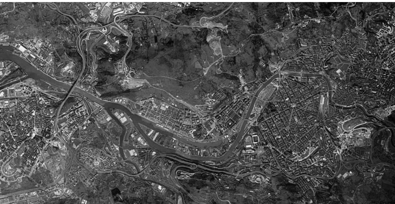
Vista aérea de la ría y del Puerto de Bilbao Aerial view of the river and port of Bilbao

place in the river next to the Castillo Road was used to build the San Antón stone “bridge” next to a crag on which was built a fortress, later turned into the church of San Antón, where there was a natural anchorage for boats. The bridge joined the banks upon which two different towns were built. On the left bank, going by the river current, Bilbao Zaharra (old Bilbao), which was a mining, iron-producing and industrial town; on the right bank, a place made up of a hermitage dedicated to the apostle St James, the sea path of the pilgrims’ route, with an ancestral home and some houses for fishermen, sailors and merchants. Here the centre of Bilbao was built, and in 1300 was granted its Charter, granting it the status of a City, which stated: “with the pleasure of the Biscayans I hereby make in Bilbao, part of Begoña, a new settlement and city, which is called the Port of Bilbao.” This name could be interpreted in semantic terms in a modern language, and in this way it has been known and passed on as that which “was a port before it was a town.” The bridge, ría and church were to make up the emblem of the town. From then on, the port and the town, sharing one origin, one development, and one history, have shared conflicts and benefits essential for their population, economy, culture and urban