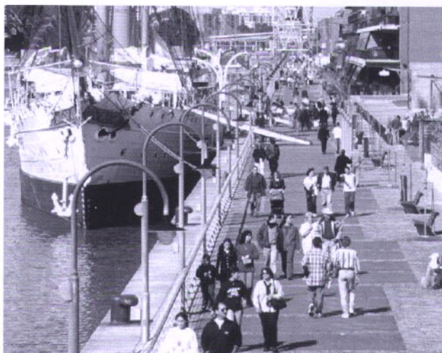
Rambla de Puerto Madero Rambla of Puerto Madero

Esta aproximación hacia nuevos paisajes urbanos, une la geografía, la infraestructura urbana, la morada y la ciudad, creando múltiples escenarios de producción y consumo, políticos, económicos y sociales, rituales y violentos, íntimos y masivos, naturales y artificiales, una moderna red de acontecimientos que fortalecen y definen a su vez la existencia de aquella condición esencial de la Ciudad de Buenos Aires y el Río de la Plata, el ser un territorio en permanente construcción.