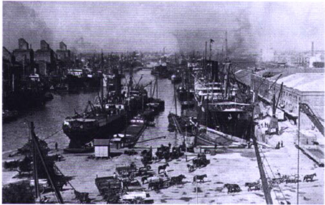
Puerto de Buenos Aires a comienzos del s. XX View of the Port of Buenos Aires, early 20th century