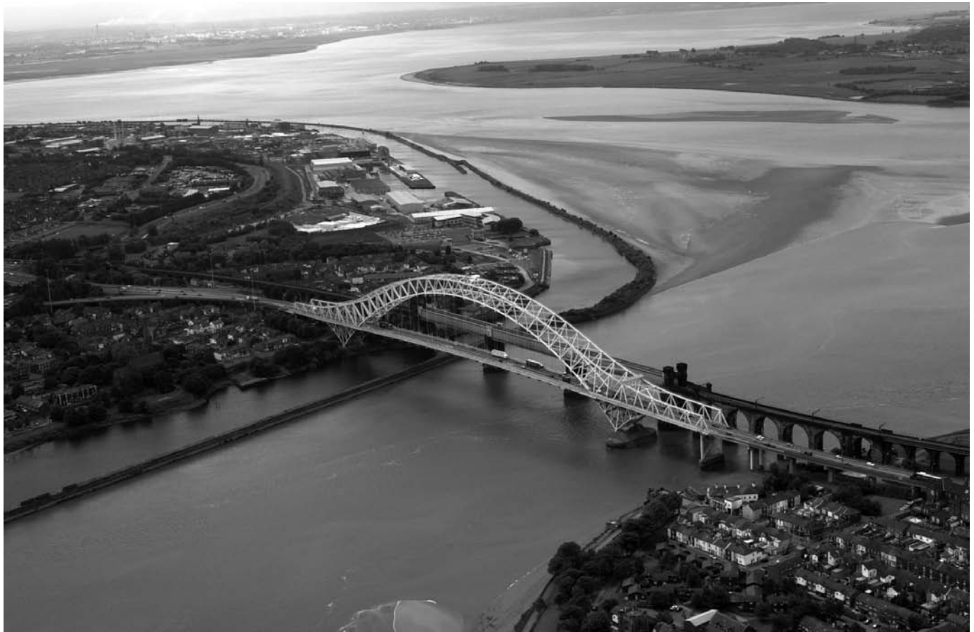
Port of Liverpool Runcorn bridge, Mersey Estuary Puerto de Liverpool Puente de Runcorn, Estuario del Mersey

De igual modo, se están creando reservas naturales en los alrededores de Runcorn y Widnes, ciudades tradicionalmente industriales situadas en el extremo sudeste del Estuario del Mersey. La herencia de la industria química en la zona no permitirá contar de forma inmediata con elementos medioambientales naturales de primer orden. No obstante, Widnes Warth ofrece extensos hábitats de marismas saladas, arena y lodo de