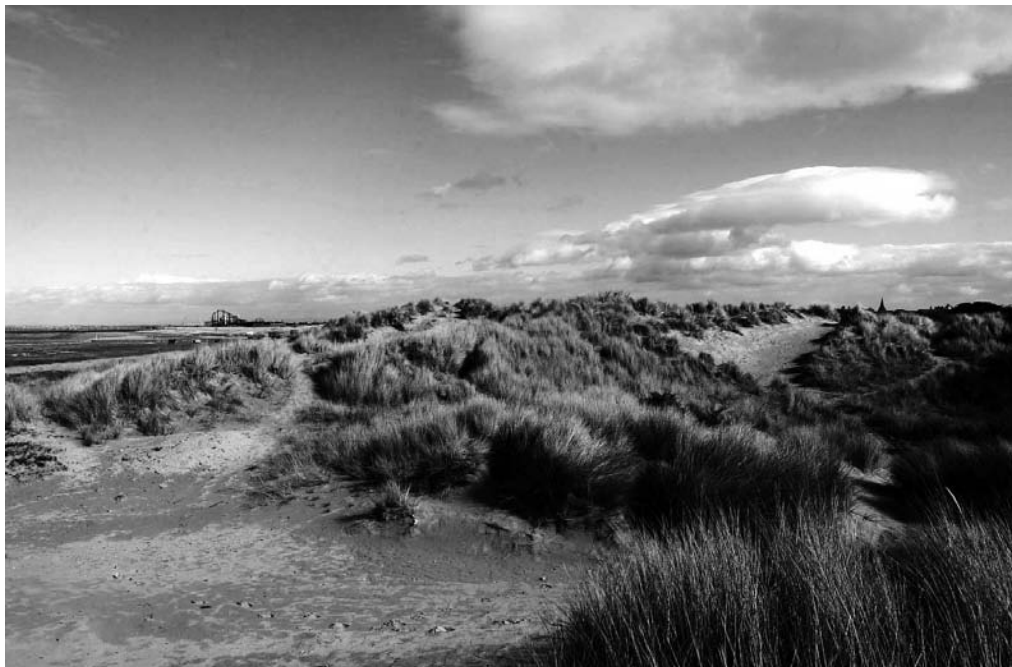
Liverpool Pier Head Sand dunes, Sefton coastline Pier Head de Liverpool Dunas, costa de Sefton

las mareas que sirven de sustento para gran cantidad de aves y otras especies. Asimismo, ha sido declarada Área de Protección Especial (SPA) para aves y Zona de Especial Interés Científico (SSSI). El programa Mersey Waterfront está destinando fondos para la adquisición de 40 hectáreas de Widnes Warth, para así mejorar el acceso a la reserva mediante senderos, áreas de observación, paranzas para pájaros y paneles de información.