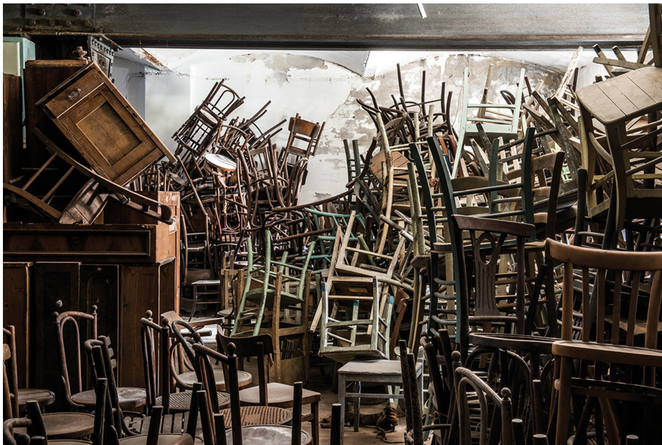
Warehouse 18, belongings left by the Italian diaspora.