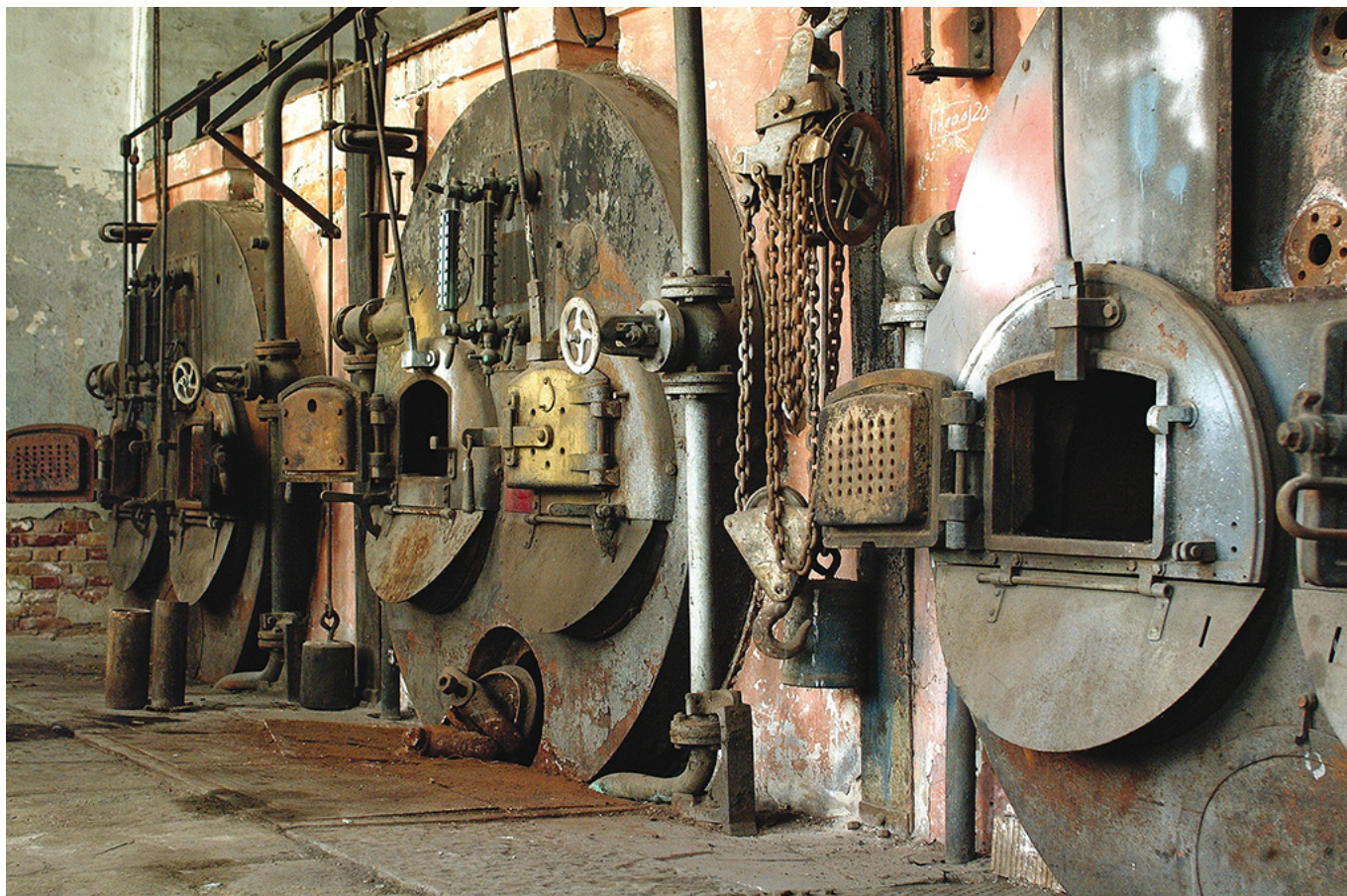
Hydrodynamic station in the 80s.