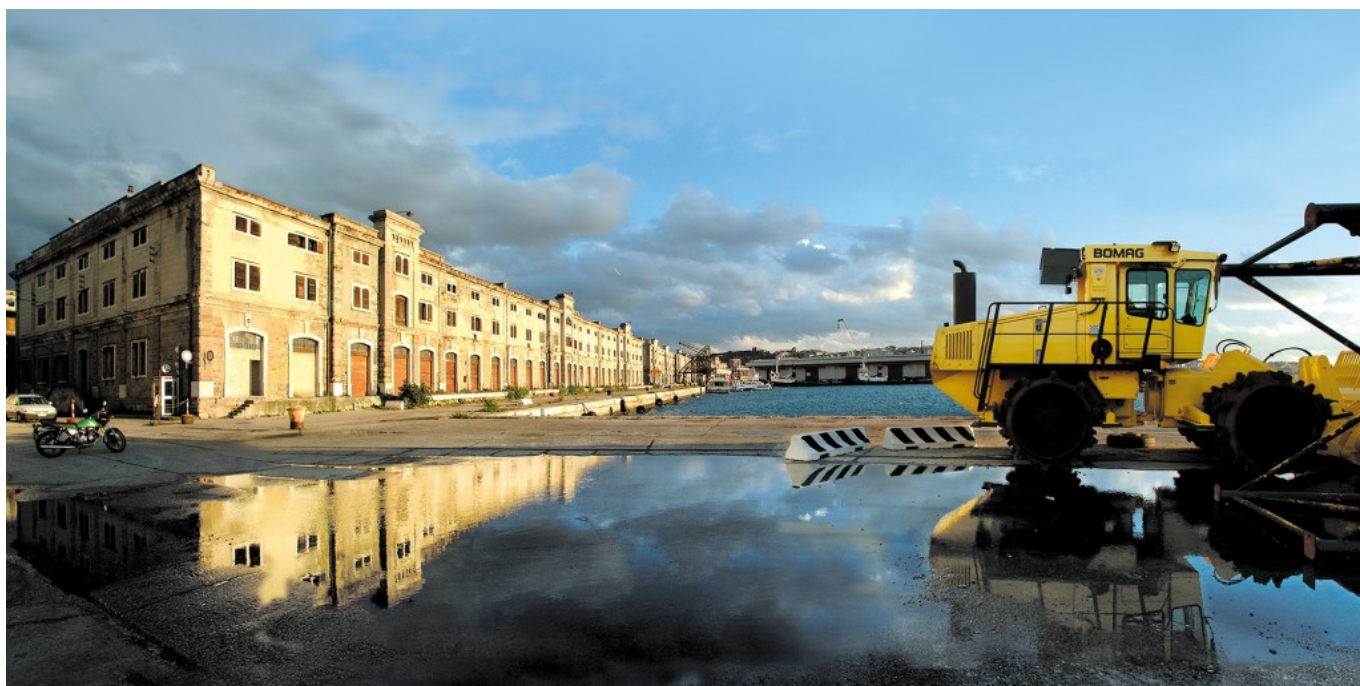
Hangar 06, in the 90s.