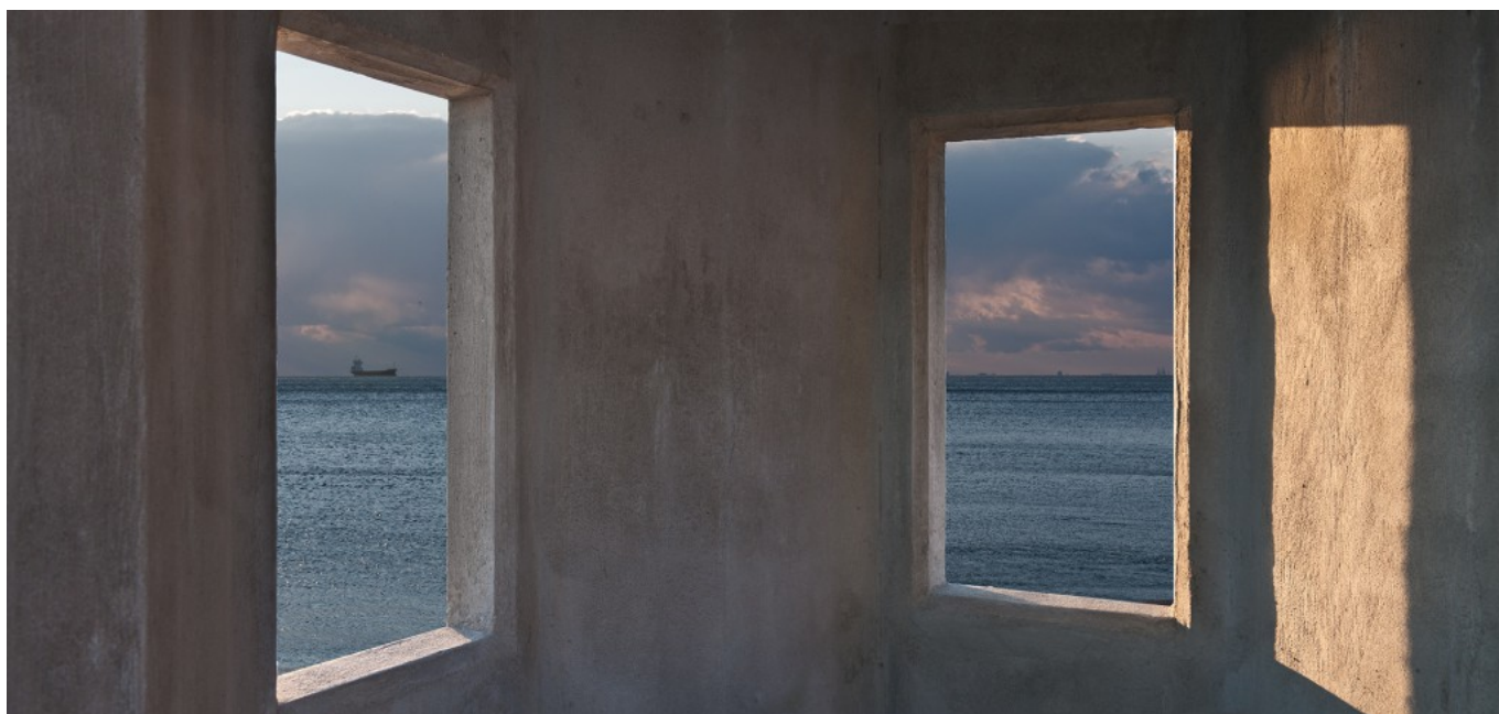
Dock 0 Watchtower.