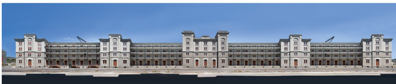
Warehouse 26 façades after renovation.