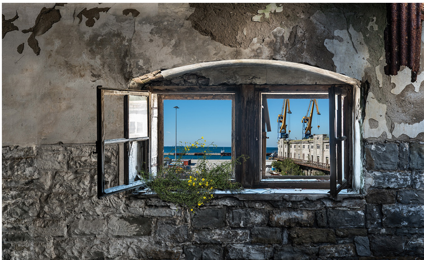
Window open on Porto Vecchio.