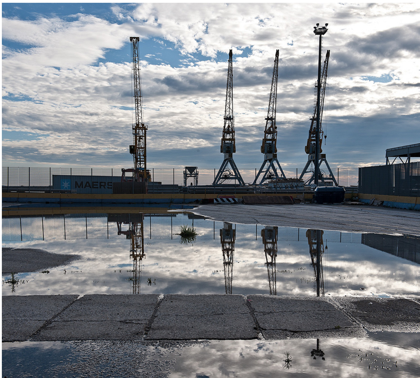
Adria Terminal plaza.