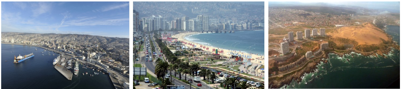
Ciudades de la conurbación; Valparaíso - Viña del Mar - Concón.

La ciudad de Concón es una Ciudad Balneario, capital Gastronómica de la Región. Se caracteriza por su componente medioambiental, dispone de un Campo Dunar y extensos bosques que contienen el desarrollo urbano, así como un borde costero fragmentado, mayormente rocoso. La tuición o administración del borde costero está mayormente en manos de entidades privadas, con escasa participación del Municipio.