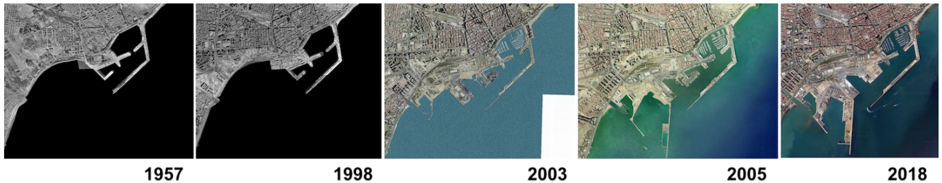
Evolución histórica del Puerto de Alicante.

Los datos en cuanto al tráfico de mercancías sitúan al puerto de Alicante muy lejos de Algeciras (4.761.444 contenedores en 2016), Valencia (4.732.136) o Barcelona (2.236.961), mientras Alicante apenas llegó a los 160.000. Sin embargo, no es menos cierto que en el caso de Valencia se contabiliza junto al puerto de Sagunto, lo que demuestra un carácter supramunicipal del mismo. Es decir, son puertos de referencia de una amplia zona de influencia. Por otro lado, estos números, lejos de desanimar, demuestran que existe mucho margen de mejora, mucho camino por recorrer.