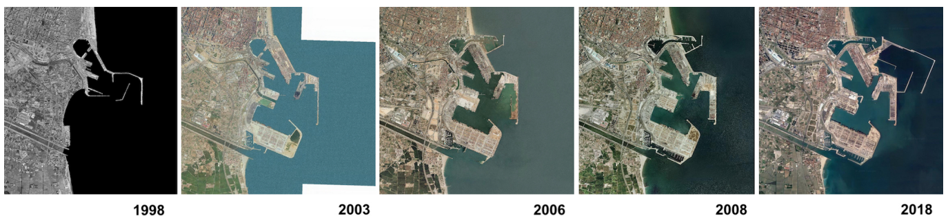
Evolución histórica del Puerto de Valencia.

La realidad nos dice que si bien la economía de la provincia es potente, los planeamientos en infraestructuras y desarrollo económico se han realizado con la máxima de la ciudad de Alicante y esto bajo nuestro punto de vista es el primer gran error. Hoy multitud de empresas de toda la provincia, que además han culminado con éxito su proceso de expansión e internacionalización, utilizan el puerto de Valencia o Barcelona para sus exportaciones antes que el de Alicante. Es verdad que el puerto de Valencia se sitúa en un radio de 200 kilómetros, lo cual no hace descabellada esta opción; es verdad que tanto los accesos como las infraestructuras de comunicación se han ejecutado antes en la capital del Turia que en cualquier otro lugar de la Comunidad Valenciana; es verdad que nos ha faltado ambición para dar ese salto internacional que nuestro puerto necesita, pero no es menos cierto que allí se ha invertido mucho y aquí se ha invertido poco. Las imágenes áreas que les mostramos en este artículo así lo atestiguan.