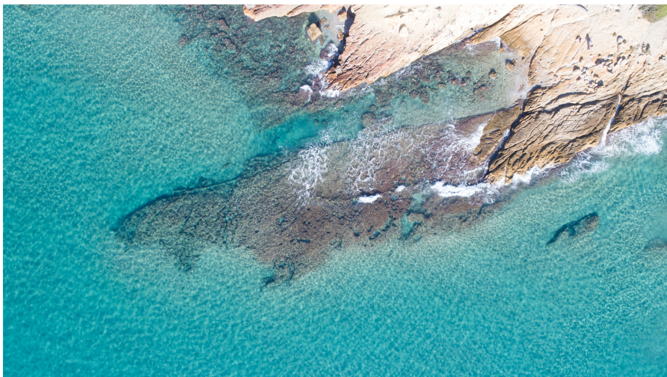
Vista aérea de la Roca Plana, un puerto industrial que formaba parte del sistema portuario de Tarraco.

La arqueología urbana y subacuática completa esta información. En la parte baja de la ciudad se han documentado almacenes, áreas de circulación, zonas de abastecimiento de agua, espacios termales y teatrales vinculados al frente marítimo. A lo largo del litoral, la aparición recurrente de anclas romanas confirma una actividad marítima constante y la existencia de fondeaderos secundarios que formaban parte del sistema portuario de Tarraco .