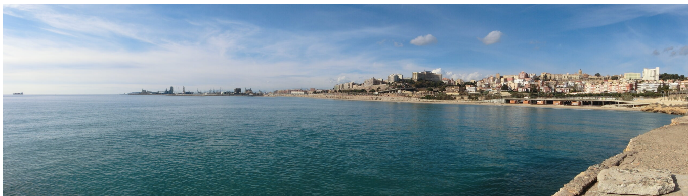
Vista general actual del frente de agua de Tarragona.

Aunque el puerto romano de Tarraco ha desaparecido físicamente, el conjunto de fuentes disponibles permite reconstruir un espacio marítimo complejo, articulado en torno a dos grandes momentos históricos. Tarraco se configuró como un núcleo decisivo en las rutas del Mediterráneo occidental y su puerto fue un motor de transformación urbana durante siglos.