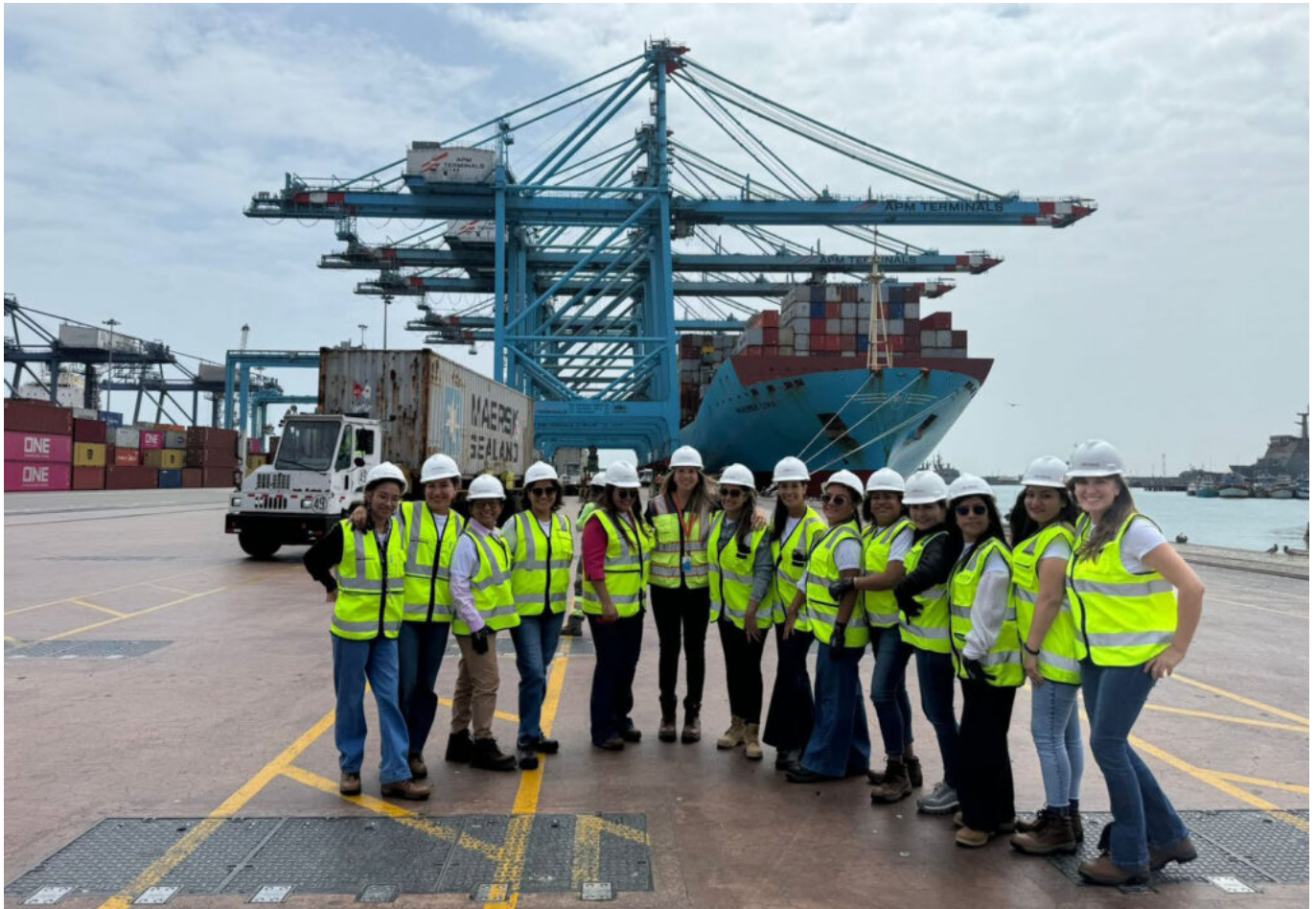
Visita de socias WISTA Perú al APM Terminals Callao Perú. (Fuente: WISTA Perú).