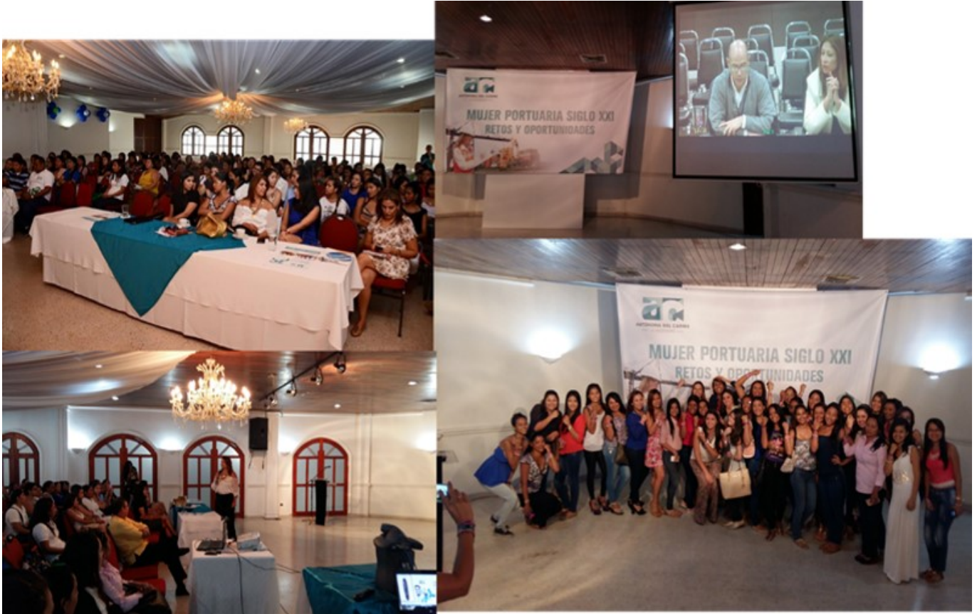
Conference “Mujer portuaria siglo XXI. Retos y oportunidades”

( https://www.uac.edu.co/noticias-economicas/noticias-administracion-maritima-y-fluvial/item/2165-conferencia-mujer-portuaria-siglo-xxi-retos-y-oportunidades.html ).