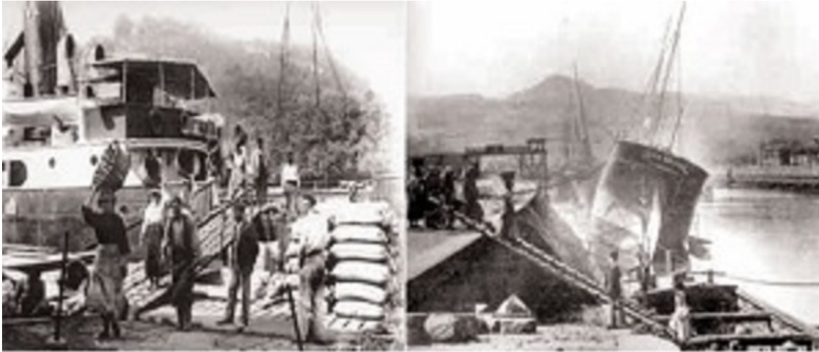
Women unloading coal in the Ria de Bilbao in 1910 (dockers, Oficios tradicionales https://www.oficiostradicionales.net/es/mar/estibadores/entorno.asp )

The first tasks of women in port activities started with fishing, there are also references of their participation in charge and discharge of merchandise at the ports Bilbaínos around 1717, when this also involved the discharge of wine bottles [1]. Other antecedents, in these same ports dating back to 1910 with the participation in the discharge of coal and passenger ships [2]. It was very common to see women leading commercial business (basically port activities). In the same way, women owners of fishing boats and passenger were seen [3].