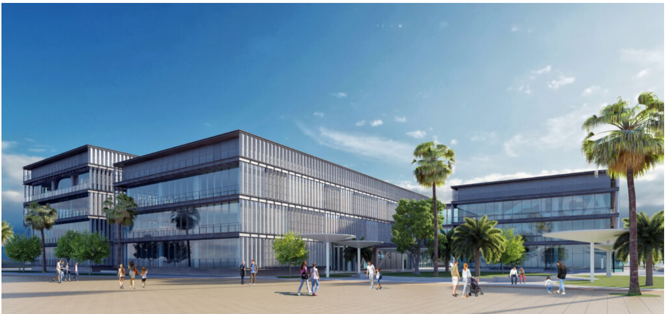
Infografía del edificio multifuncional que acogerá el futuro Museo y Port Center de

El Port Center abarcará así gran parte de la planta baja de dos edificios, de forma que esta estructura física ha influido también en el modelado de la propuesta conceptual de su discurso expositivo, puesto que se ha dividido en dos grandes bloques temáticos, en correspondencia con la estructura física del espacio museológico: por un lado, la evolución histórica del puerto hasta la actualidad, donde se incluyen piezas de carácter patrimonial y, por otro lado, el funcionamiento del puerto actual y futuro. Esta segunda parte muestra las claves para interpretar y entender los Puerto Bahía de Algeciras y de Tarifa, ambos dependientes administrativamente de la APBA. Por lo tanto, desde el punto de vista conceptual tenemos tanto un museo como un centro de interpretación dentro del mismo proyecto. Conceptualmente, son dos propuestas complementarias.