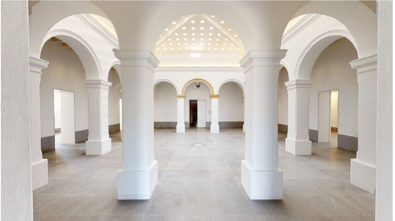
Vista del patio porticado del edificio anexo al faro de Tarifa, 1866.