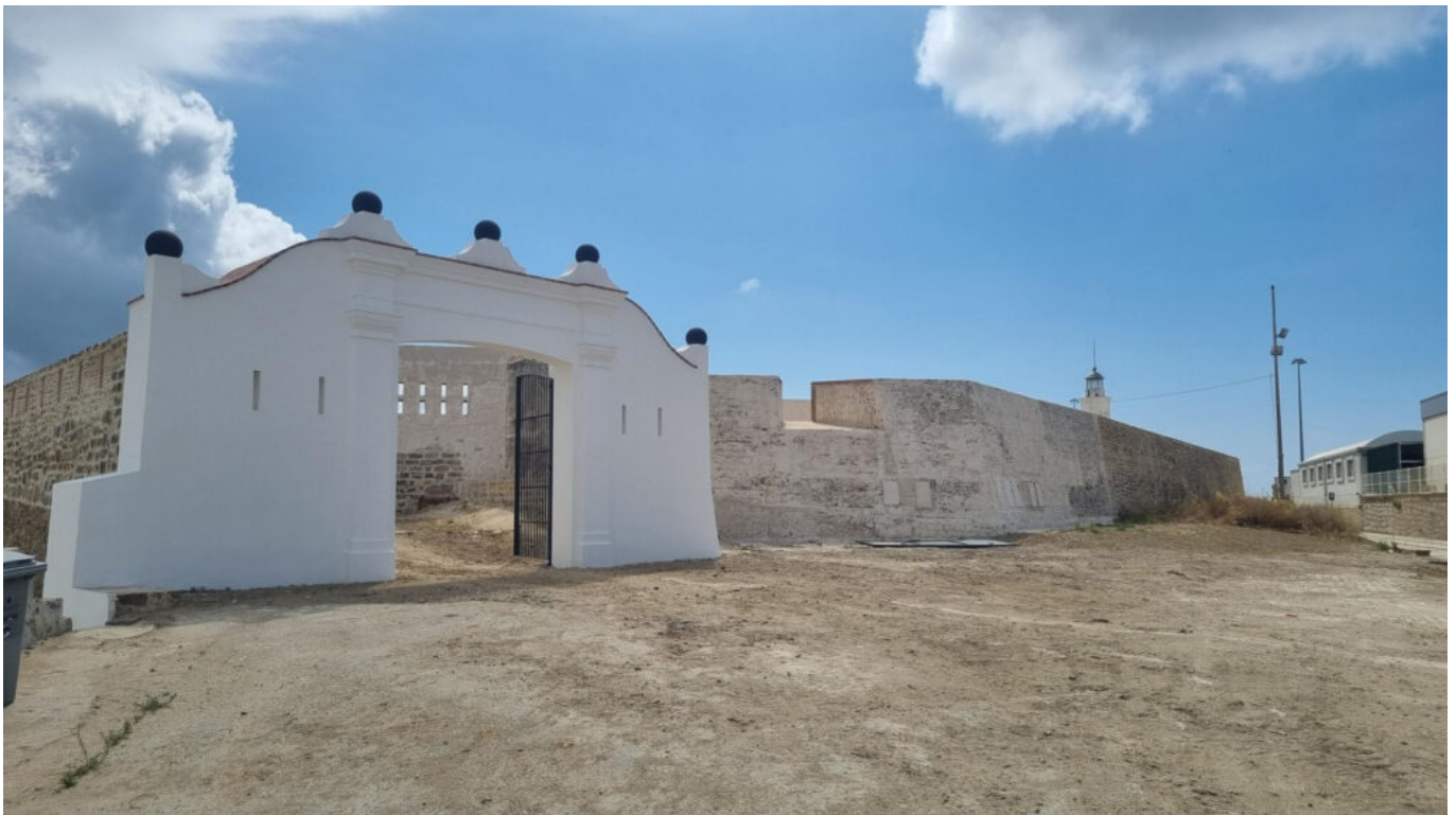
El fuerte de la Isla Verde en el Puerto de Algeciras. Siglo XVIII.

son varios los que tienen categoría de bien de interés cultural (BIC) y están protegidos legalmente, por lo que su mantenimiento y eventual recuperación y puesta en valor deviene en una obligación para la APBA. Es el caso, por ejemplo, de los fuertes de la Isla Verde (imagen anterior), San García y Punta Carnero en Algeciras o de las torres almenaras reconvertidas en faro de Punta Carbonera en San Roque y de la isla de Tarifa o de Camarinal en el término municipal de Tarifa.