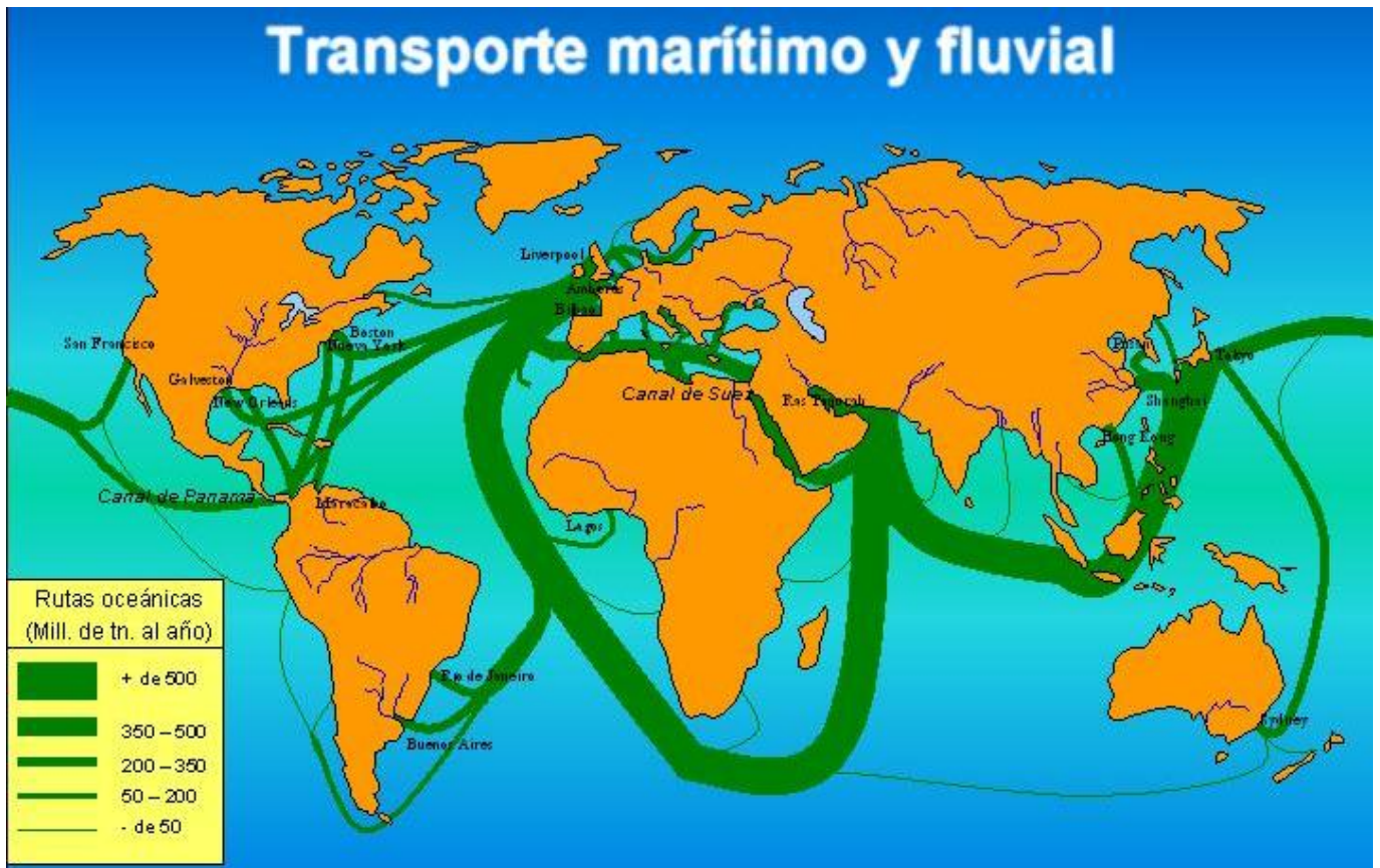
Major Global Maritime Trade Routes.

Raising awareness of this process will be the greatest challenge, and the future of our continent will largely depend on the correct implementation of these decisions. At PORTUS, we will periodically address these significant ambitions and possibilities, recording and analyzing the events that lead (or fail to lead) us to that path, which is both necessary and fascinating.