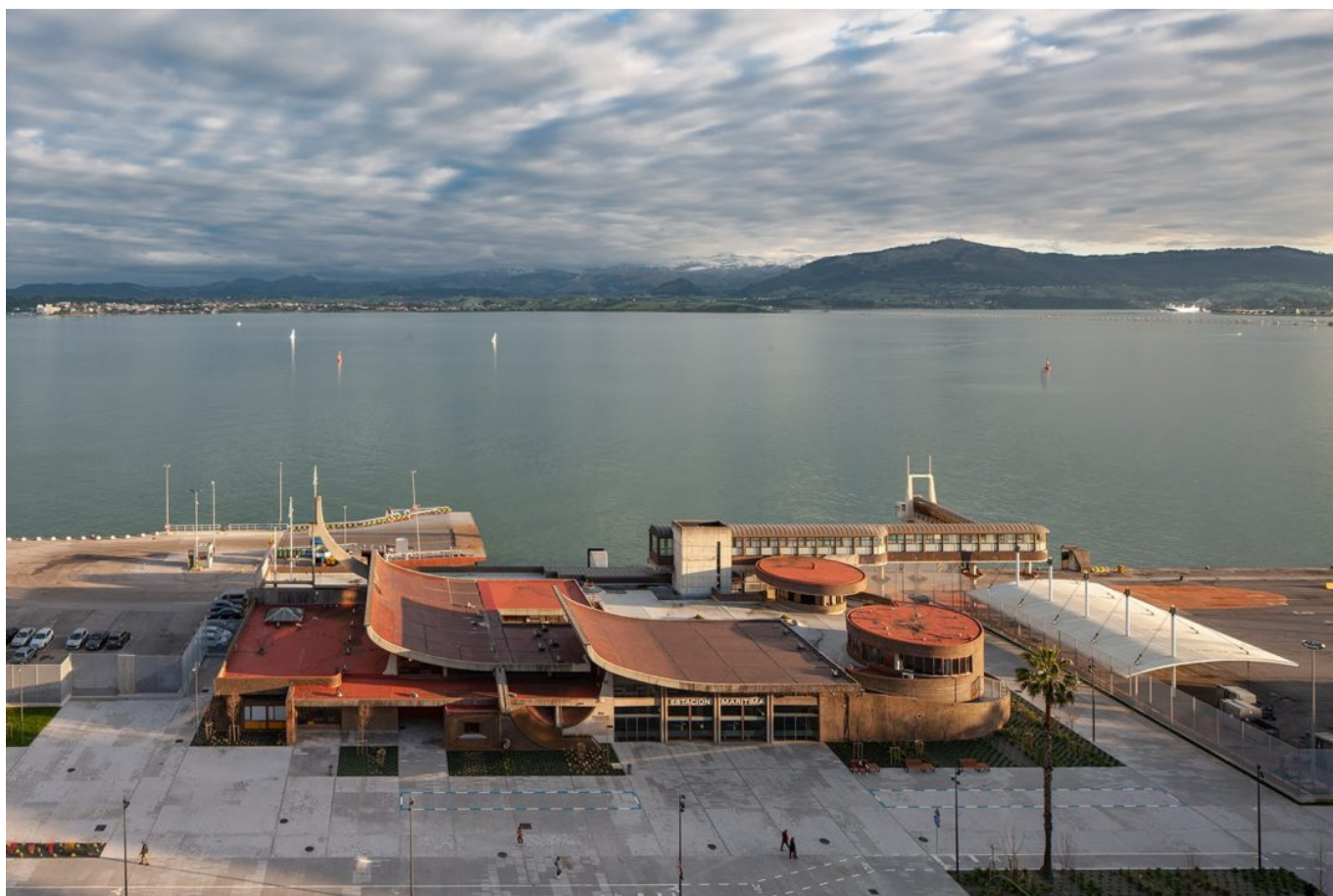
Estación Marítima del Puerto de Santander.

Elemento clave en la gestión de la actividad cultural de la APS es la Comisión Asesora de Actividades Culturales , órgano destinado a dotar de rigor, criterio técnico y profesionalidad a su programación. En efecto, creada en 2019 por el Consejo de Administración, esta figura tiene como misión evaluar la viabilidad y calidad de las propuestas que recibe la institución, así como proponer nuevas iniciativas que, en coherencia con su trayectoria, contribuyan a mantener y elevar el nivel de excelencia de su programación.