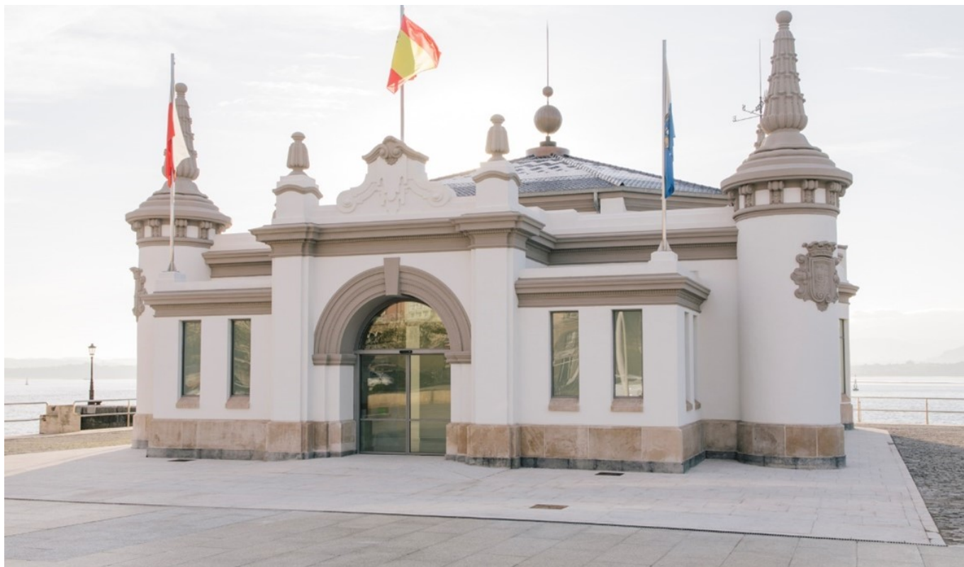
Vista general de las instalaciones del Centro de Arte Faro de Cabo Mayor.