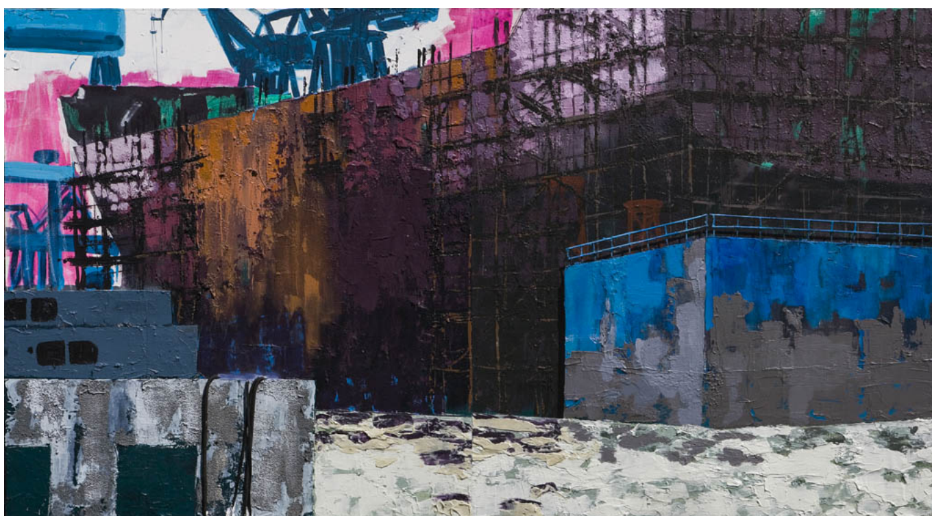
Shanghai Shipyard (185 x 340 x 10 cm). Acrylicpaint. Styrofoam, Emulsion, Ropes, Sand on Canvas. (Sasja Hagens, 2008)

cranes and docks, take an almost three-dimensional shape on the canvas. A material painting, composed of the superposition of different components, which returns fragments of port life: tops, tanks, names, numbers, shapes that tell stories of a man-made landscape. At the same time, the elements of realism turns soften and becomes a new scenario, abstract, surreal, transforming the infrastructure of work in a charming urban vegetation.