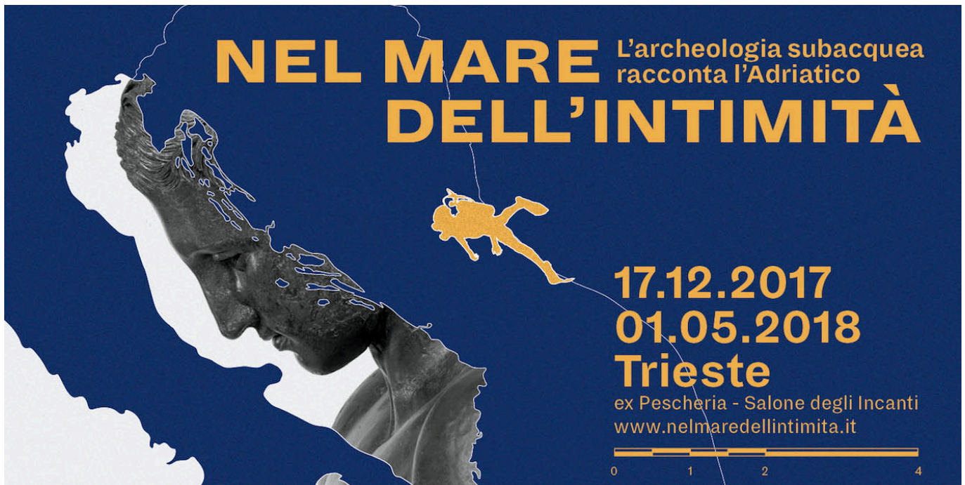
"Nel mare dell'intimità", the logo of exhibition.

Head Image: Entrance of the exhibition.