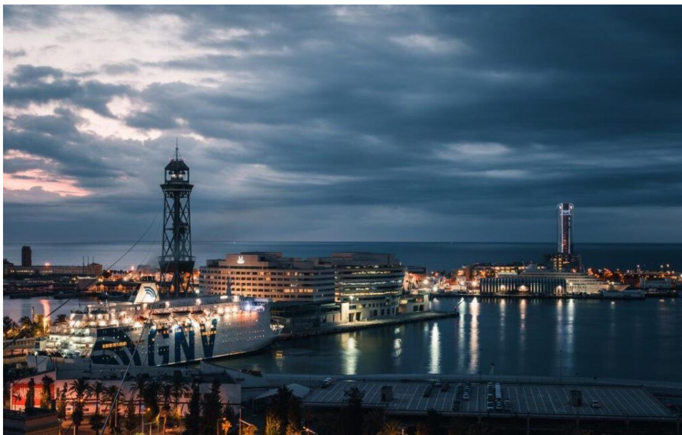
Vista nocturna de Port Vell. (© Port de Barcelona).