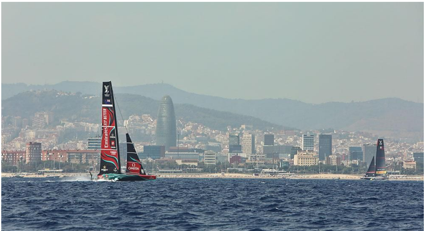
Uno de los momentos de la competición durante la 37ª America's Cup.