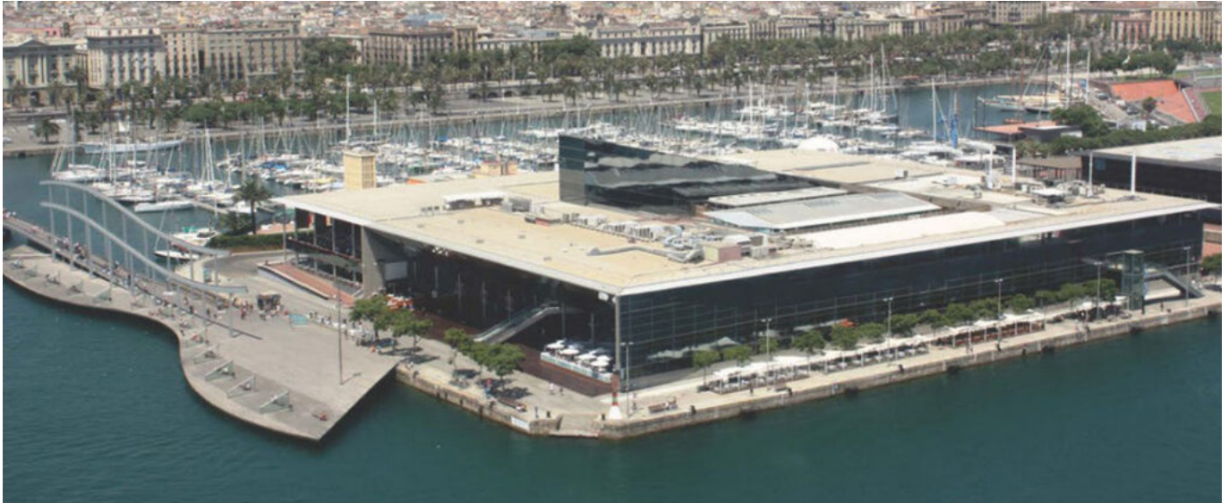
El Centro Comercial Maremagnum y la Rambla de Mar en el Port Vell de Barcelona. (© Gerencia Urbanística Port Vell).