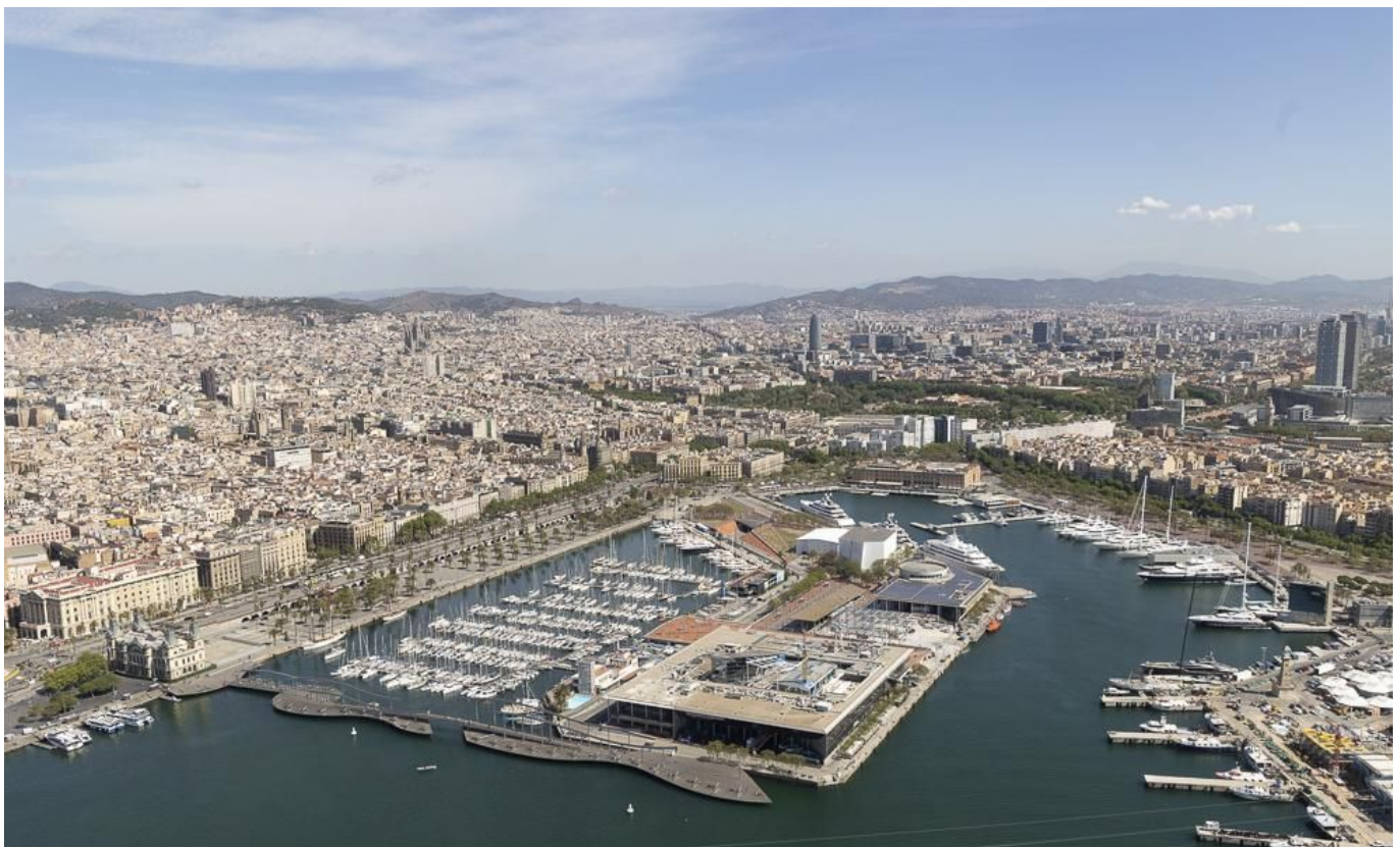
Vista general de la ciudad de Barcelona con el Port Vell en primer plano.