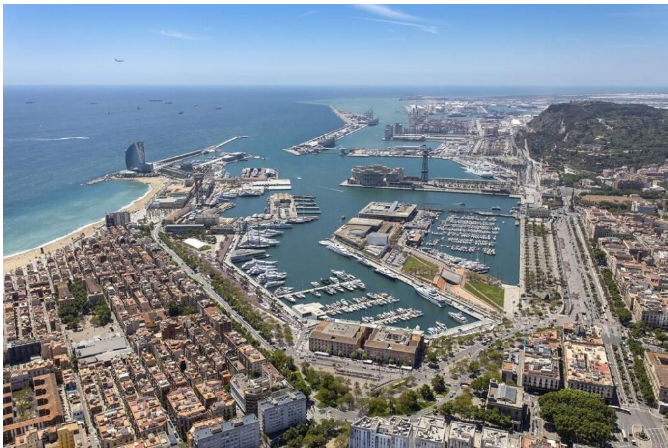
Vista general del Port Vell. (© Port de Barcelona).