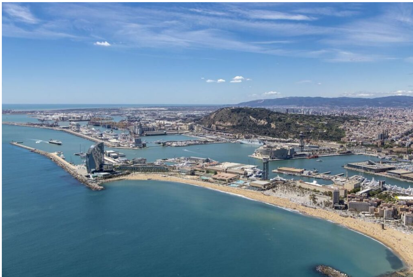
La ciudad de Barcelona con la Playa de Sant Sebastià en primer plano. (© Port de Barcelona).