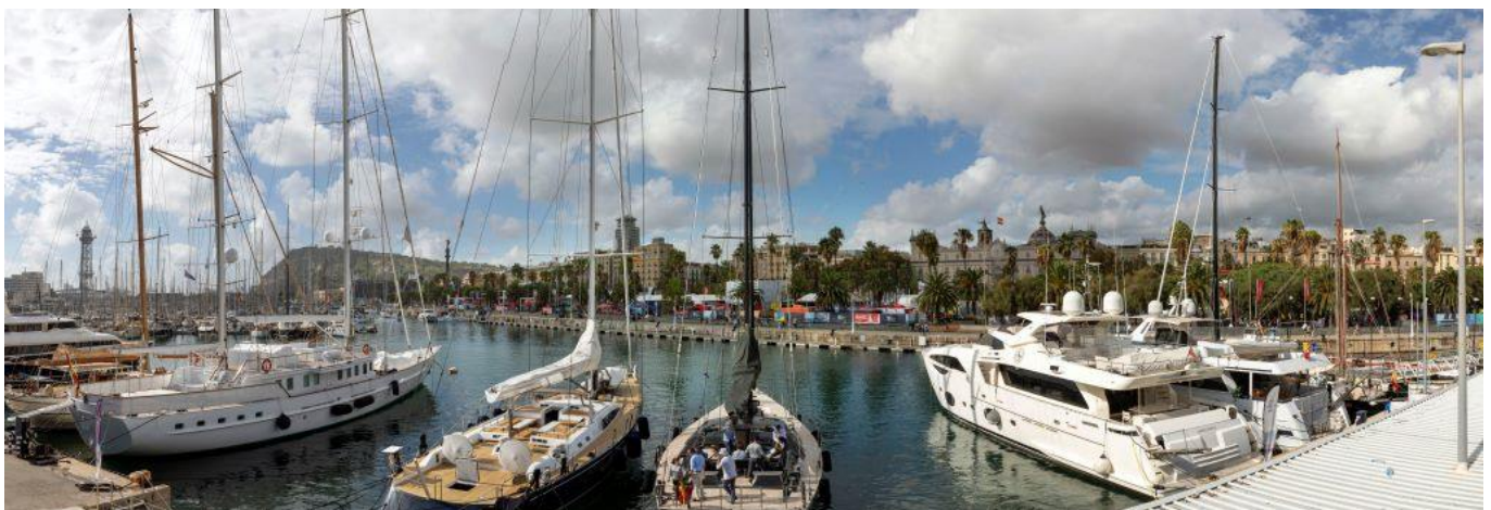
Una vista de la ciudad de Barcelona desde el Port Olímpic.