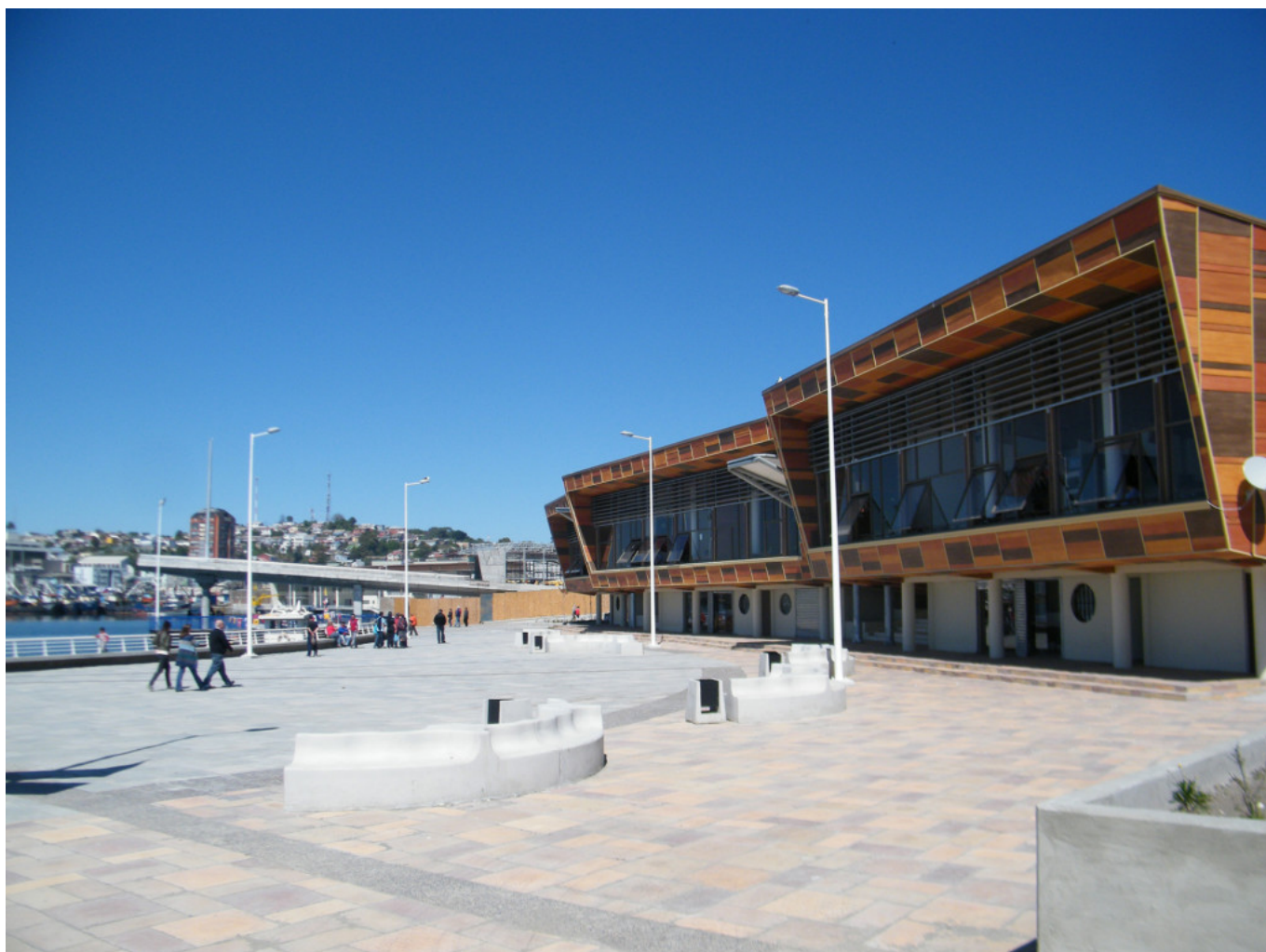
Vista general de los restaurantes (bentotecas) y espacio publico.