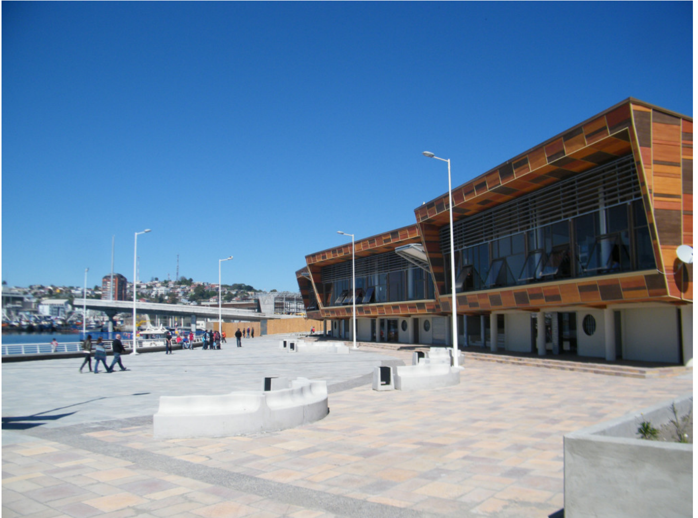
Vista general de los restaurantes (bentotecas) y espacio público.