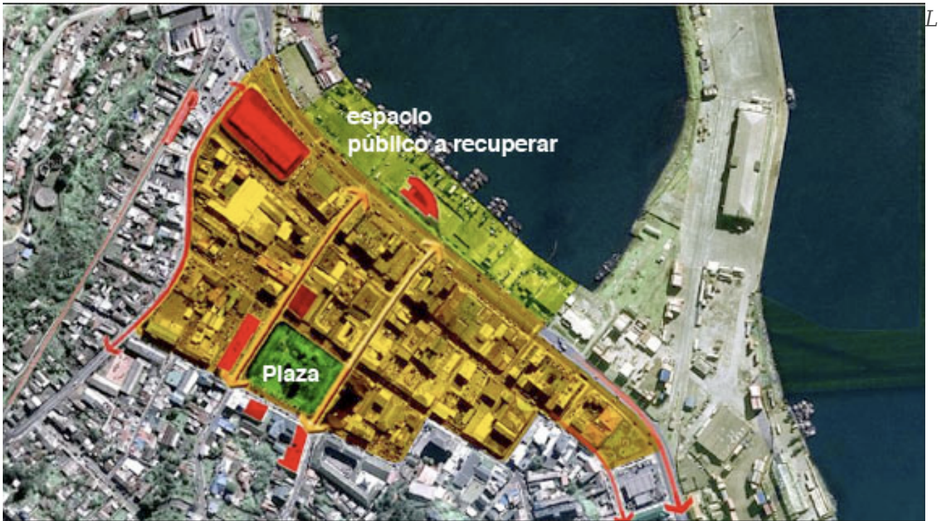
a zona de intervención del área céntrica de la ciudad.

También es importante destacar aquellas obras que se ejecutarían a mediano plazo, entre ellas; Nuevo Edificio Consistorial, Teatro Dante, Reposición del Coliseo La Tortuga, y la reposición y diseño del Palacio de los Deportes.