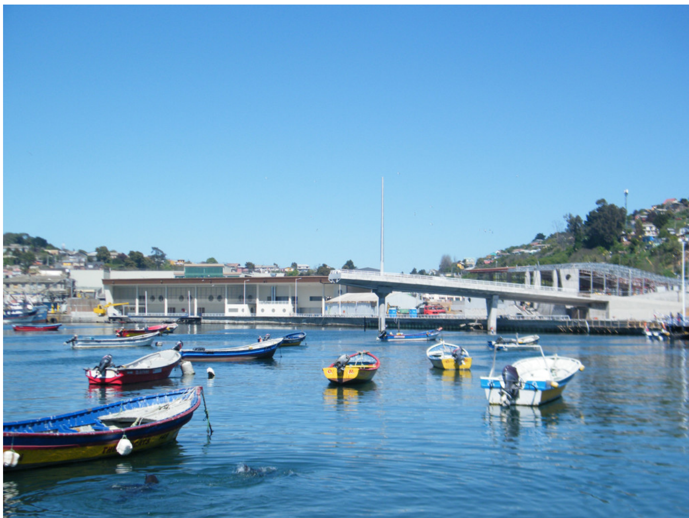
Vista general hacia el terminal pesquero.