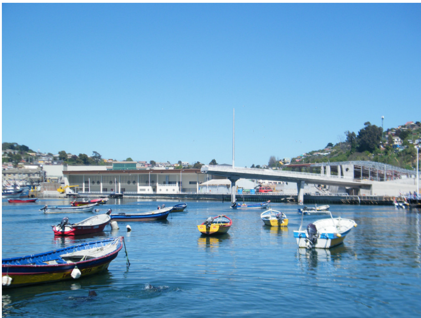
Vista general hacia el terminal pesquero.