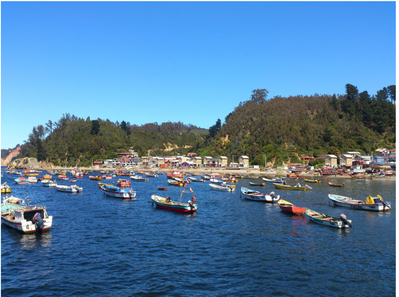
Vista panorámica desde el nuevo muelle.

Por ser una localidad costera, el terremoto, la afectó gravemente, con pérdidas de vidas humanas, viviendas, infraestructuras y embarcaciones. Del mismo modo, el Plan de Reconstrucción del Borde Costero, recogió esta problemática generando una cartera de proyectos, incluyendo desde la reposición del muelle, muros de borde, y la explanada de servicios de pesca, junto con resolver los problemas de vivienda. La inversión pública estimada, excluida la vivienda, es de MMU$ 7.