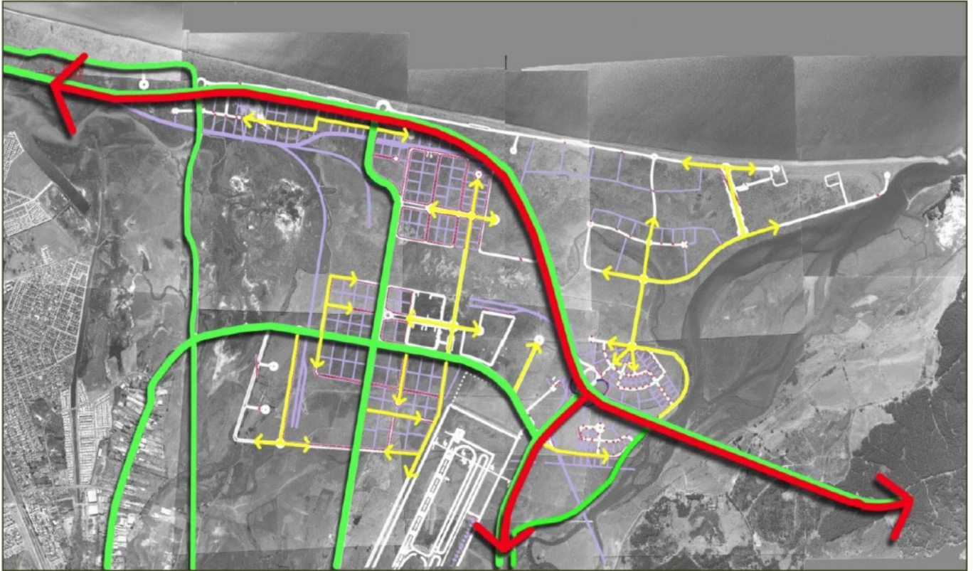
La vialidad estructurante y proyectada del proyecto.