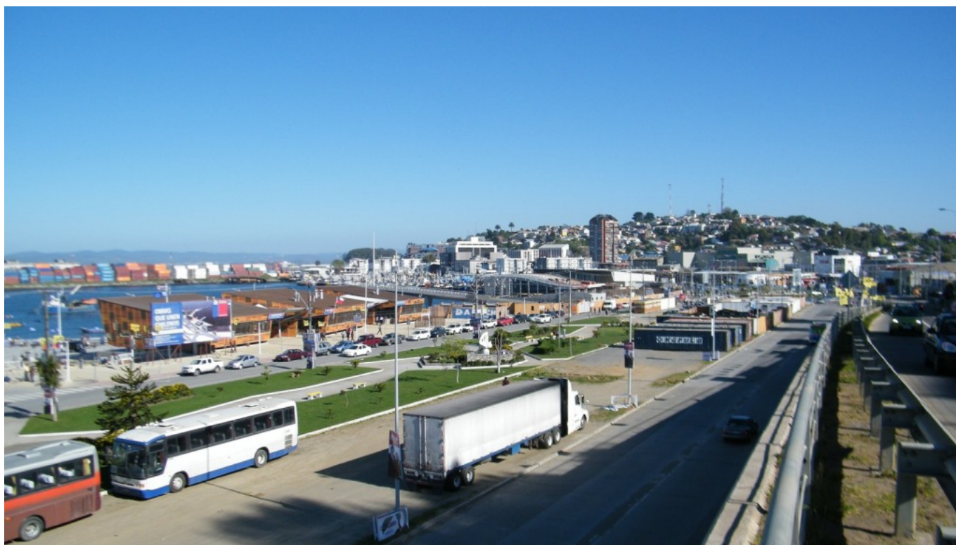
Vista panorámica de la Poza Blanco Encalada.