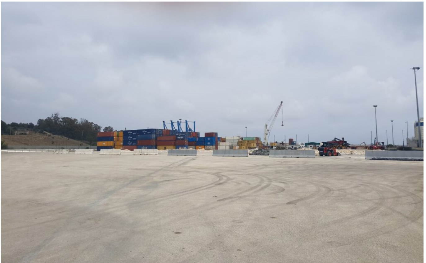
Il terminal container nel Porto di Augusta.

In addition, work is underway to expand the existing yards through the construction of an additional container terminal, in the area north of the existing one, which will have an extension of about 120,000 square metres and three operational quays, for a total development of about 600 metres. Furthermore, Augusta has a direct connection to the regional motorway system, which allows a clear separation between the different types of flows, thus avoiding congestion of city traffic.