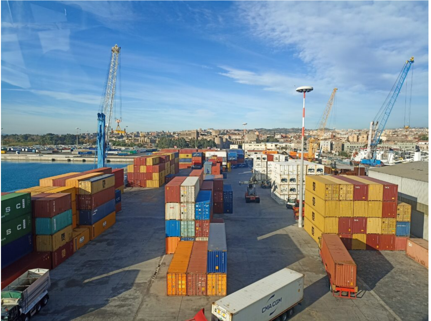
Il terminal container nel Porto di Catania.

currently underway, to relaunch the mode of transport of goods by rail, which is currently marginalised due to the structure of the railway network.