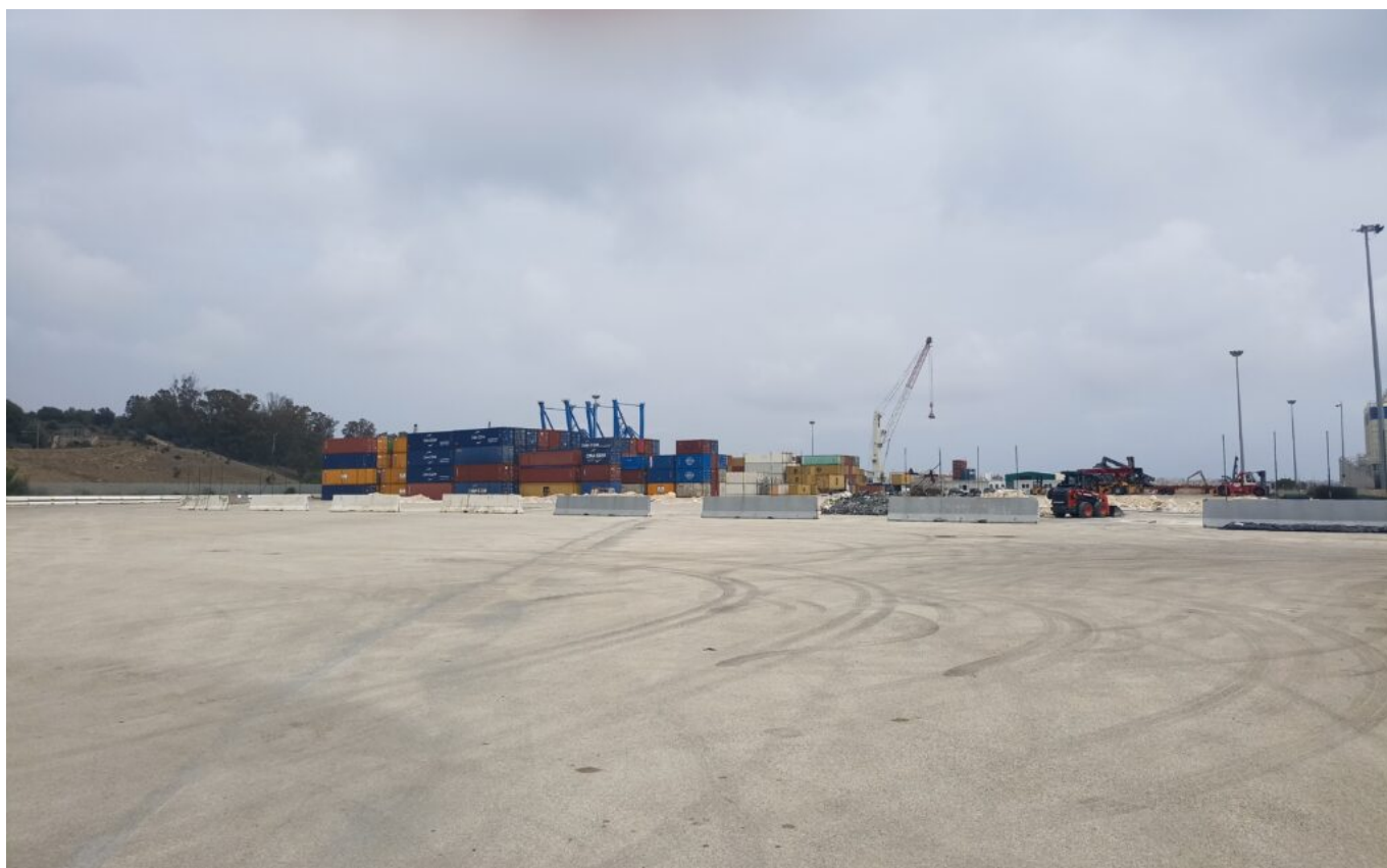
Il terminal container nel Porto di Augusta. (Foto: Elena Cocuzza).