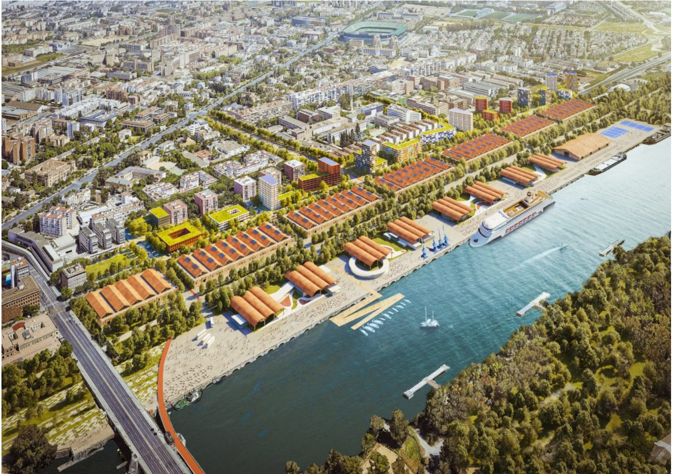
Recreación del ámbito del Nuevo Distrito Urbano-Portuario. (© Oficina Técnica del Distrito Urbano y Portuario).

ENTREVISTADOR | Editorial Team of PORTUS Magazine