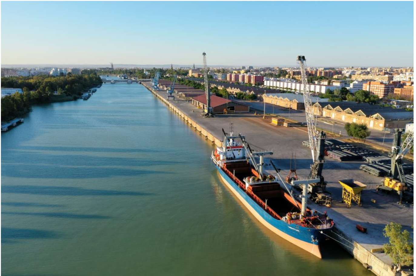
Vista área de Muelle de Tablada, ámbito que se transformará en el nuevo Distrito Urbano-Portuario de Sevilla.

Las grúas serán un icono representativo e identitario del nuevo barrio y la terminal de cruceros, uno de los hitos de la actuación. La vida portuaria continúa siendo más urbana, más turística y más náutica.