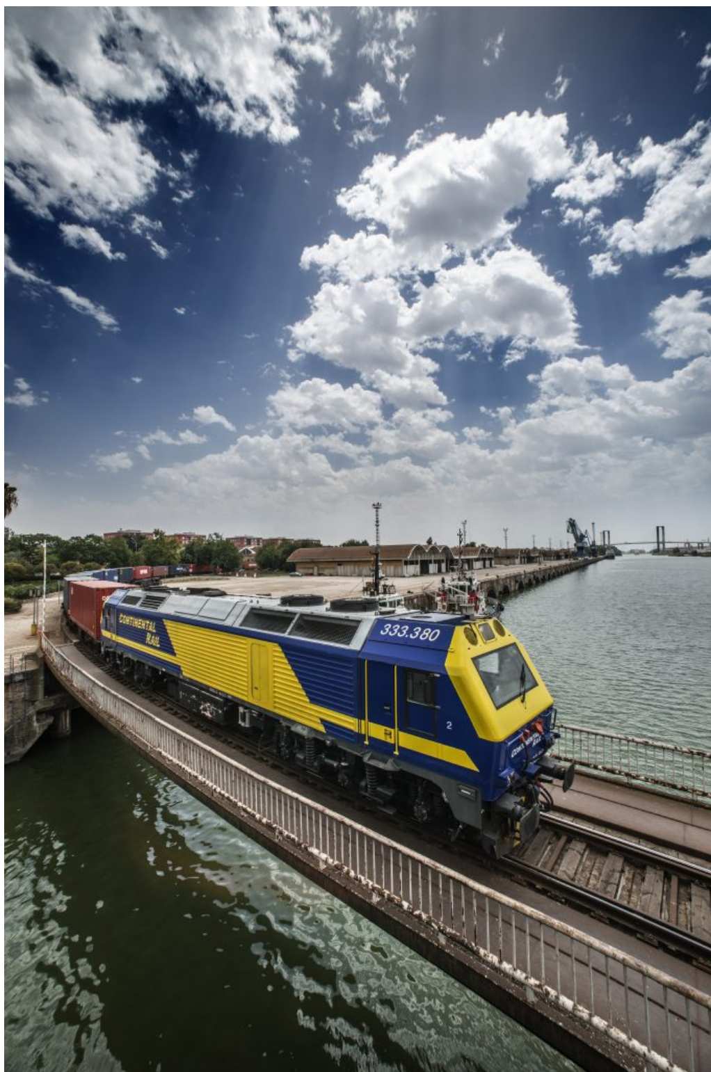
Ferrocarril cruzándose la dársena circulando por el vario paralelo al Puente de las Delicias.