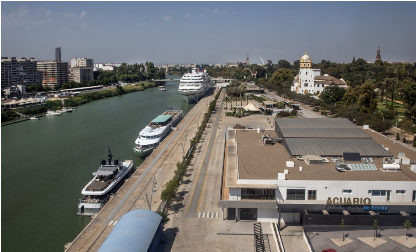
Vista área de Muelle de las Delicias.

Hoy en día, el Muelle de las Delicias es un espacio ya consolidado, que cuenta con instalaciones modernas y sostenibles como el Acuario de Sevilla, un Centro de Emprendimiento Tecnológico, restaurantes, zonas verdes y de paseo, y un aparcamiento subterráneo.