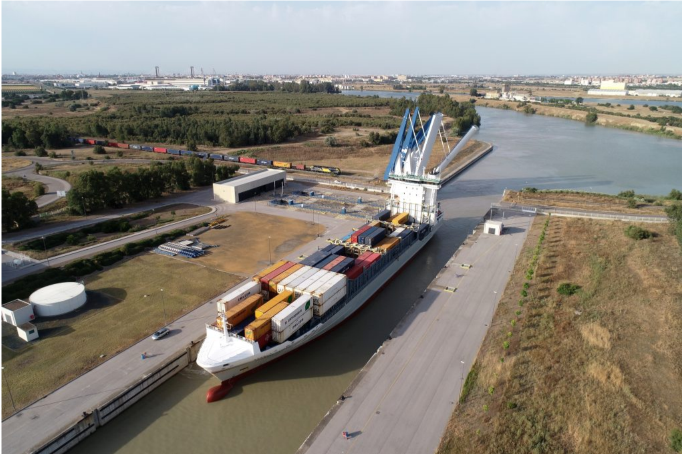
Ejemplo de multimodalidad. Tren y buque cruzando la esclusa "Puerta del Mar".

Las relaciones puerto-ciudad están marcadas por nuestra proximidad. El puerto históricamente ha sido la razón de ser de Sevilla y, hoy en día, queremos que siga siendo una fuente de oportunidades y orgullo para los sevillanos. La ciudad ha prosperado de la mano de su puerto; pero también, por el río llegaron las inundaciones en época de crecidas. Para proteger a la ciudad de este riesgo, la Institución portuaria ha abordado distintos proyectos que han dado forma al actual entramado urbano. Uno de los más significativos fue la transformación del río en dársena con la construcción de la primera esclusa. Ahora, nos encontramos en un periodo de expansión hacia el sur en el que trasladaremos la actividad portuaria para crear un nuevo barrio en el Distrito Urbano-Portuario.