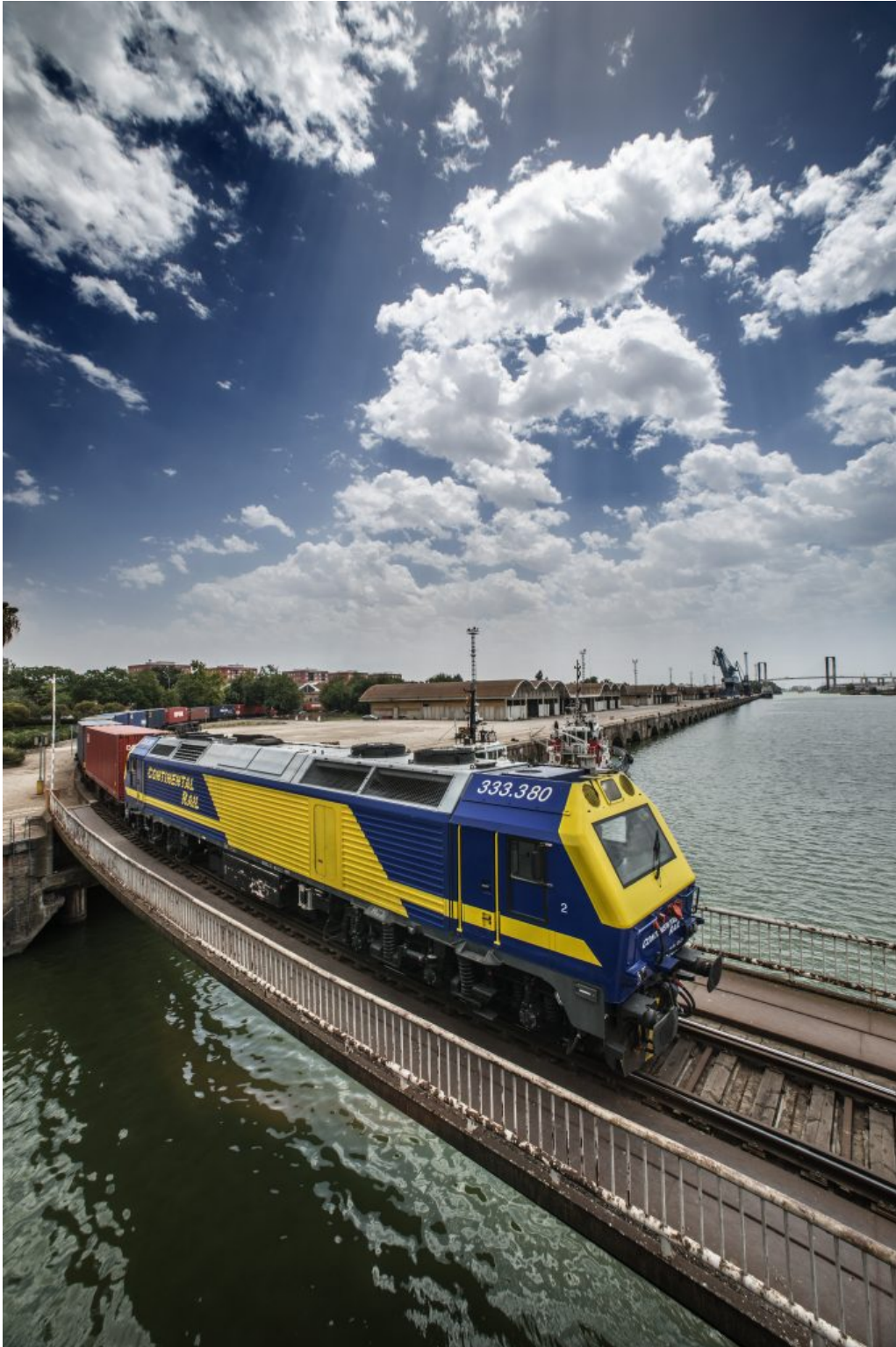
Ferrocarril cruzándose la dársena circulando por el vario paralelo al Puente de las