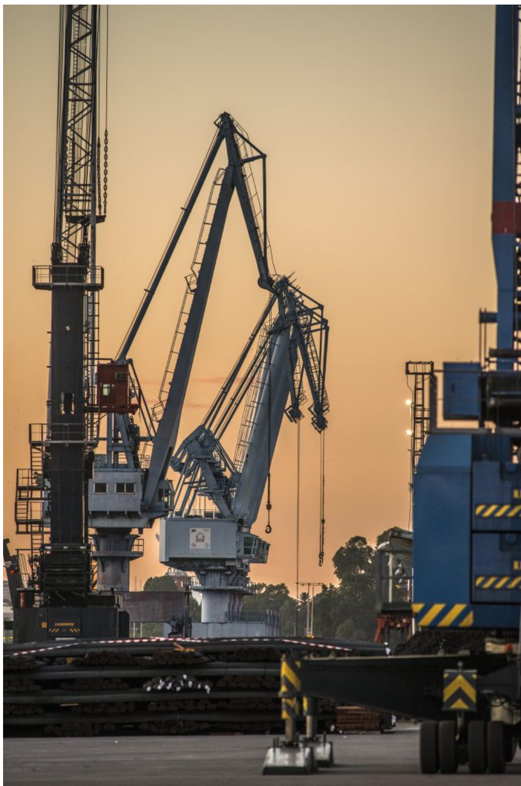
Actividad portuaria en el Muelle de Tablada que se trasladará hacia el sur.