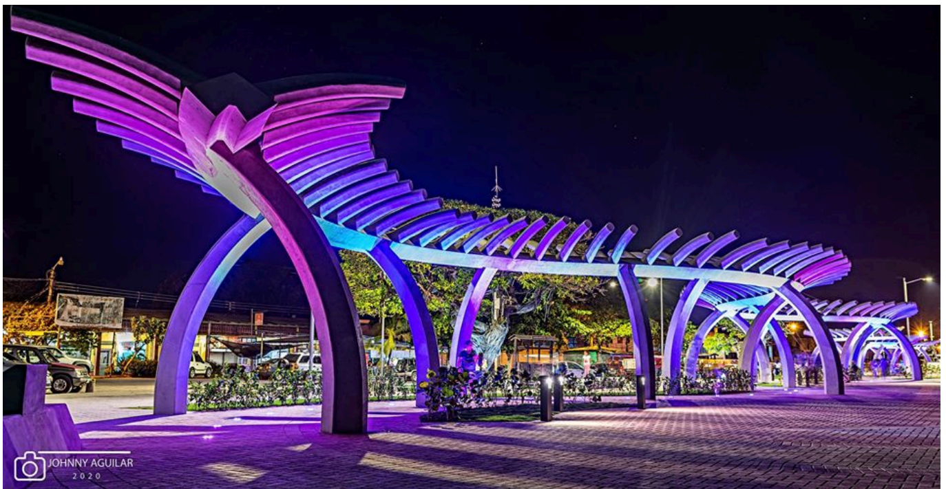
Night image of the “Parque del Muellero” along the promenade of the Puntarenas city. (© Johnny Aguilar, 2020).

Despite everything, I have no doubt that the “Parque del Muellero” will become a public space of national reference.