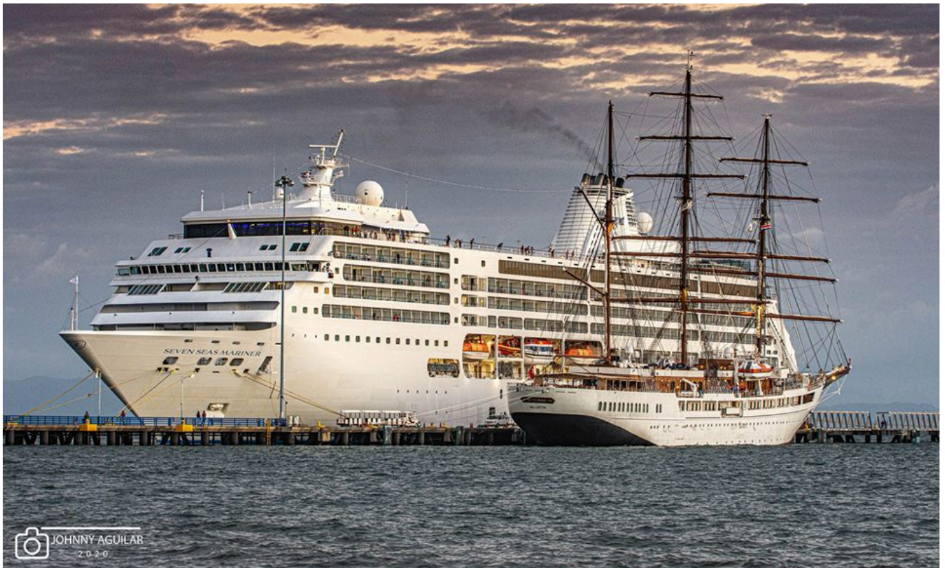
Cruise and sailboat in the port of Puntarenas. (© Johnny Aguilar, 2020).

In Puntarenas, located on the Pacific Ocean coast of Costa Rica, an outstanding urban infrastructure project was recently inaugurated: the “Parque del Muellero”. It was built to strengthen the development of the city’s waterfront, and to link the cruise industry and local culture with recreation, commerce, and daily life in nearby neighborhoods. However, despite the fact that the work have not been used enough, due to the crisis generated by COVID-19, it is hoped that once the pandemic is over, the cruise industry will resume and the local economy will be activated.