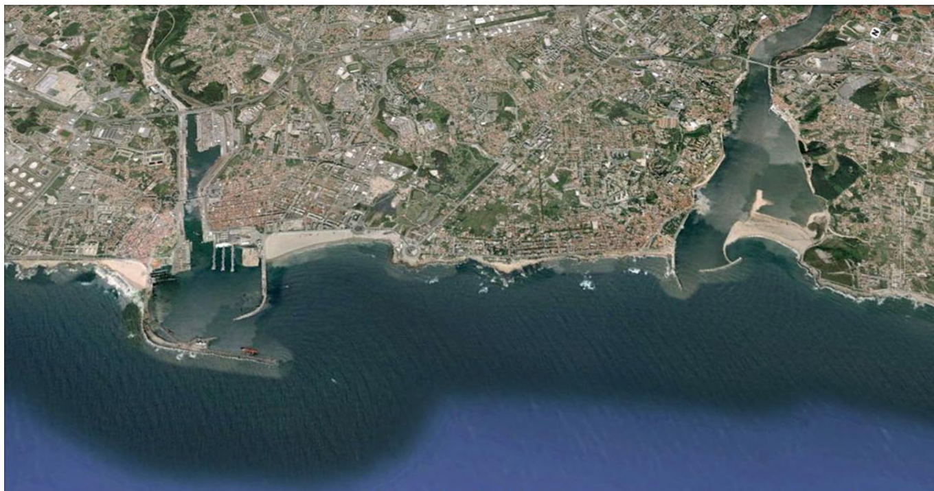
Aerial photograph of the Leixões Port and estuary of the Douro from the Atlantic.