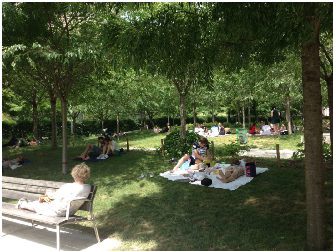
Parc Martin Luther King. (fig.6)