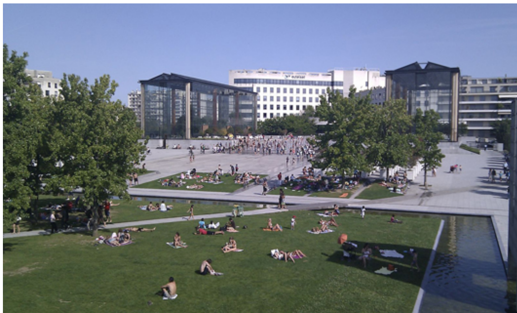
Parc André Citroën. (fig.4)