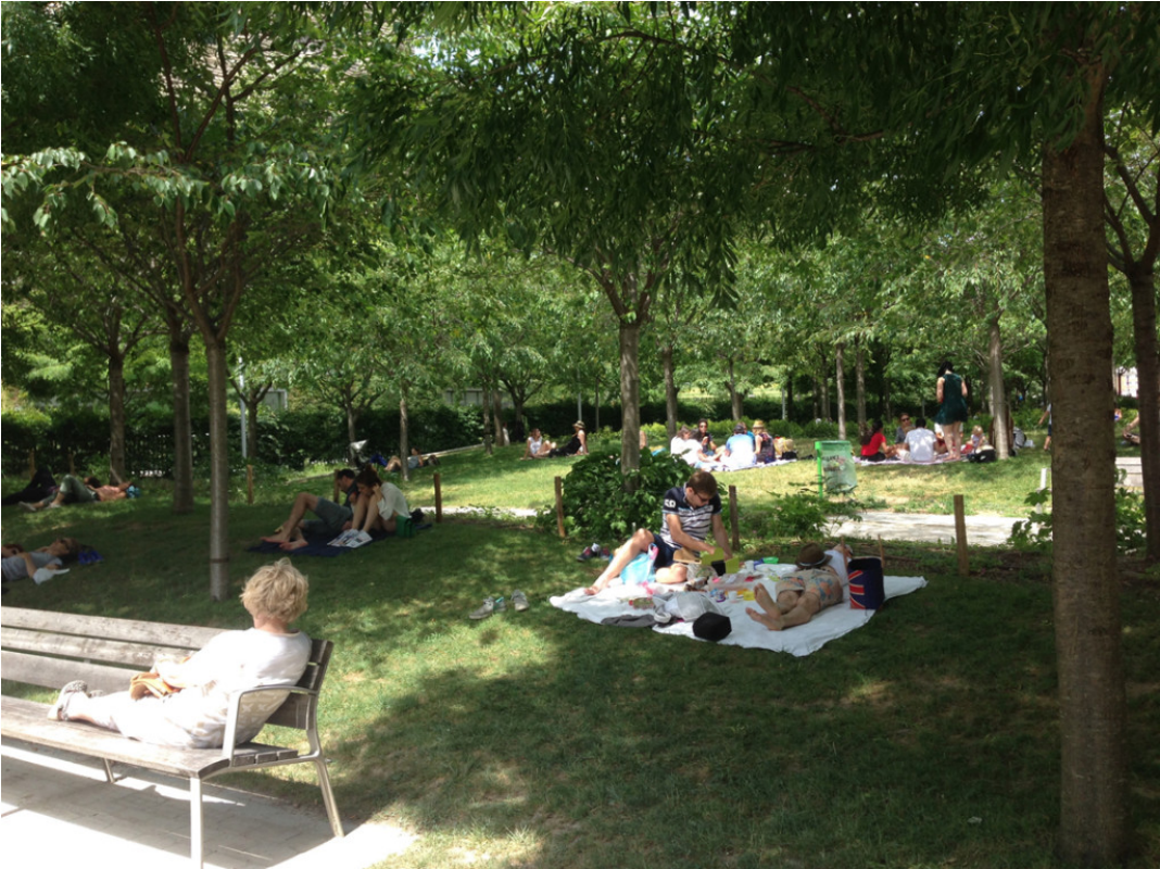
Parc Martin Luther King. (fig.6)