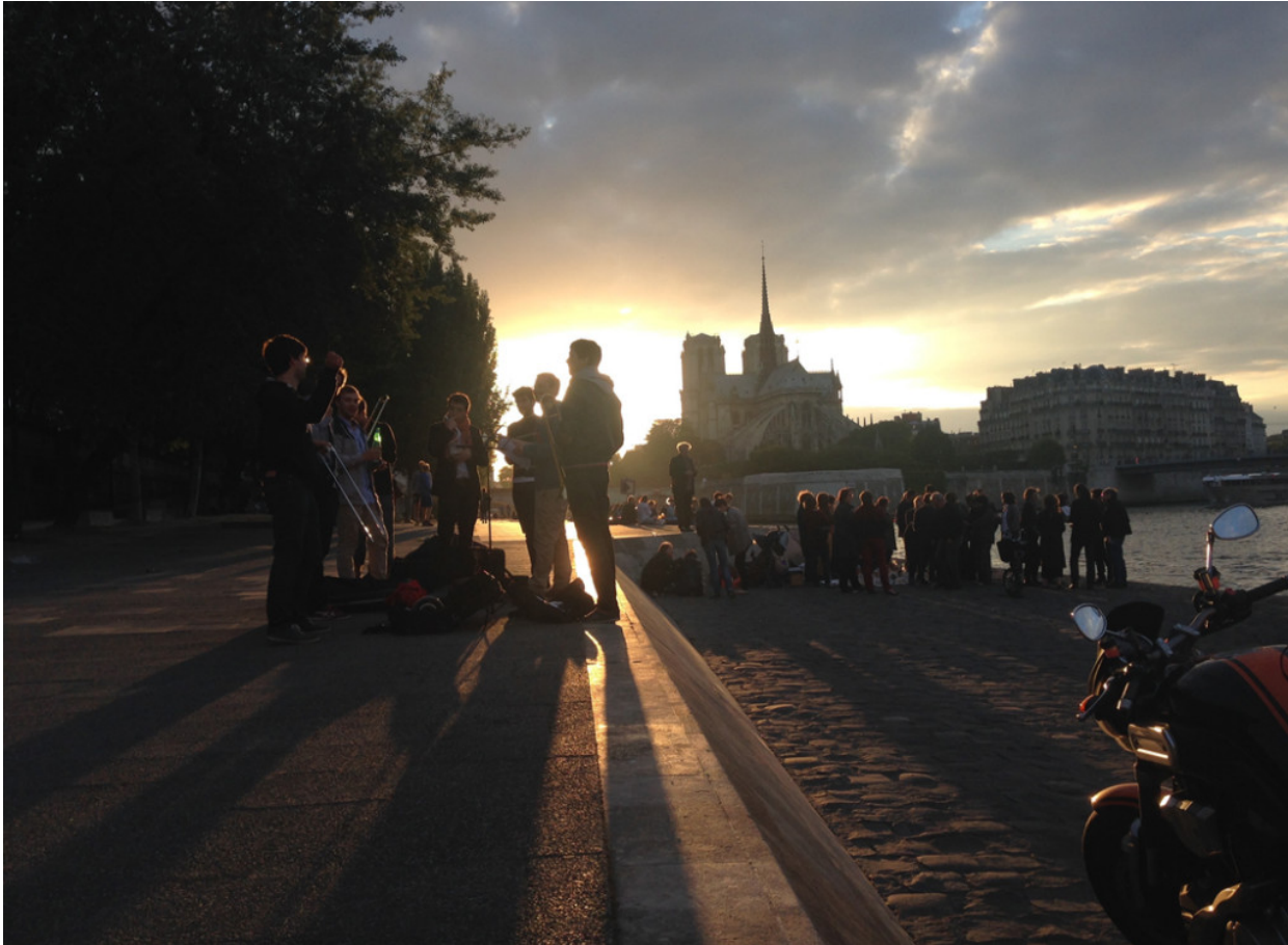
Apses of Notre Dame views from Seine. (fig.13)

Like all rivers of continental cities, the Seine has adopted the most ancient settlement within her fertile meanders and has fostered its development by supporting transport and communication, by serving as mean of supply and sewerage.