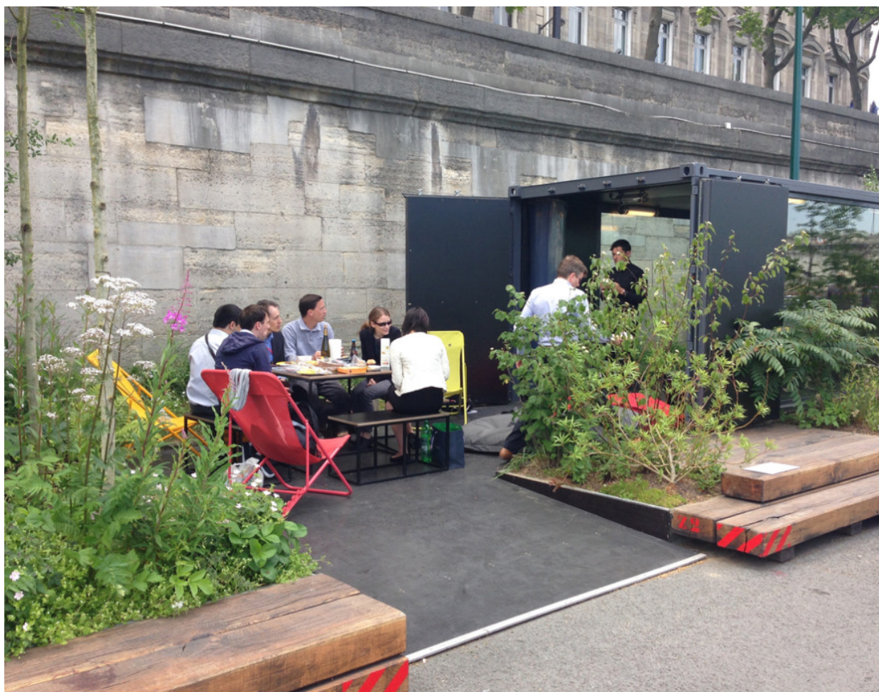
Les Berges de la Seine. (fig.16-17)