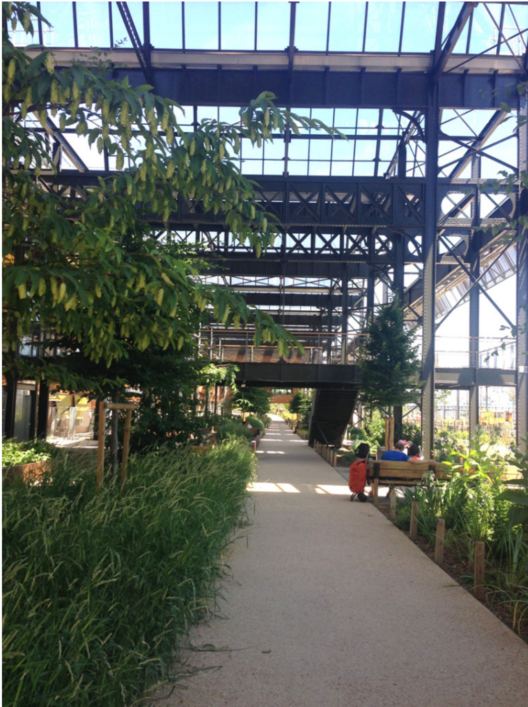
Jardin Rosa Luxemburg. (fig.7)