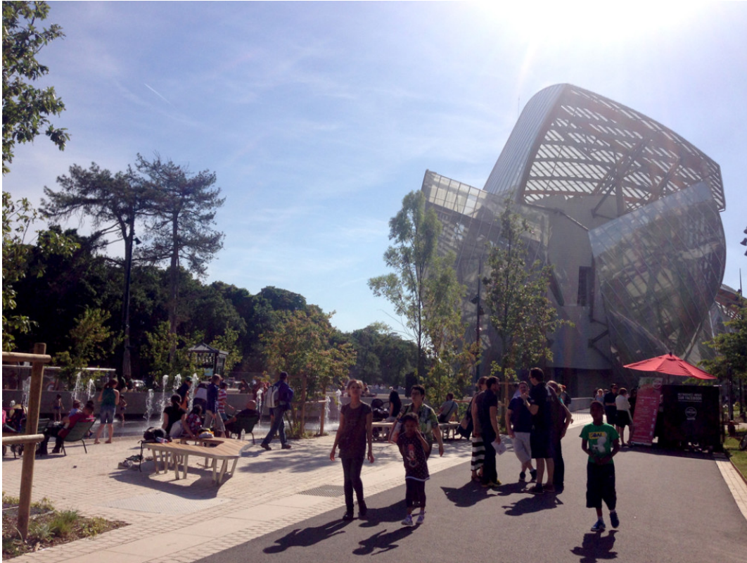
Louis Vuitton Foundation. (fig.8)

Picnic is not organized exclusively for sunny Sunday lunches: every single sunbeam that filters through the clouds overcasting the City is celebrated by fleeting tablecloths and nibbles. But action takes place above all in the evenings, when never-ending lines of picnickers crouch down on the quays of Saint-Martin Canal or the river Seine. Right there, every Parisian (native, of adoption or just passersby), loses sense of time while catching with his eyes the sun slowly setting down (figg 9-10).