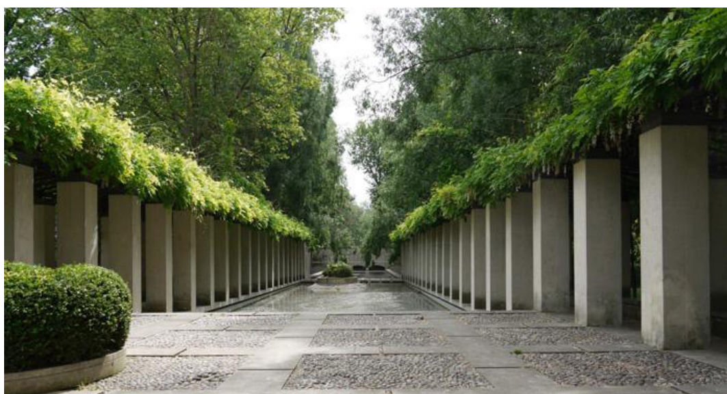
Parc Bercy. (fig.5)