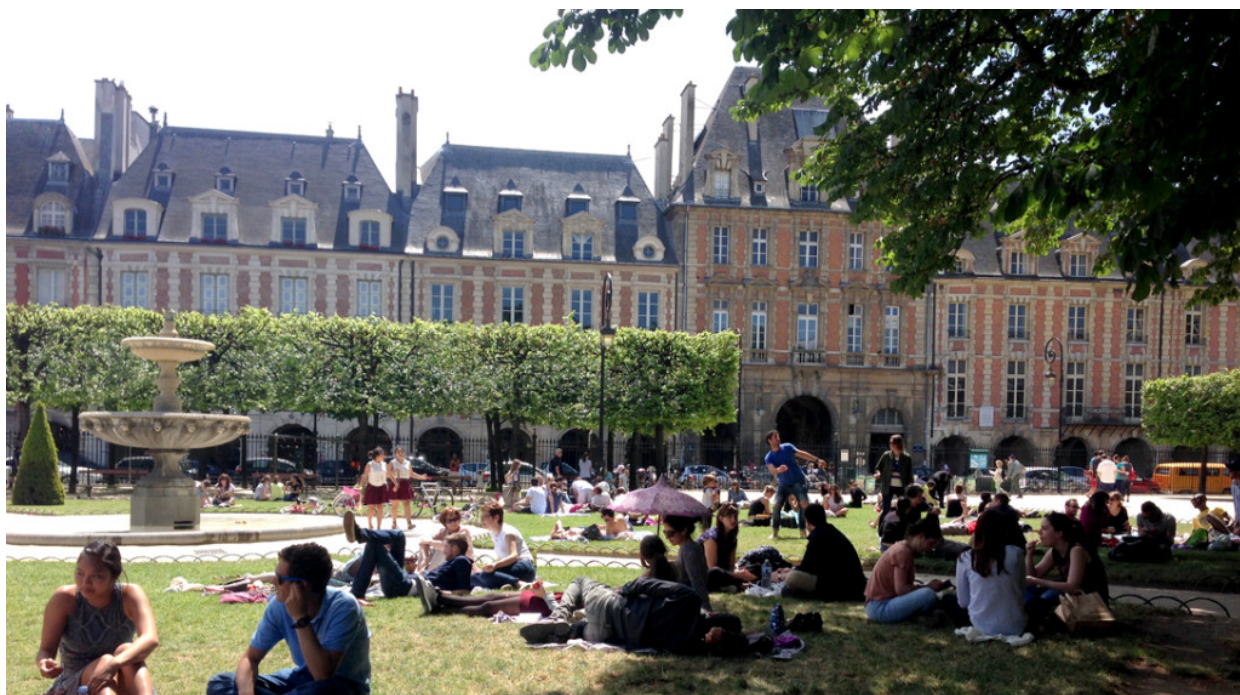
Place des Vosges. (fig.2)