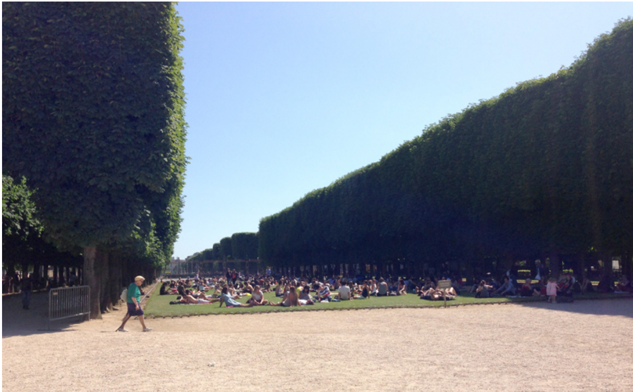
Jardin du Luxembourg. (fig.1)