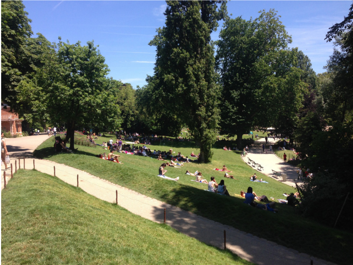
Parc des Buttes Chaumont. (fig.3)