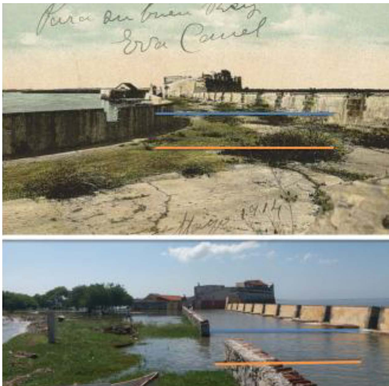
Analisis comparativo por foto superior de 1914 y foto inferior del 2017 con 105 años de diferencia detectada a 2019 de subida del mar, basados en estas y la cartografía de los Ingenieros militares españoles del los Siglos XVIII y XIX con 1.50 mts.aprox.