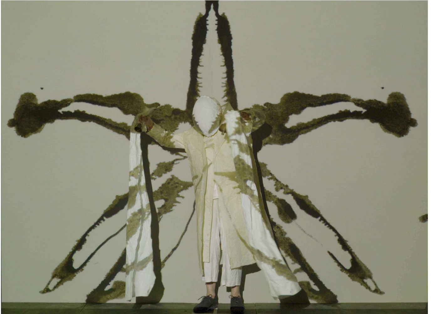
Joan Jonas, Moving Off the Land II, 2019, video, courtesy of the artist.

Joan Jonas is one of the most renowned artists of her generation. She is celebrated as a pioneer of performance and video art since the 1960s, a time when art was leaving the confines of the gallery space, converged with dance, music, and theatre and tackled complex questions surrounding our relationship with the environment.