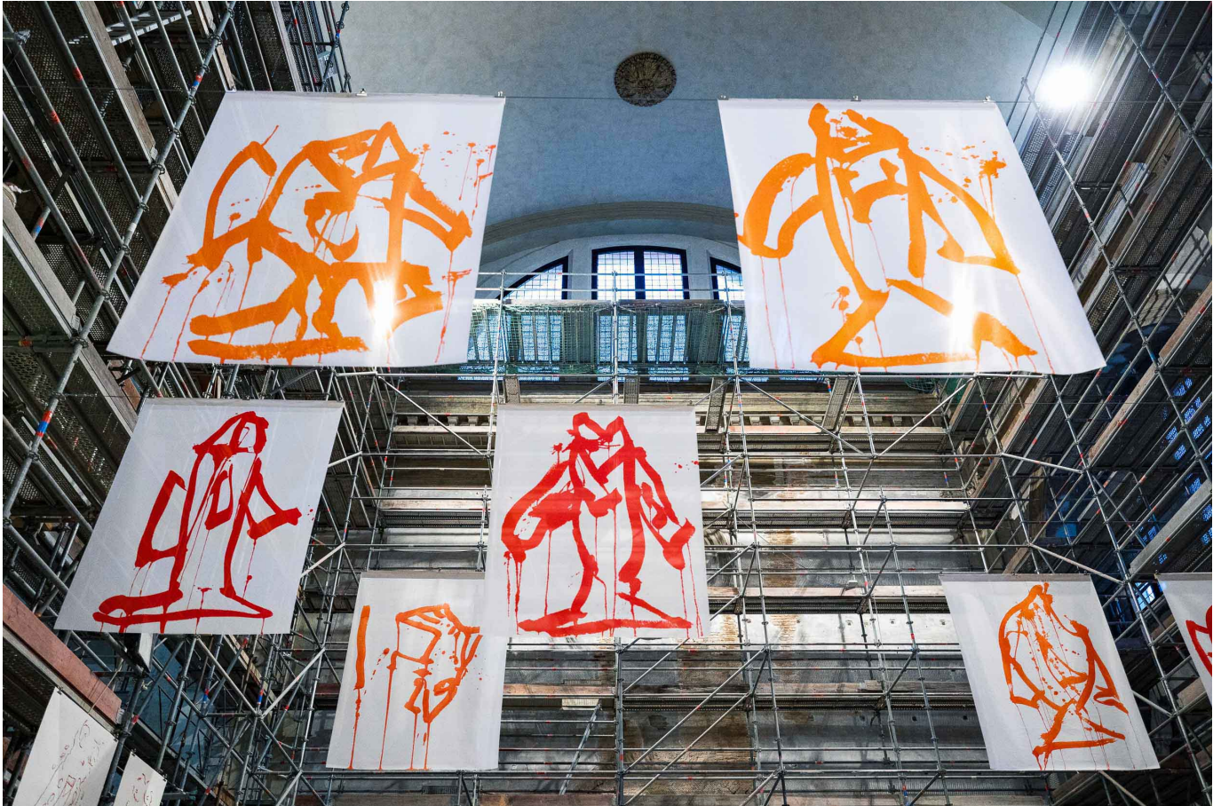
The church of San Lorenzo (left) and the Ocean Space project (right) in the recovered building.

With the “Ocean Space” project, the church of San Lorenzo, built in the mid-IX century, is reintegrated into the cultural fabric of the city, after an almost continuous closure to the public for over 100 years. Completely destroyed by a fire in 1140, the building was rebuilt in Gothic style according to the pattern it still preserves. Not used for over twenty-five years and opened only on special occasions during the Biennale of Art and Architecture, the Church is today the object of a profound restoration, funded in large part by the Viennese foundation, following having won the tender for its management, promoted by the Municipality of Venice.