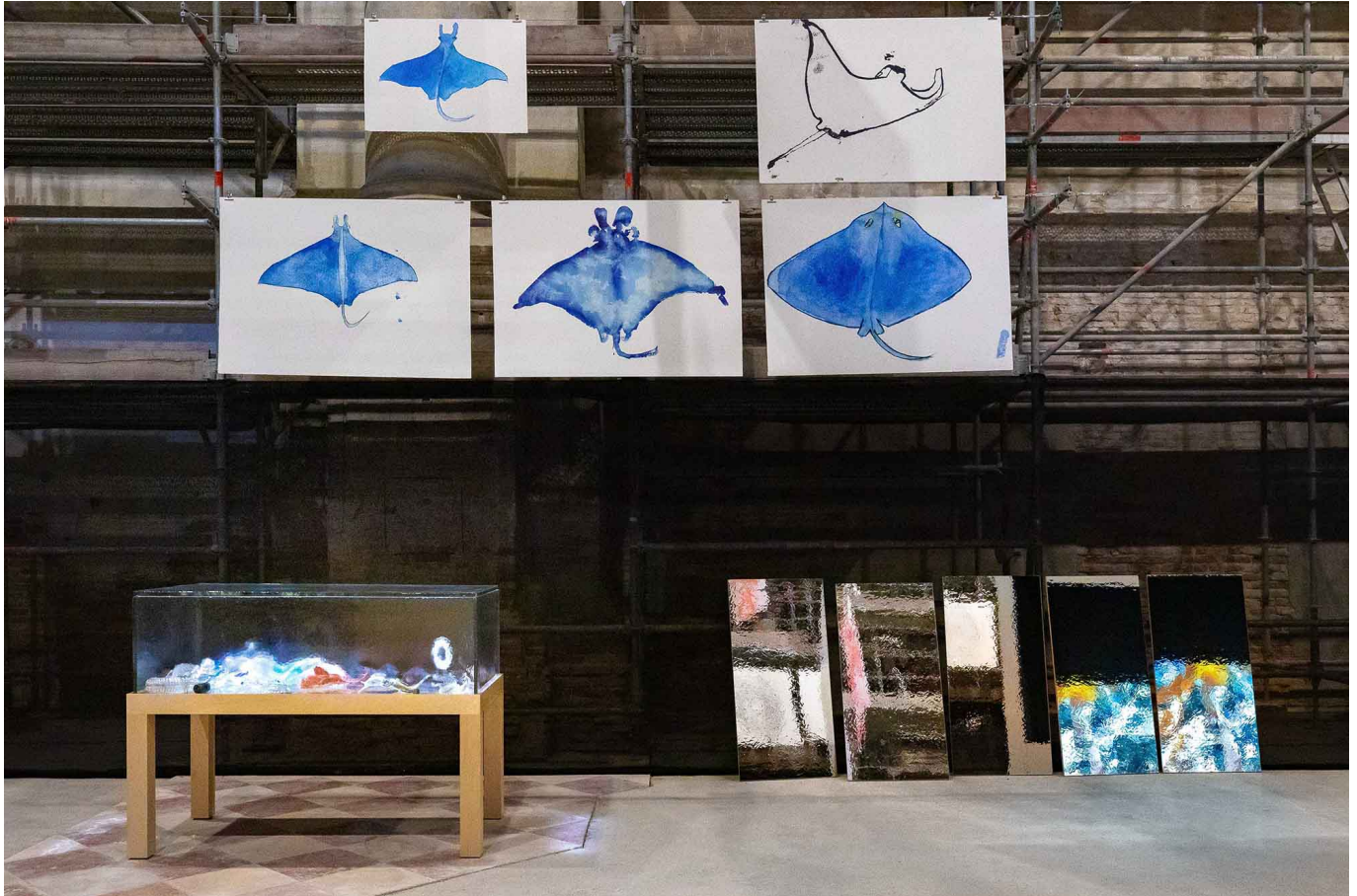
Joan Jonas, Moving Off the Land II, at Ocean Space, church of San Lorenzo, 2019, work in progress. Moving Off the Land II is commissioned by TBA21-Academy and co-produced with Luma Foundation.

Once fully accessible to the public, the space will host installations, shows, workshops and an archive for research, Ocean Archive , which will be inaugurated in September this year. This new digital platform will be a “co-laboratory” that combines scientific research, artistic intelligence and environmental protection and adheres to international ocean projects led by TBA21-Academy and its international network of collaborators.