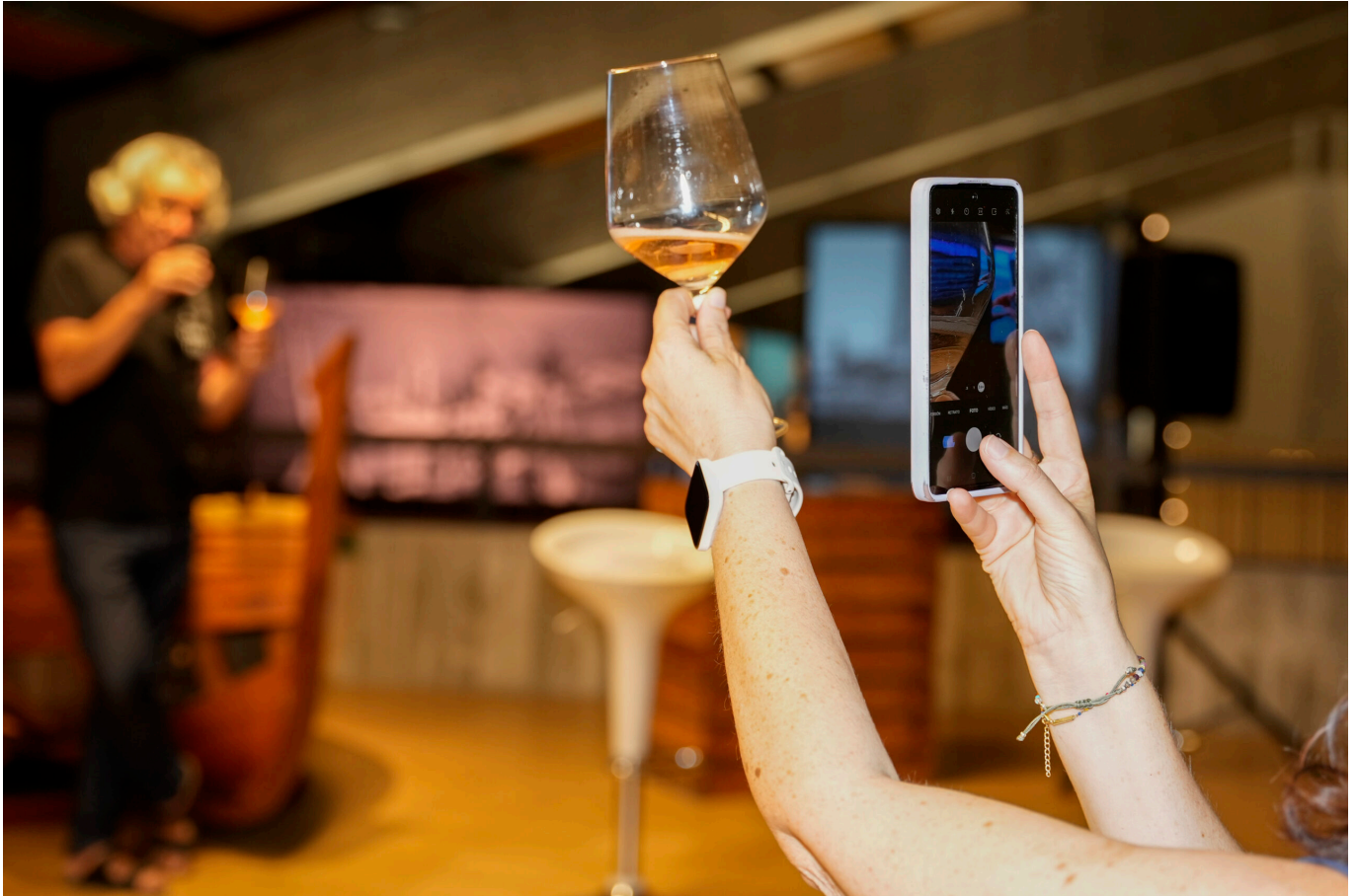
IMAGEN INICIAL | El Museu del Port de Tarragona ha cumplido 25 años, convirtiéndose en el buque insignia del proyecto de puerto-ciudad de Tarragona.