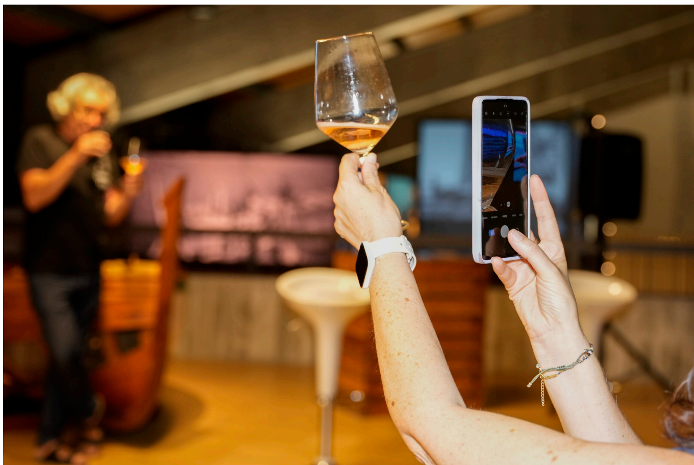
IMAGEN INICIAL | El Museu del Port de Tarragona ha cumplido 25 años, convirtiéndose en el buque insignia del proyecto de puerto-ciudad de Tarragona.