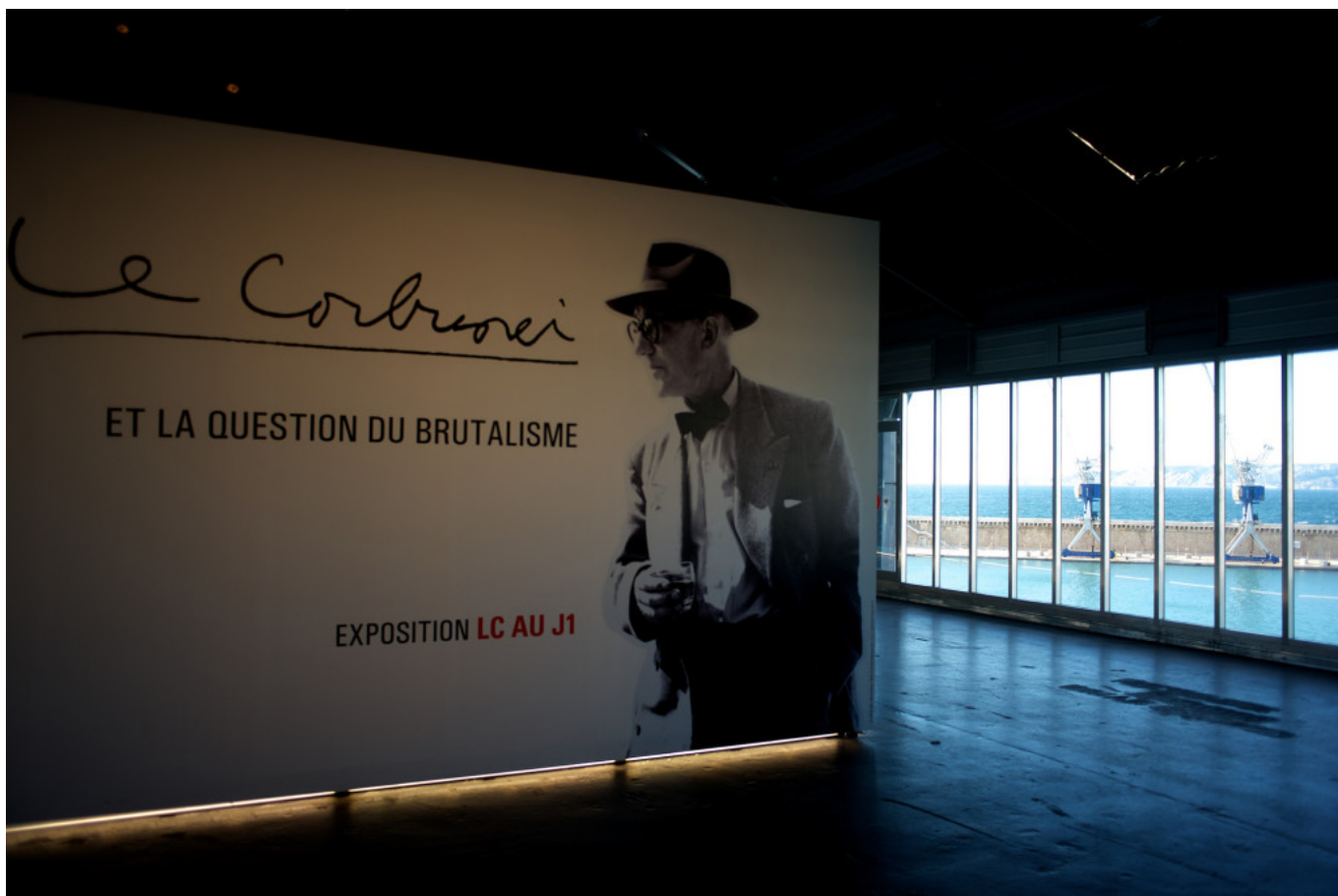
Interior of the J1.