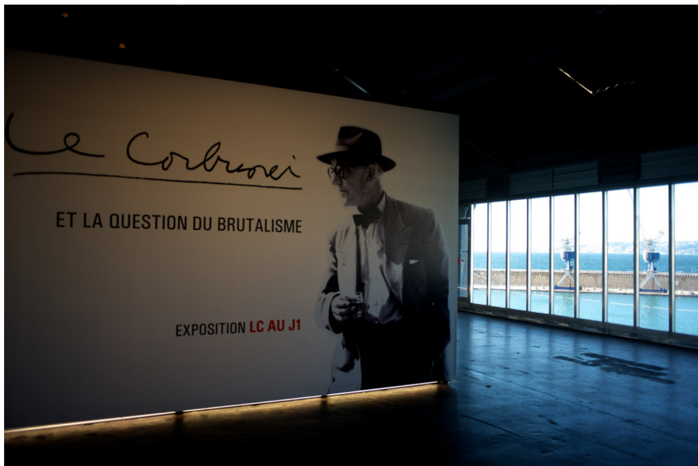
Interior of the J1.