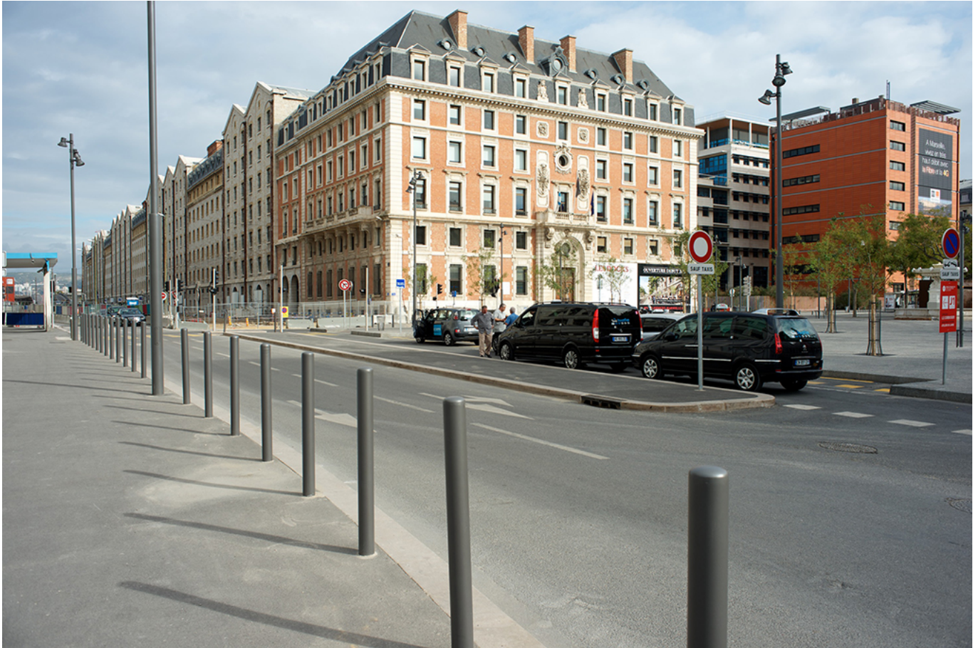
The Docks.

To carry out this ambitious project of renewal and revitalization of the port area another important intervention has been needed in terms of traffic infrastructures. The highway that separated the city from the port has been removed, the direction of traffic has been reorganized and two interesting footbridges have been built between the Fort Saint Jean and Le Panier and between Fort Saint Jean and the terrace of the MuCEM. It is too soon to know if the reorganization of traffic directions will be enough to promote the direct relationship, the global connection and the dialogue between the urban areas and the new buildings, that are the aim of the Euroméditerranée project or if the traditional physical and functional separation between the city front and the port area will continue to exist. In fact, the extended area dedicated to the ferry traffic with the North of Africa, closed because security rules with a double barrier, is, without doubt, a discontinuity zone that introduces a difficulty to the relation between all the projects. The footbridges for pedestrians are very