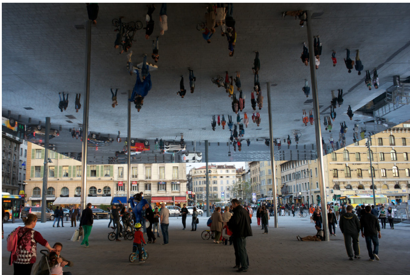
Amusing cover of the Quai de la Fraternité.