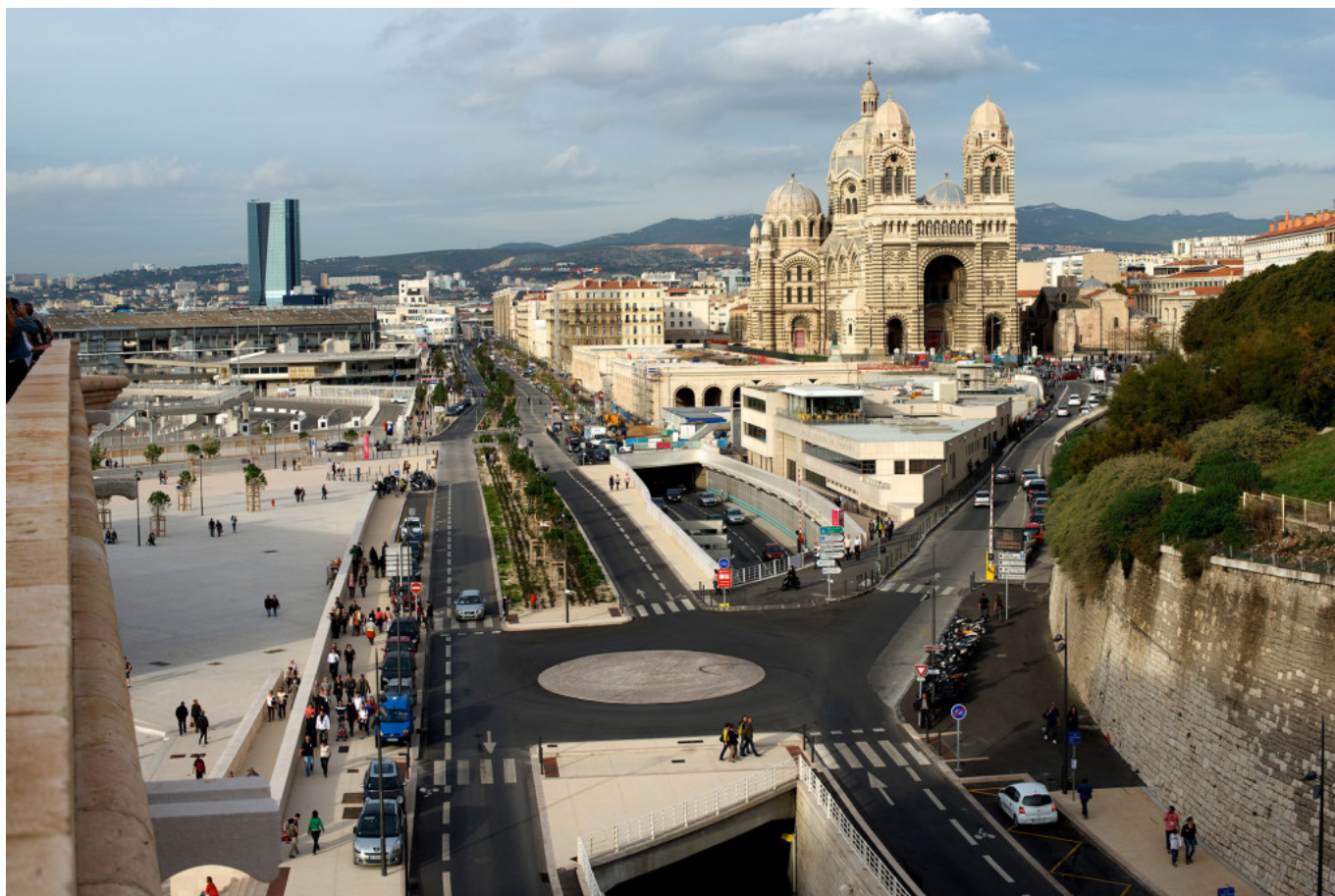
Road infrastructures in La Joliette. (© Joan Alemany, 2013)

positive tools to help the connection between the different city areas and the port and to facilitate the access of the citizens.