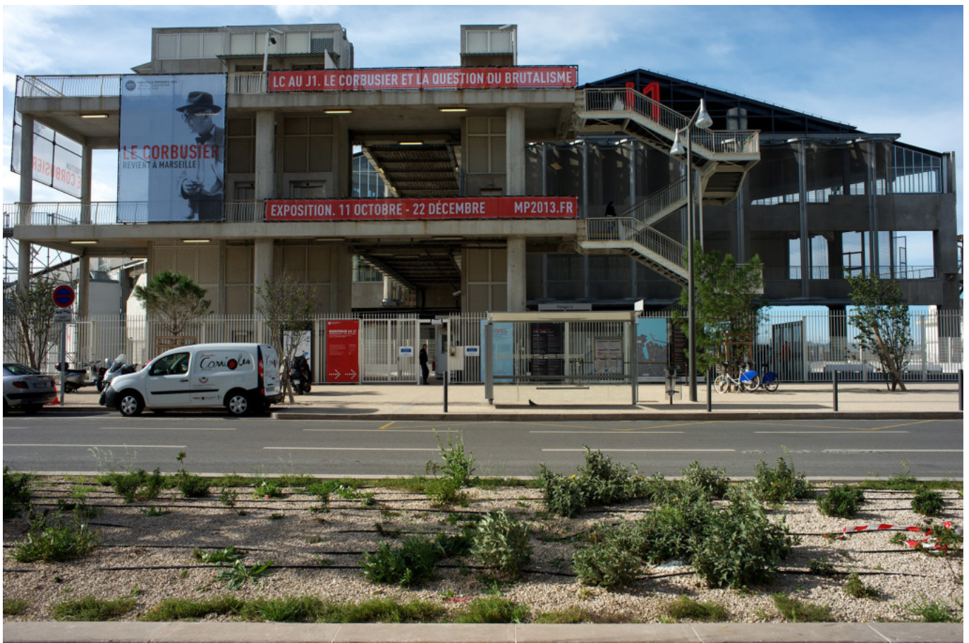
J1 warehouse.