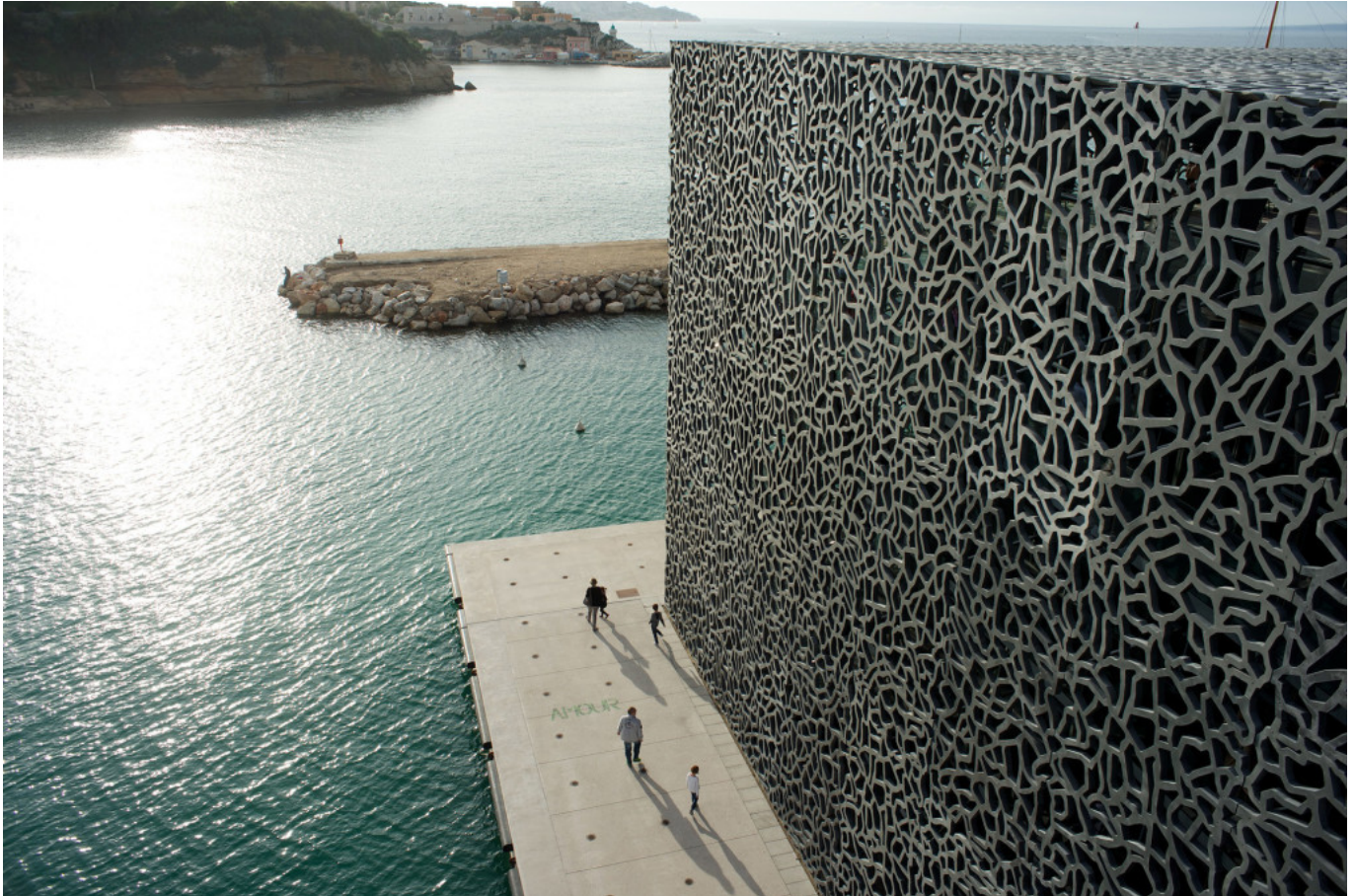
Dock of the MuCEM.