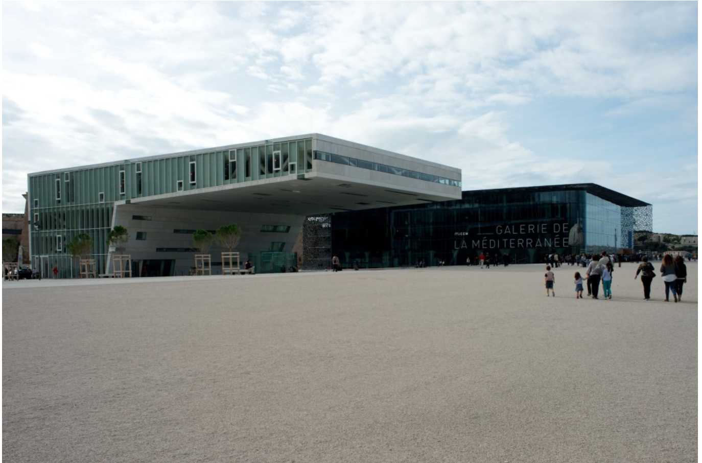
Villa Méditerranée and MuCEM. (© Joan Alemany, 2013)