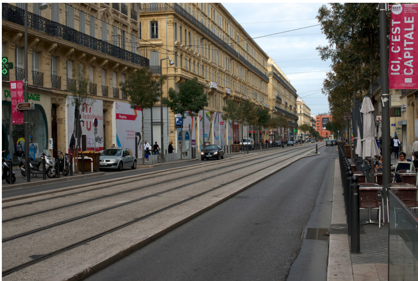
Rue de la République.