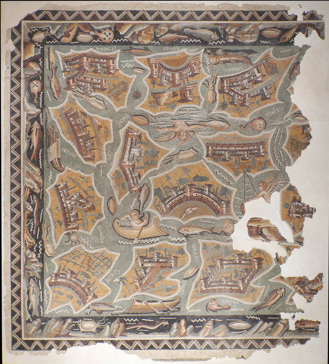
Mosaïque aux îles, III-IVe siècle apr. J.-C., Haïdra, Tunisie. 492 × 536 × 7 cm. Institut national du patrimoine, Tunisie.