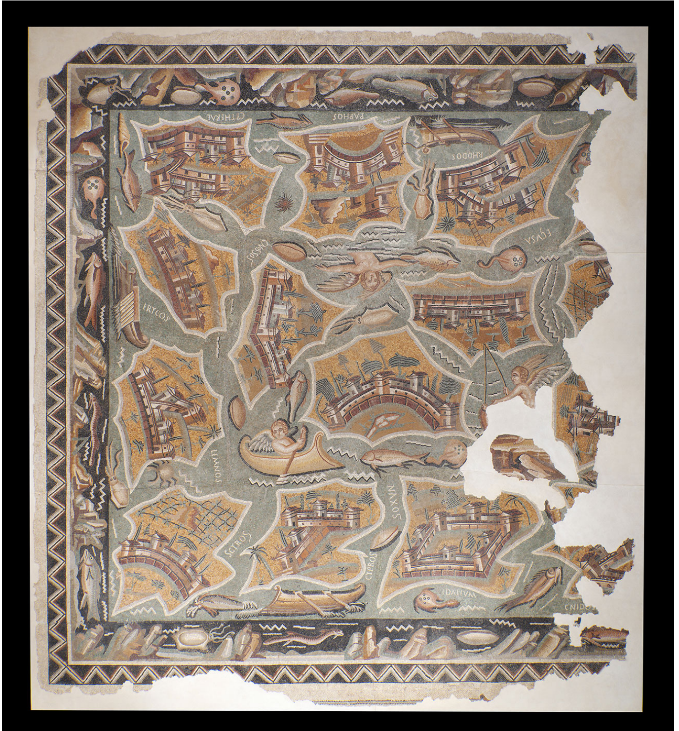
Mosaïque aux îles, III-IVe siècle apr. J.-C., Haïdra, Tunisie. 492 × 536 × 7 cm. Institut national du patrimoine, Tunisie. (© Institut National du Patrimoine, Tunisie, photo Rémi