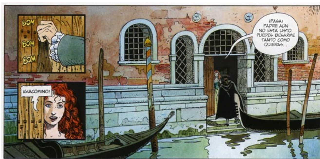
Una máscara en la boca de las tinieblas. Jean Dufaux (guión) y Griffó (dibujo). (© Giacomo C. n. 1, 1988)

un cómic, sino más bien un libro de ilustraciones con textos de diferentes colaboradores además de los del propio autor. Impresionante representación real y onírica de la ciudad de Venecia.