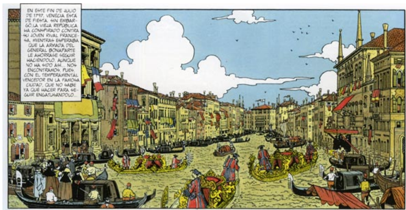
Arno. Jacques Martin (guión) y André Juillard (dibujo). (© 1984)

El gran dibujante Jacques Martin (1921-2010) colabora en esta ocasión como guionista con otro de los grandes dibujantes de cómic histórico como es sin duda André Juillard (1948). En esta ocasión Juillard realizaría las tres primeras historias de los seis álbumes de Arno, nombre del joven músico veneciano protagonista que se vería envuelto en un complot contra el emperador Napoleón Bonaparte a su llegada a la ciudad de los canales.