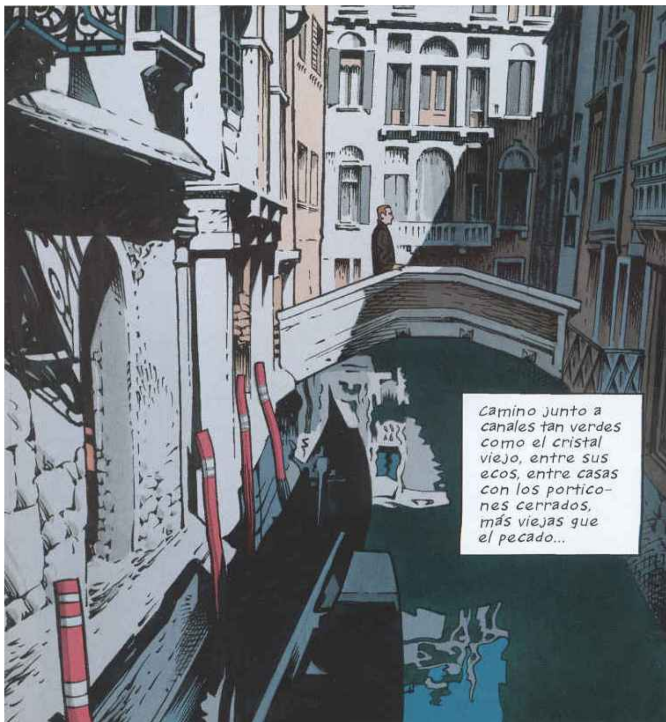
Muerte y Venecia. Neil Gaiman (guión) y P. Craig Russell (dibujo). (© The Sadman. Especial Noches Eternas. n. 1, 2003)