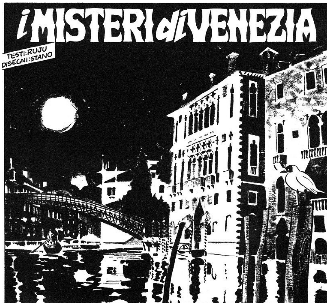
El misterio de Venecia. Pasquale Ruju (guión) y Angelo Stano (dibujo). (© Dylan Dog. n. 184, 2002)

Dylan Dog se ha convertido ya en un personaje universal, traducido a multitud de idiomas y con dos adaptaciones cinematográficas hasta la fecha. Creado en 1986 por el guionista Tiziano Sclavi (1953) para la editorial Bonelli, el protagonista es un detective clásico dentro