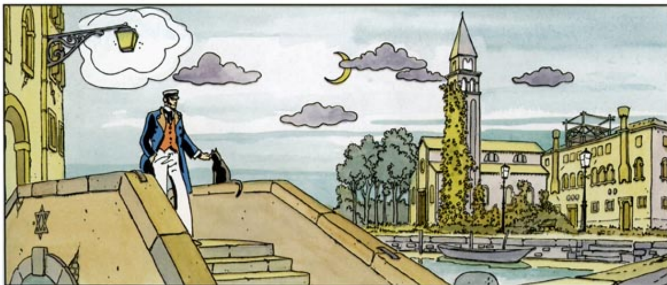
Fábula de Venecia. Hugo Pratt. (© 1977)

En nuestro particular primer lugar de la lista recuperamos una vez más al personaje de Corto Maltés, creado por Hugo Pratt (1927-1995). En 1977 se publicaba la obra Fábula de Venecia , séptima historia larga de Corto, que llega a la ciudad a la búsqueda de una esmeralda mágica. En su búsqueda tropieza con una hermandad masónica. La historia mezcla fantasía y realidad en una de las obras más personales de Pratt (no en vano pasó parte de su infancia en la ciudad), escondida en una aventura explicada en forma... ide fábula!