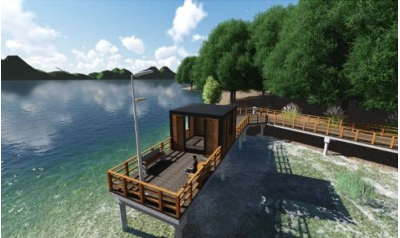
Imagen Objetivo Proyectos de Mejoramiento de Borde Lacustre de Lago Ranco.

El mejoramiento de la actual costanera de Valdivia, la conservación de la Costanera de Panguipulli, la implementación de una nueva costanera en Rio Bueno, Mantilhue y Coñaripe, son algunos de los ejemplos de proyectos.