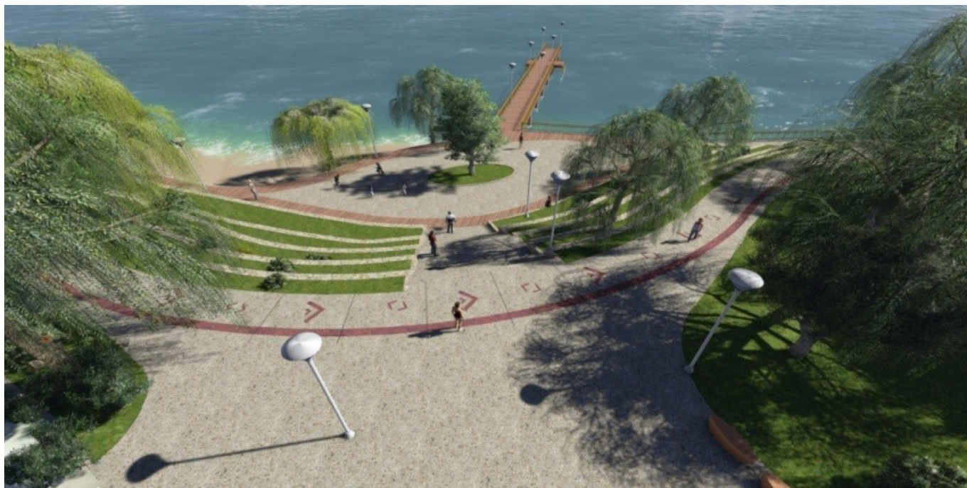
Imagen Objetivo Proyectos de Mejoramiento de Borde Lacustre de Lago Ranco.