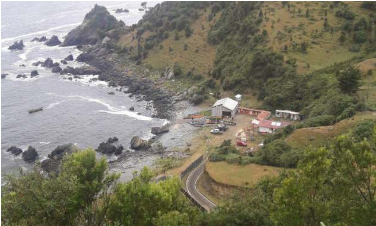
Caleta Bonifacio.

una de estas comunidades como así también al desarrollo regional.