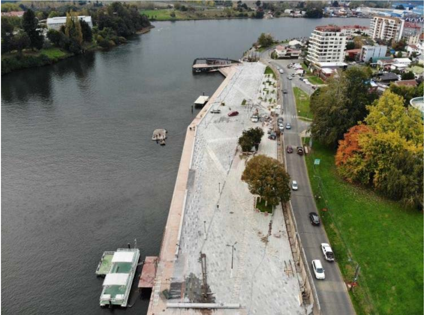
Imagen Mejoramiento Costanera Valdivia Tramo I.

El mejoramiento de la costanera en la ciudad de Valdivia, ha significado un cambio sustantivo respecto de la anterior configuración de costanera en el sector. Se logra ampliar la plataforma de paseo en aprox 14 metros líneas hacia río, generando con ello un sector de encuentro para la comunidad en cercanías del cauce fluvial, se incorporó un moderno sistema de iluminación inteligente, el cual es posible de monitorear y contralar de forma remota, se incorporó un área concecionable que permite ordenan las futuras actividades turísticas en el sector y se implementó un muelle mirador, el cual se ha convertido en la postal obligada de todo visitante.