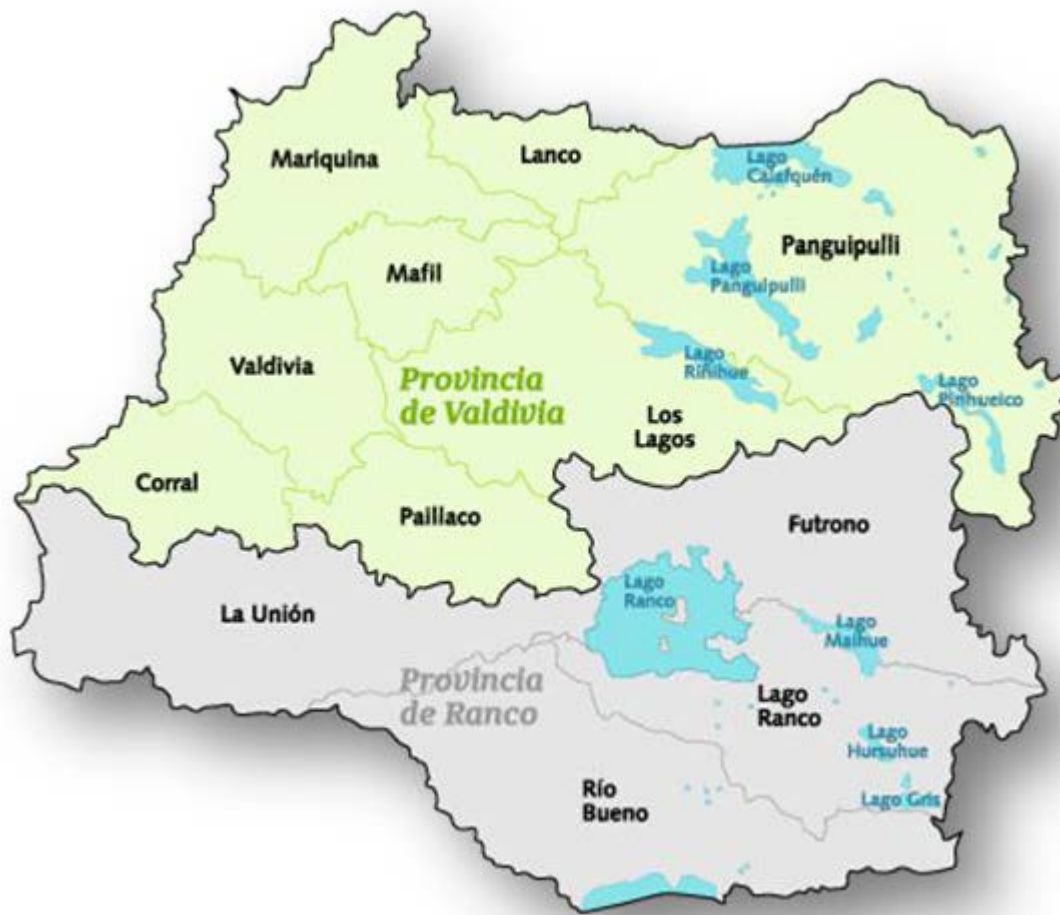
Mapa Región de Los Ríos.

Las iniciativas suman en su totalidad más de 24.000 ml de mejoramiento, recuperación y construcción de obras que permitirán el desarrollo de paseos peatonales, la incorporación de mobiliario urbano, iluminación, accesibilidad universal, muelles miradores, servicios higiénicos y áreas concecionables, lo cual en su conjunto permite potenciar y apalancar actividades ligadas al turismo y a la mejor calidad de vida de los habitantes de estos sectores.