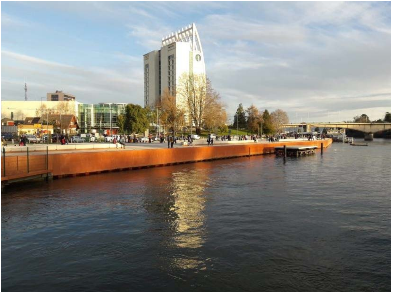
Imagen Mejoramiento Costanera Valdivia Tramo I.

Los 24 proyectos que conforman la cartera, pretenden aportar infraestructura que permitan generar la posibilidad de implementar actividades que vayan en pos de mejorar la calidad de vida de los habitantes y que sirvan para apalancar servicios que las comunidades puedan ofrecer a sus visitantes, dado que la experiencia en el país en la gestión de espacios de bordes costeros ha demostrado iniciativas que han sido exitosas respecto de renovaciones urbanas; destacan las playas artificiales de la región de Antofagasta, la primera playa artificial ejecutada en un lago, como lo fue la Playa Pucara en Villarrica y la recuperación de bordes costeros a lo largo del país, los que han incorporado innovaciones tecnológicas de ingeniería inéditas en el país. Estos proyectos han generado relevantes beneficios tanto