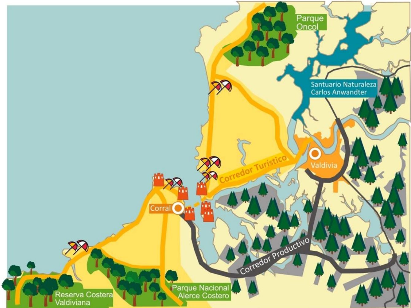
Esquema de definición de corredores territoriales.

El Plan Regional contiene 309 iniciativas a ejecutar en un plazo a diez años. De ellas, 93 se insertan en la UTH Sistema Corral - Valdivia, equivalente a 30,1% del total, ya que allí se localiza gran cantidad de población y actividad económica, incluyendo la actividad portuaria. A su vez, en esa UTH 38 iniciativas corresponden al ámbito portuario y de conectividad, lo que equivale al 41% de ella.