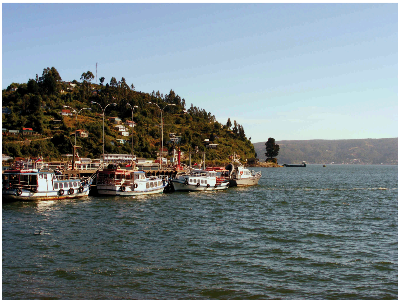
Foto de la zona portuaria de Corral (embarcaciones de conectividad local). (Fuente: MOP Los Ríos, fotografía: Jaime Silva C.).