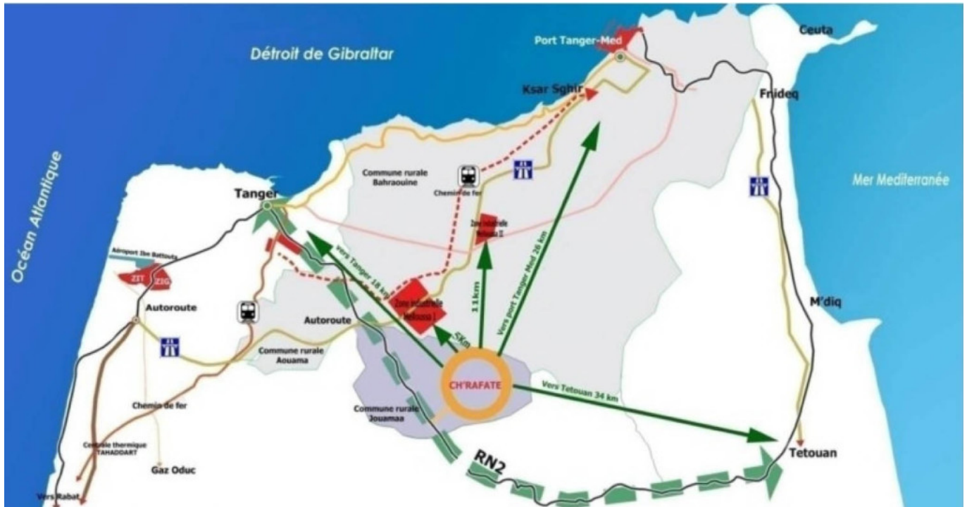
Le territoire urbanisé de la ville de Tanger.

La prise de conscience du danger qui menace autour de cet habitat phénoménal, où la population se sent rejetée et crée ses propres lois dans les cités, le programme national du développement humain, initié par le roi du Maroc a été lancé en 2005, et consiste à modifier la vision de l'autorité, pour être à l'écoute de la population démunie, de lutter contre la précarité et l'exclusion dans les milieux urbains, et réaliser une infrastructure de base et des équipements sociaux. Nous célébrons cette année le 10 ème anniversaire de l'INDH.