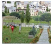
LIENS SOCIAUX ET SPATIAUX