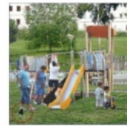
AVEC LE QUARTIER ET LA VILLE