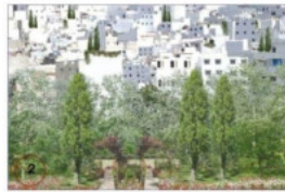
PLANTATIONS ET DIMENSION PAYSAGERE