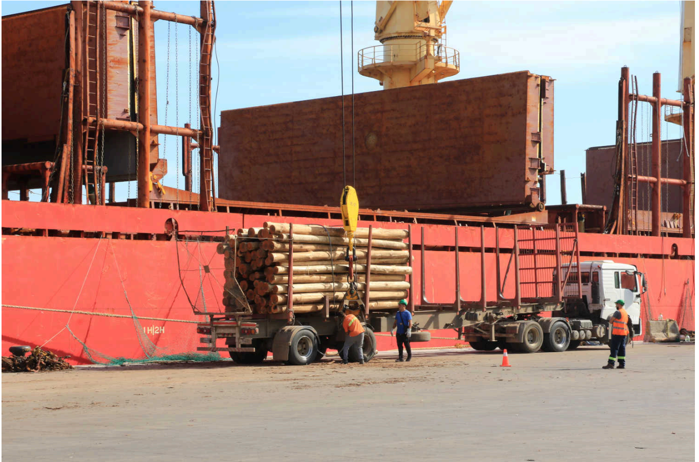
Vehículos y operadores en actividades en el Puerto de Montevideo.

RETE ha desarrollado un concepto que se llama nodo avanzado. Es una forma de articulación entre ciudad y puerto, donde también interviene la academia y las partes interesadas. Ese concepto ya existía en Montevideo y tenía una historia importante y rica de articulación. Se le llamaba “la comunidad portuaria”. Era una gran reunión que se hace mensualmente y además dispone de subcomisiones que trabajan y buscan articular. El sindicato portuario participa de esas reuniones del nodo avanzado. ¿En qué forma participa?