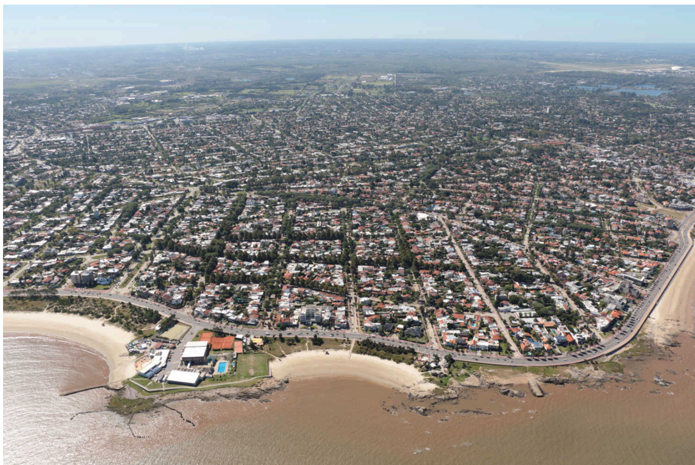
Vista aérea de la rambla O'Higgins de Montevideo en Punta Gorda. Playas La Mulata y Verde. (© Foto: Luis Camacho, 2021).

Head Image: El Puerto del Buceo, que se ubica en una pequeña bahía en la costa de Montevideo cerca de Pocitos. Un lugar de significado social, deportivo y turístico, caracterizado por la presencia de algunas edificaciones destacadas como el Edificio Panamericano, el Montevideo Shopping y el World Trade Center Montevideo. (© Foto: Luis Camacho, 2021).