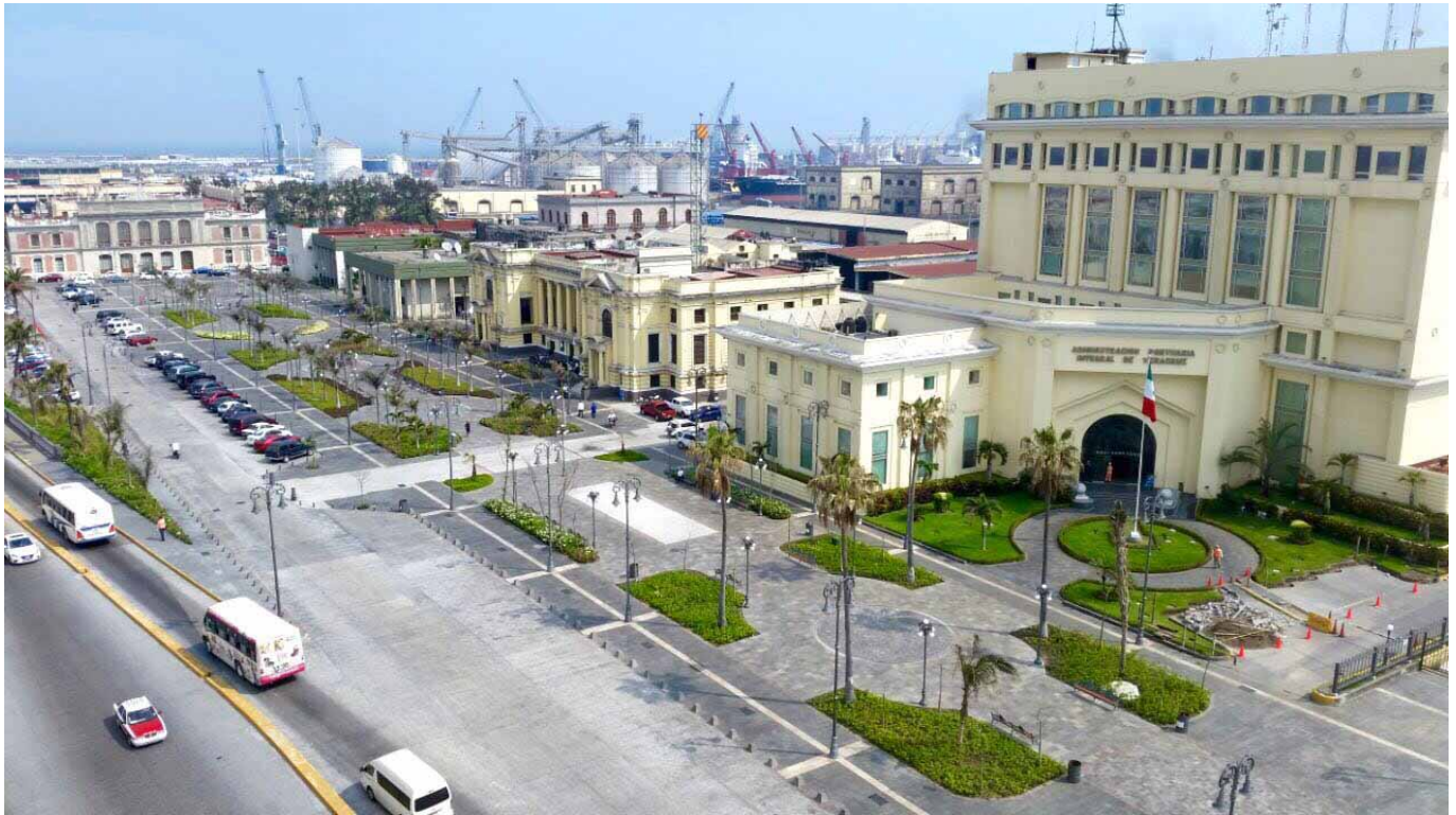
Plaza de la República. Vista.

En conjunto, ambos espacios que otrora fuesen parte del puerto, hoy en día interactúan como espacios públicos que contribuyen al buen desarrollo de las actividades de ciudadanos y visitantes. Con el Proyecto de Rescate del Centro Histórico de Veracruz, no sólo se rehabilitaron estos espacios, también se reactivó en la sociedad el interés por mejorar las condiciones urbanas del área que representa los orígenes de la ciudad recuperando el sentido de pertenencia e identidad del veracruzano con su patrimonio, su historia y su cultura.