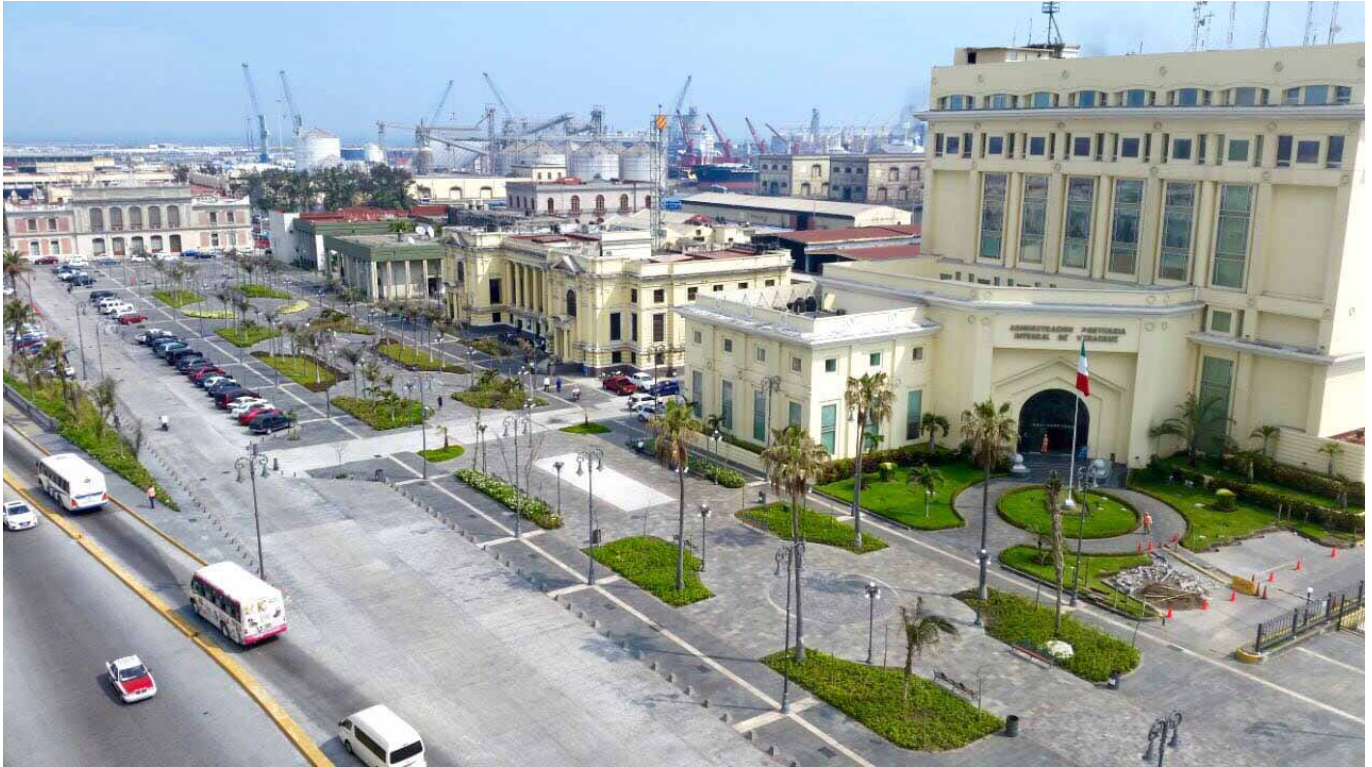
Plaza de la República. Vista.

En conjunto, ambos espacios que otrora fuesen parte del puerto, hoy en día interactúan como espacios públicos que contribuyen al buen desarrollo de las actividades de ciudadanos y visitantes. Con el Proyecto de Rescate del Centro Histórico de Veracruz, no sólo se rehabilitaron estos espacios, también se reactivó en la sociedad el interés por mejorar las condiciones urbanas del área que representa los orígenes de la ciudad recuperando el sentido de pertenencia e identidad del veracruzano con su patrimonio, su historia y su cultura.