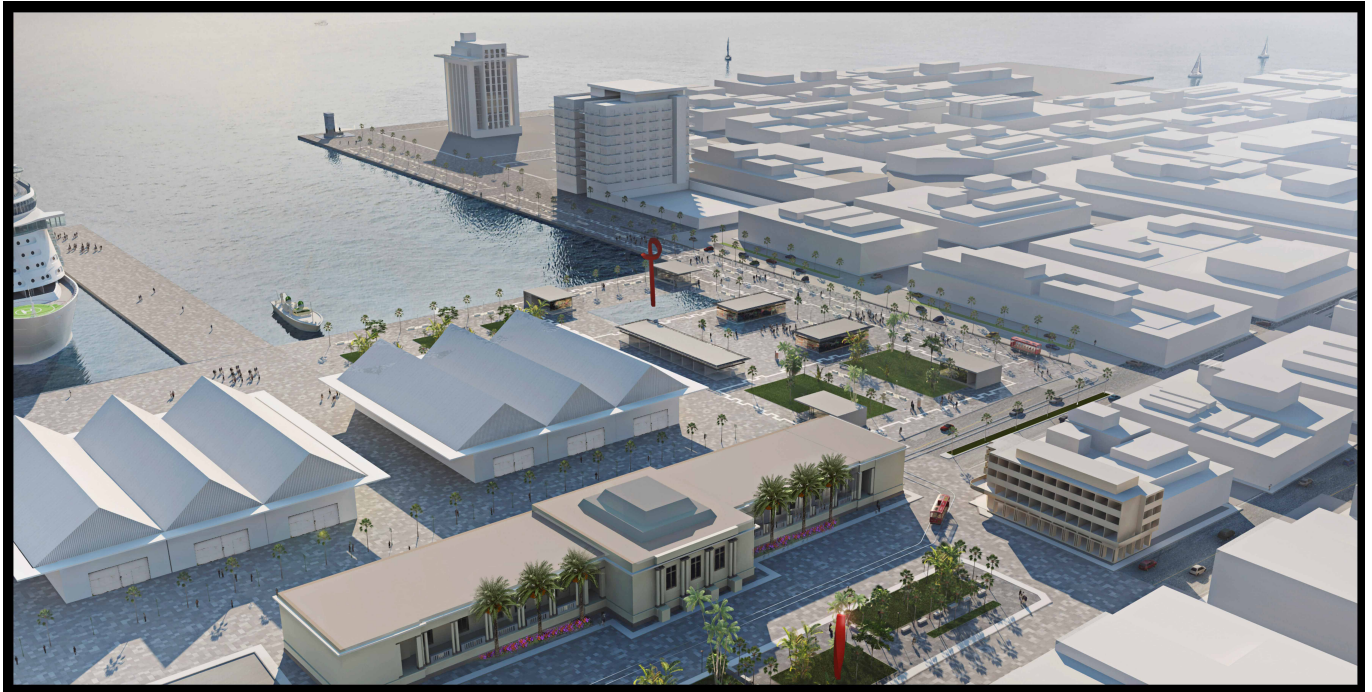
Imagen virtual de propuesta Plaza 500 Años. (© Arq. José Manuel Ruiz Falcón, 2016).

Cabe mencionar que la construcción y puesta en valor de estos proyectos valieron para que en octubre 2016 se otorgase la Medalla de Plata y Mención Honorífica en la categoría de Espacios Públicos al PRCHV en el marco de la XIV Bial Nacional e Internacional de Arquitectura Mexicana.