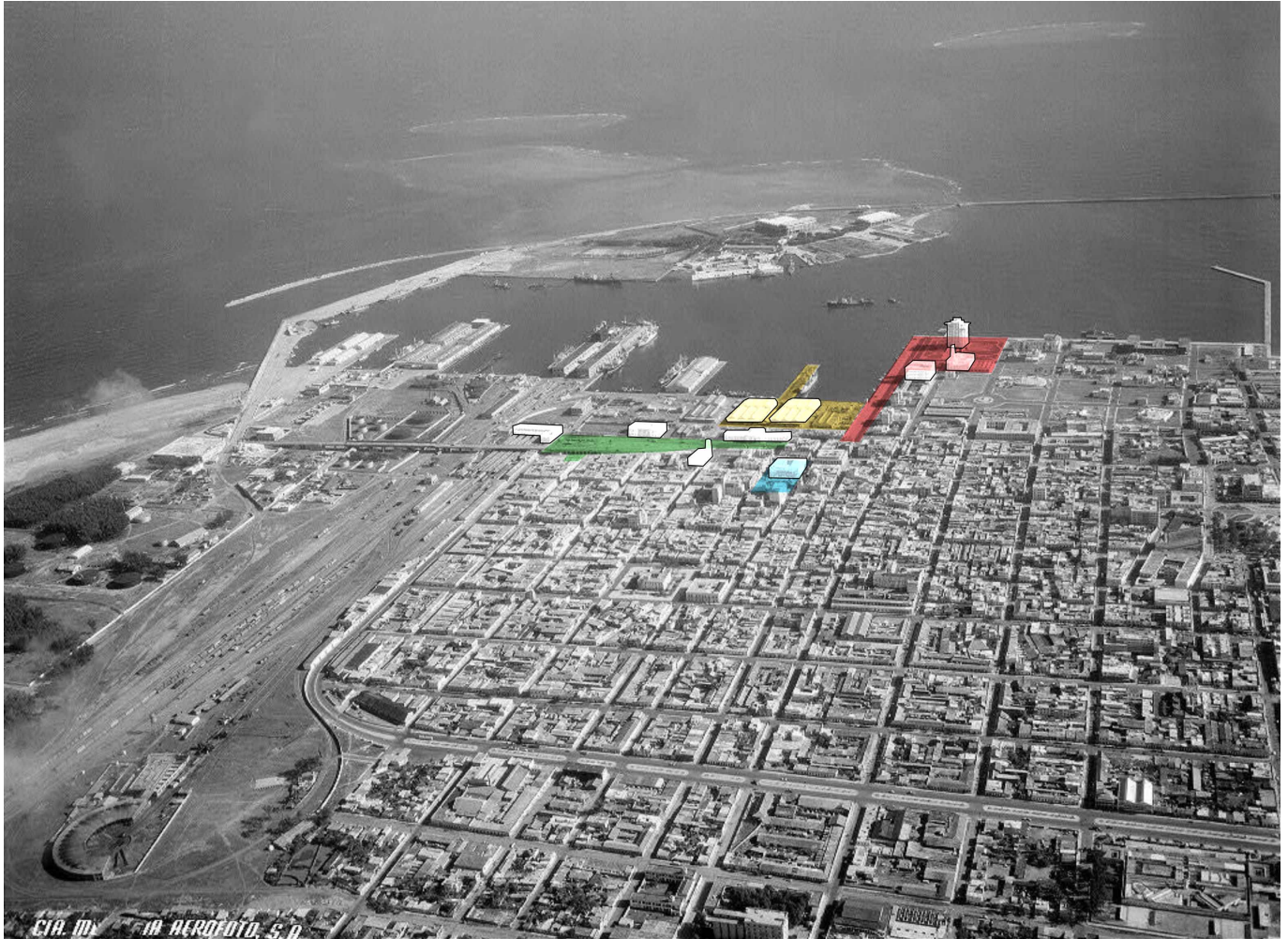
Vista aérea de la ciudad de Veracruz.