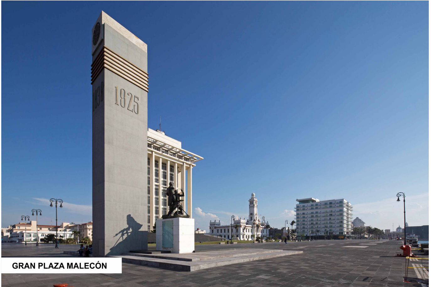
GRAN PLAZA MALECÓN

Gran Plaza Malecón. Vista.