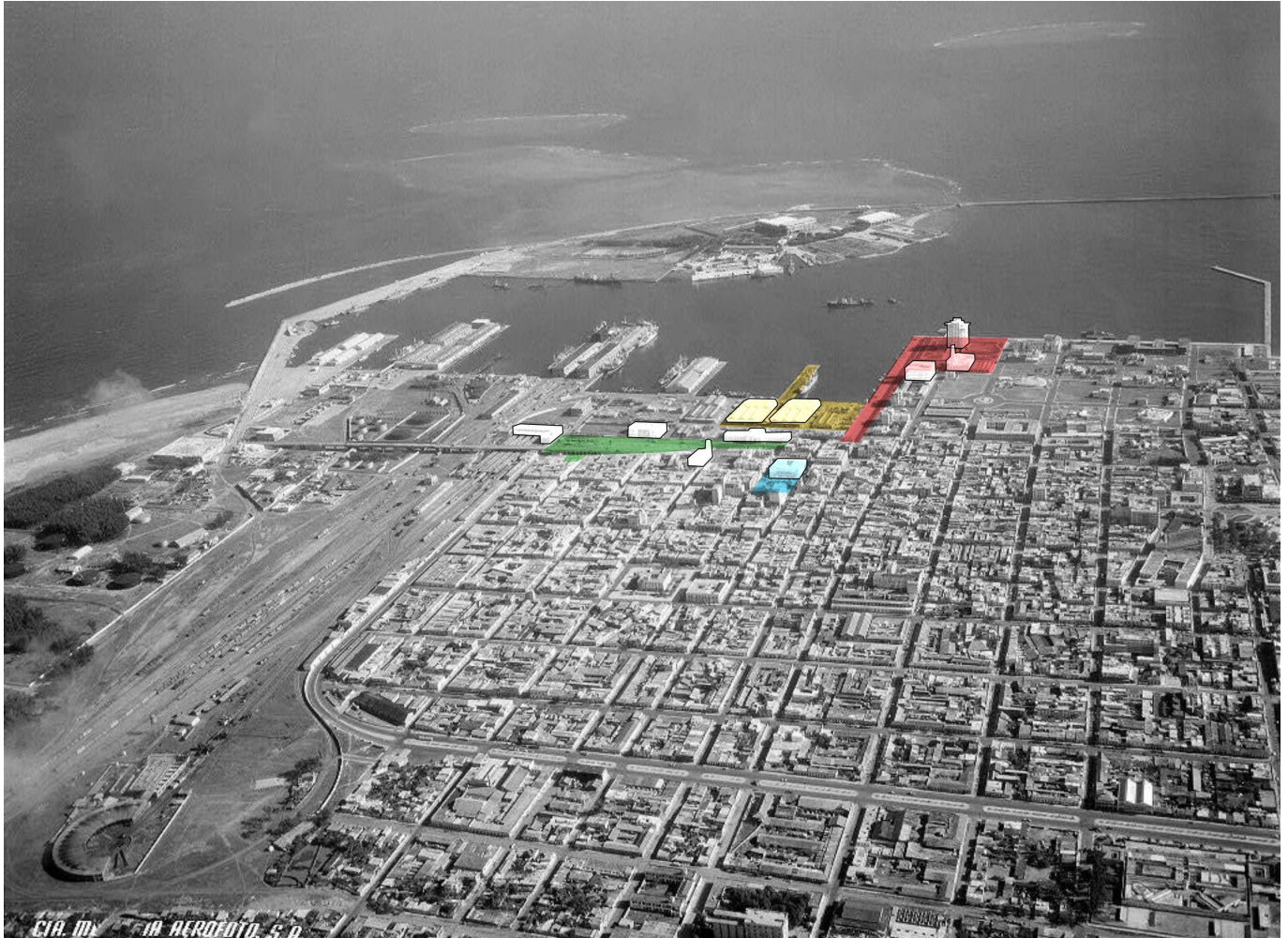
Vista aérea de la ciudad de Veracruz.