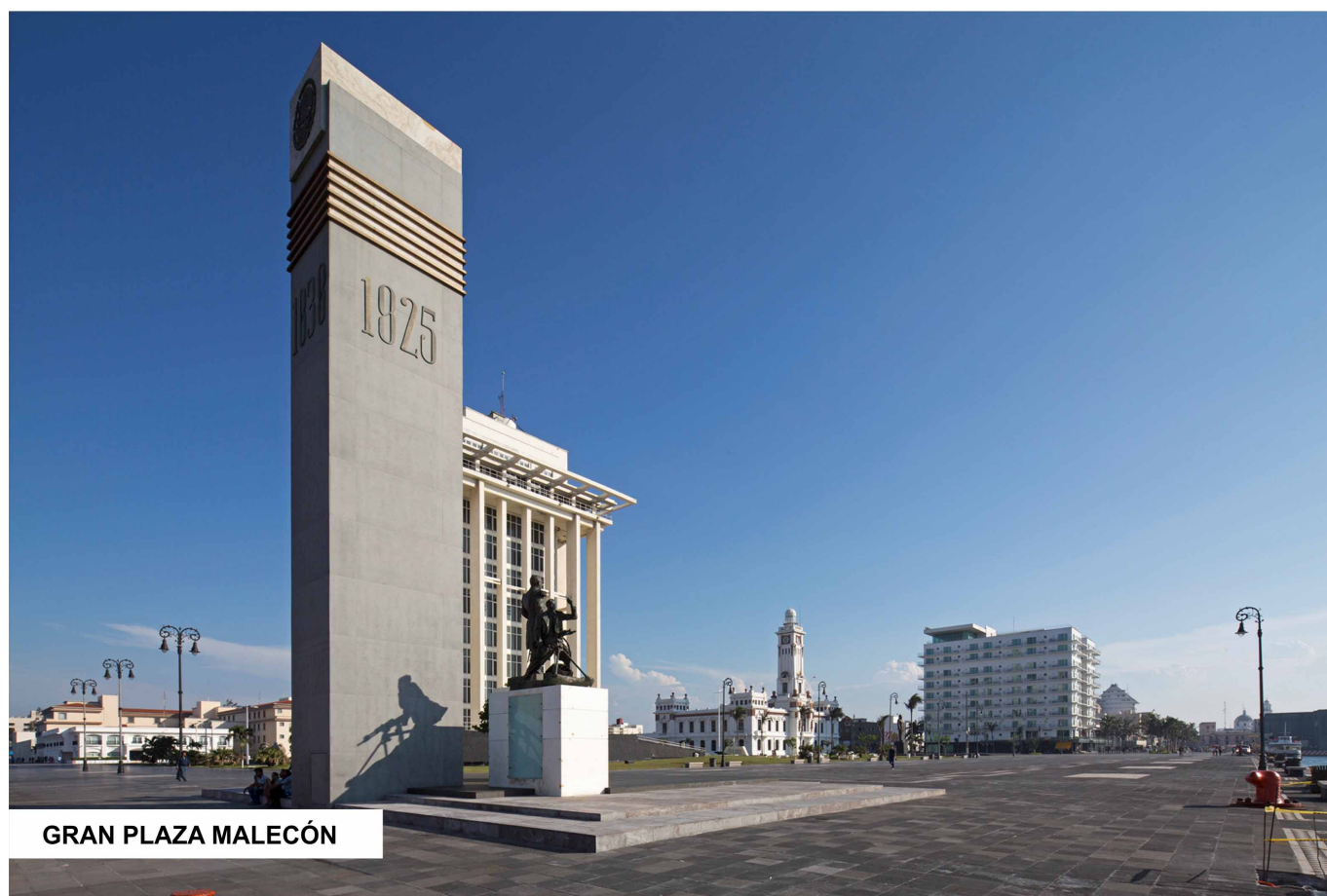
GRAN PLAZA MALECÓN

Gran Plaza Malecón. Vista.