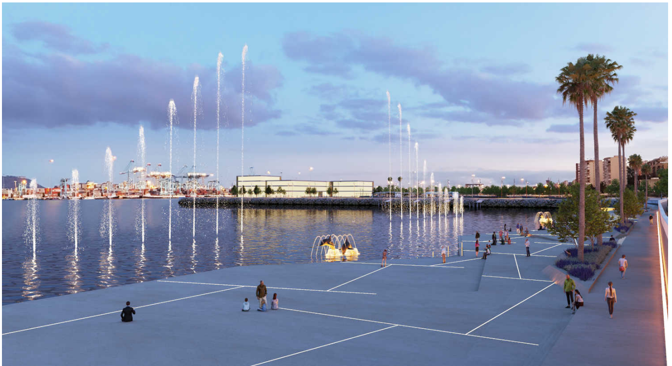
Actuaciones ambientales y paisajísticas junto a la lámina de agua. Creación de plataformas.

Para poder llevar a cabo esta actuación es imprescindible resolver los problemas endémicos de vertidos que afectan a la lámina de agua mediante un acondicionamiento medioambiental, para lo que es fundamental el concurso de la administración autonómica y del Ayuntamiento de la ciudad.