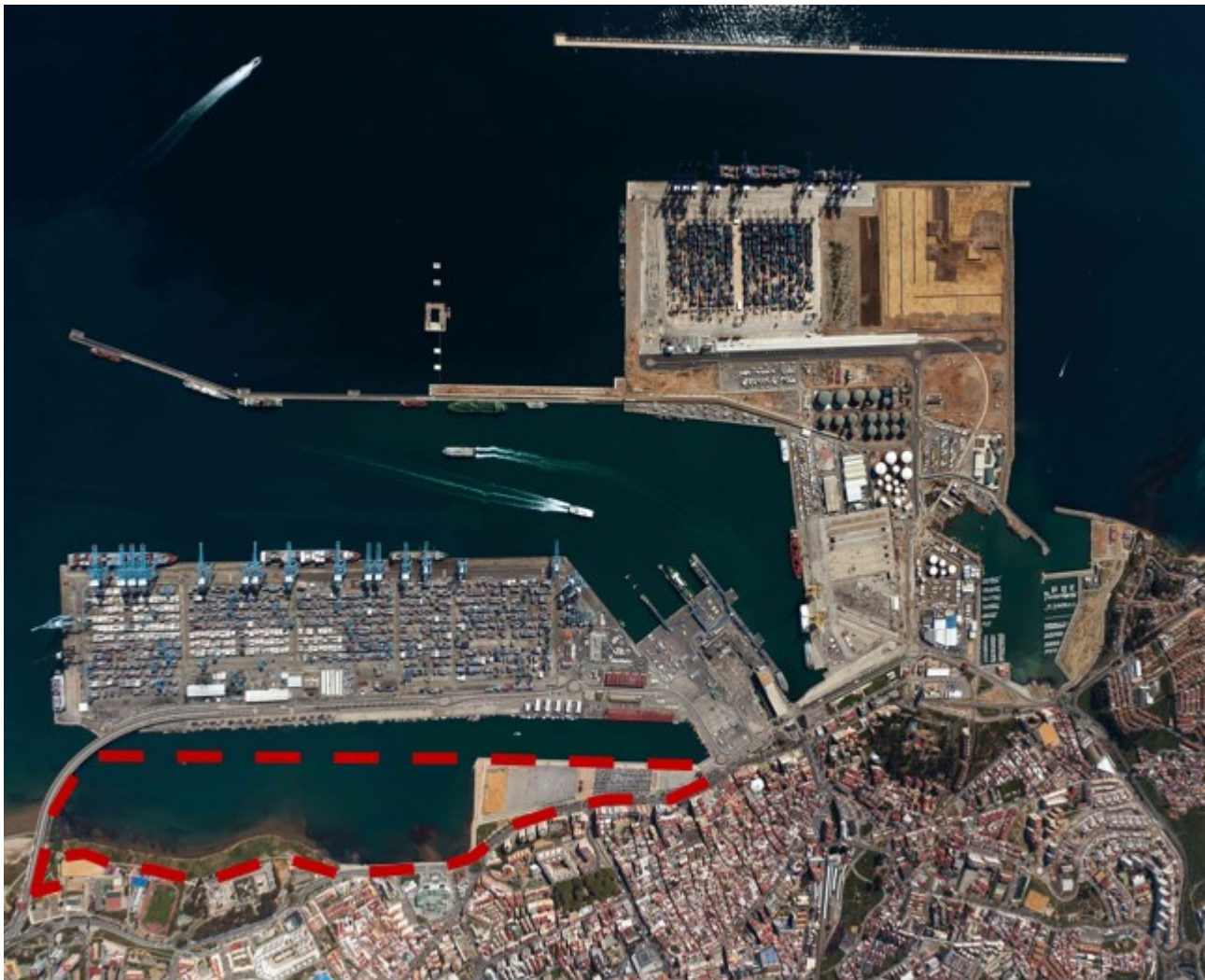
Imagen aérea del ámbito de actuación del proyecto.

protocolo establece que el desarrollo de sus actuaciones se lleve a cabo a través de los convenios específicos o los instrumentos administrativos que sean necesarios, en los que se determinará el grado de participación de las administraciones firmantes. Asimismo en el proyecto también participa la Universidad de Cádiz, aportando valor añadido al asegurar su presencia en el Llano Amarillo con la edificación de su Centro de Innovación, o Innovation Center, UCA-SEA, cuya ejecución será por concesión administrativa por parte de la APBA, que será un referente en transferencia del conocimiento en aspectos relacionados con el transporte marítimo.