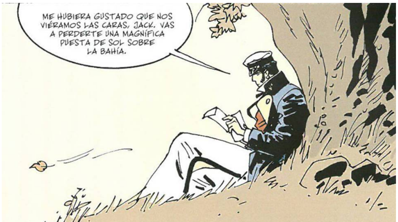
Bajo el sol de medianoche.

finalización de “La Balada del mar salado”, enlazando con el final donde los dos protagonistas, Corto Maltés y Rasputín, se dirigen a Panamá. El relato de la nueva obra llevará a Corto a lo largo de todo el año a realizar un largo viaje a través de las vastas extensiones heladas entre Estados Unidos y Canadá para cumplir con el deseo de llevar un mensaje de su amigo, el célebre escritor Jack London, a un amor de juventud, con la promesa de conseguir al final de la aventura un preciado tesoro.