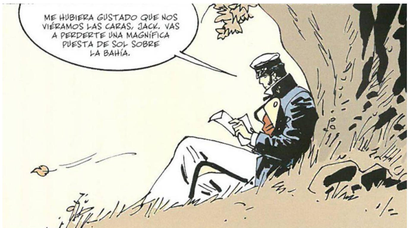
Bajo el sol de medianoche.

finalización de “La Balada del mar salado”, enlazando con el final donde los dos protagonistas, Corto Maltés y Rasputín, se dirigen a Panamá. El relato de la nueva obra llevará a Corto a lo largo de todo el año a realizar un largo viaje a través de las vastas extensiones heladas entre Estados Unidos y Canadá para cumplir con el deseo de llevar un mensaje de su amigo, el célebre escritor Jack London, a un amor de juventud, con la promesa de conseguir al final de la aventura un preciado tesoro.