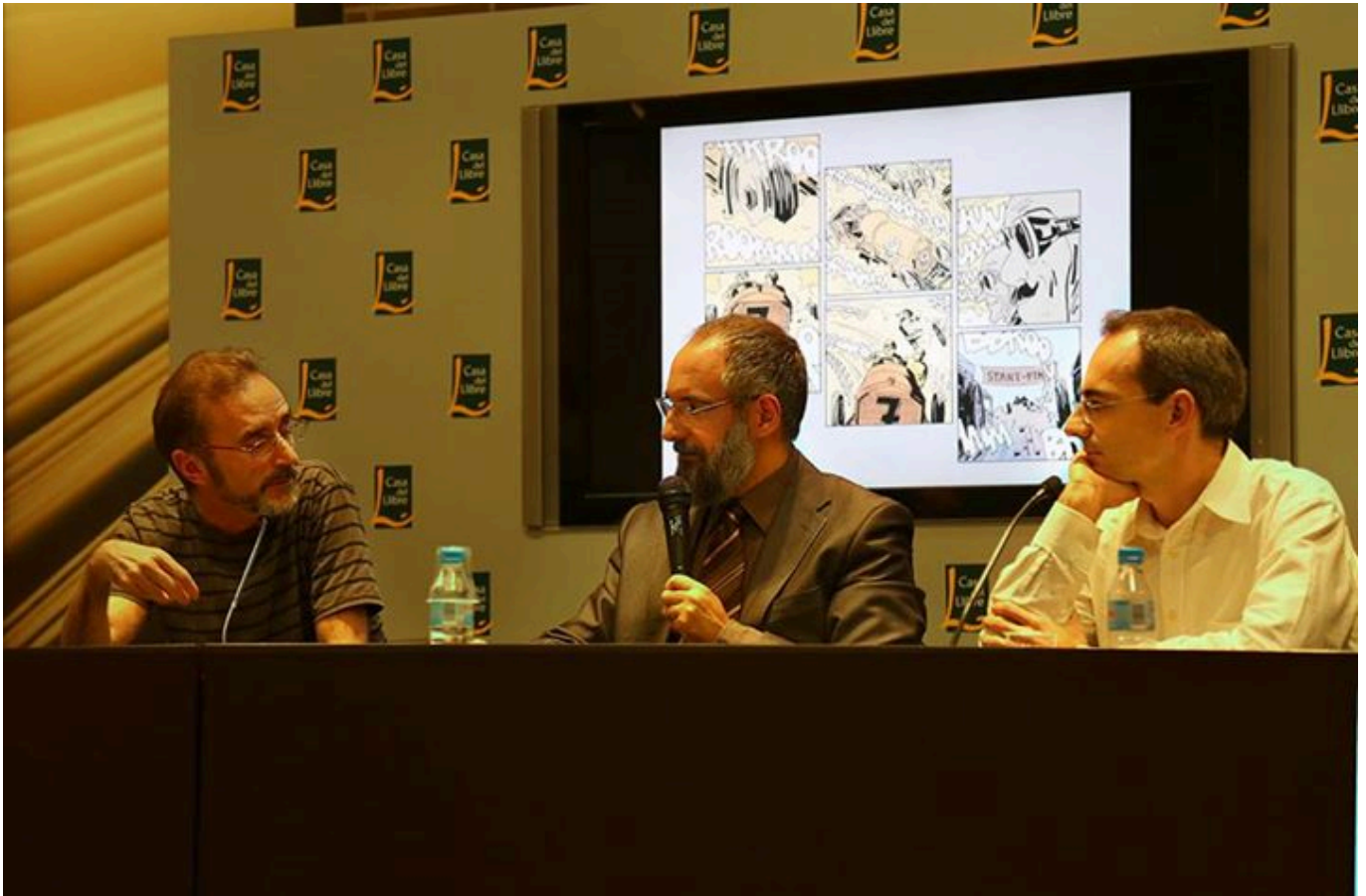
Rubén Pellejero, Jordi Ojeda, Juan Díaz Canales.

Juan Díaz Canales (Madrid, España, 1972). Profesional del sector de la animación, se consagra como guionista de la serie “Blacksad” con dibujos de Juanjo Guarnido, de la que se han publicado cinco tomos con los que han ganado numerosos premios, de los que se puede destacar los conseguidos en los años 2013 y 2015 cuando ganan el importante Premio Eisner en Estados Unidos, en la categoría de Mejor Edición Norteamericana de Material Internacional. El colofón llega con la concesión del Premio Nacional del Cómic en España en 2014. En 2016 publica su primera novela gráfica como dibujante con el título “Como viaja el agua”, una reflexión sobre la vida y la muerte con el marco de la tercera edad como trasfondo.