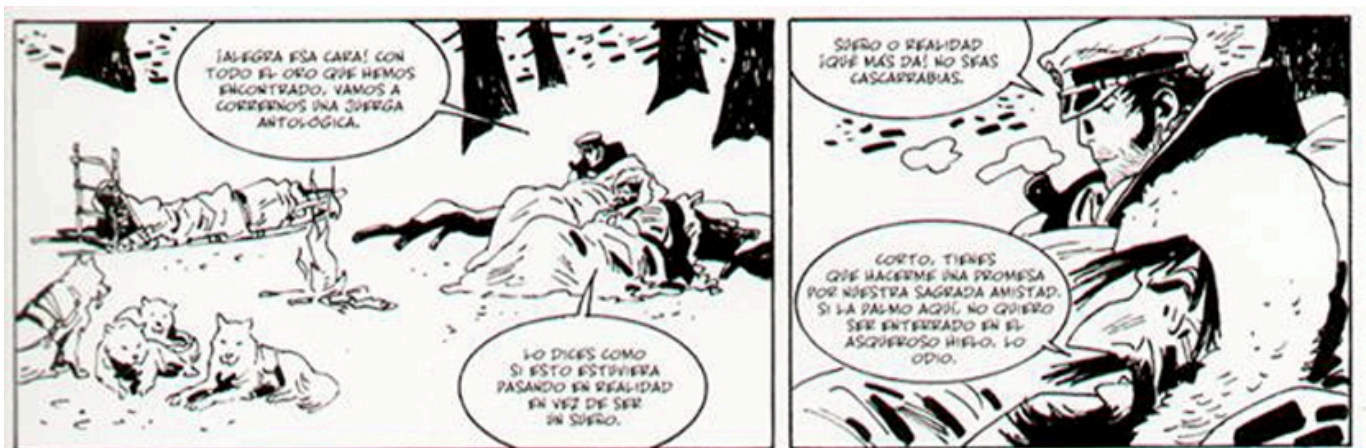
Bajo el sol de medianoche.

Corto Maltés es un personaje de ficción del que conocemos una gran parte de su biografía a través de la obra de Pratt. Díaz-Canales y Pellejero han optado por dar continuidad a la colección escogiendo el estilo de las primera historias largas publicadas (cuatro tiras por página, sin anotaciones a pie de página y pensando especialmente en la versión en blanco y negro), y completando huecos temporales respecto de las historias publicadas originalmente, que transcurrían en momentos históricos y lugares concretos, y mezclando personajes reales con ficticios en situaciones verosímiles.