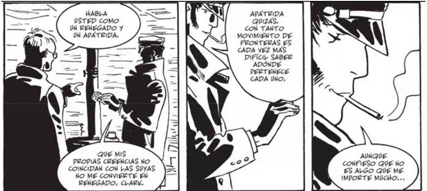
Bajo el sol de medianoche.

En ese sentido podemos ver al protagonista del relato paseando por la Exposición Universal Panamá Pacífico realizada en San Francisco en 1915, celebrando a la vez la inauguración del Canal de Panamá y la reconstrucción de la ciudad después del devastador terremoto de 1906. Podemos contrastar los edificios monumentales de la exposición con la efervescente ciudad portuaria de Nome en Alaska, embarrada y en construcción continua. Y podemos sorprendernos con el impacto que supusieron los barcos de drenaje comparado con el trabajo de los buscadores de oro, todo un símbolo de fin de época.