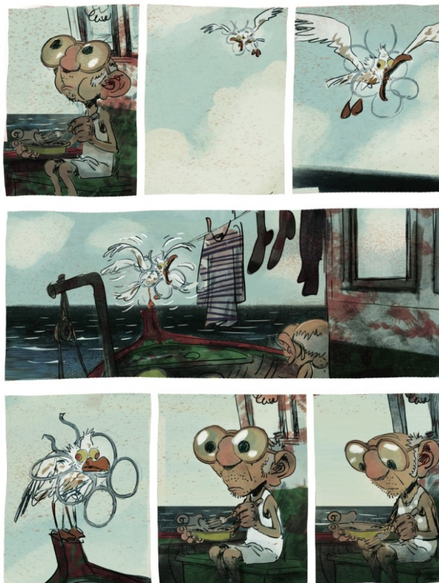
Grégory Panaccione & Wilfried Lupano (2015), "Un océano de amor", Sello Reservoir Books, Penguin Random House Grupo Editorial. Página 46 y 77.