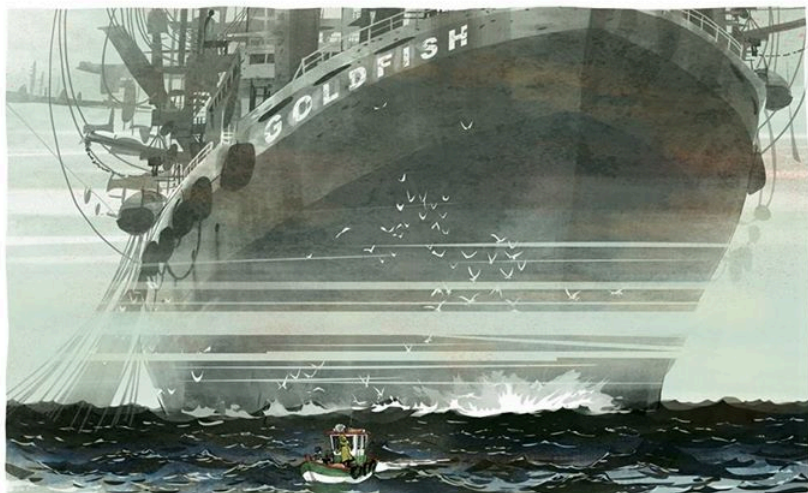
Grégory Panaccione & Wilfried Lupano (2015), "Un océano de amor", Sello Reservoir Books, Penguin Random House Grupo Editorial. Página 30-31.