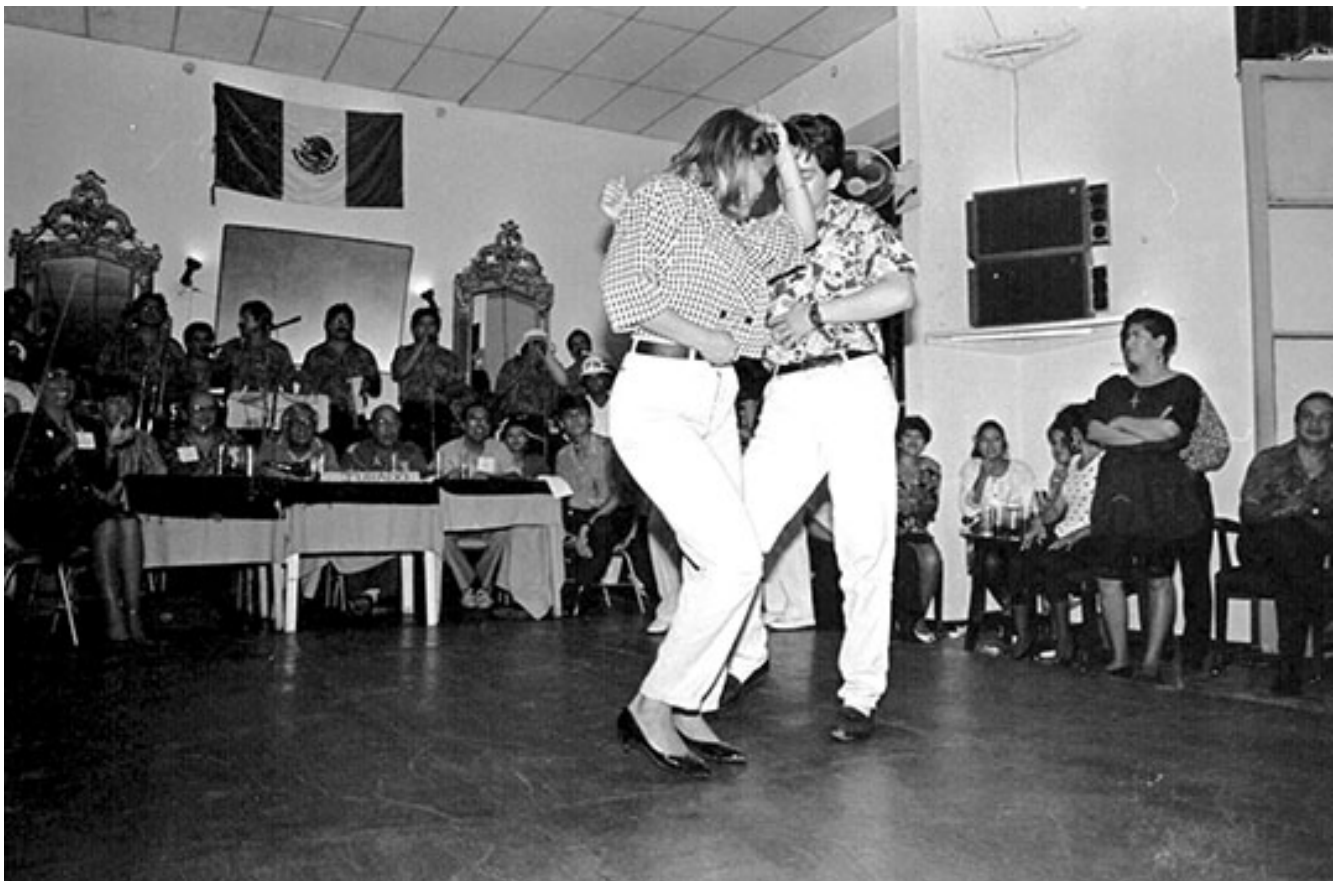
Concurso de baile de son y salsa “Baile mi rey”, Veracruz, Ver, hacía principios de la década de los noventa.