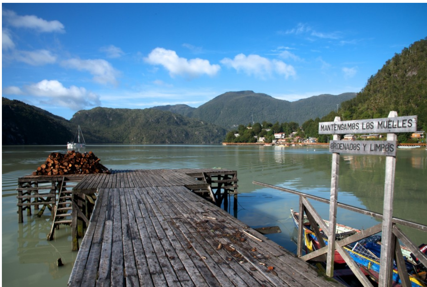
Uno de los múltiples muelles de la población.