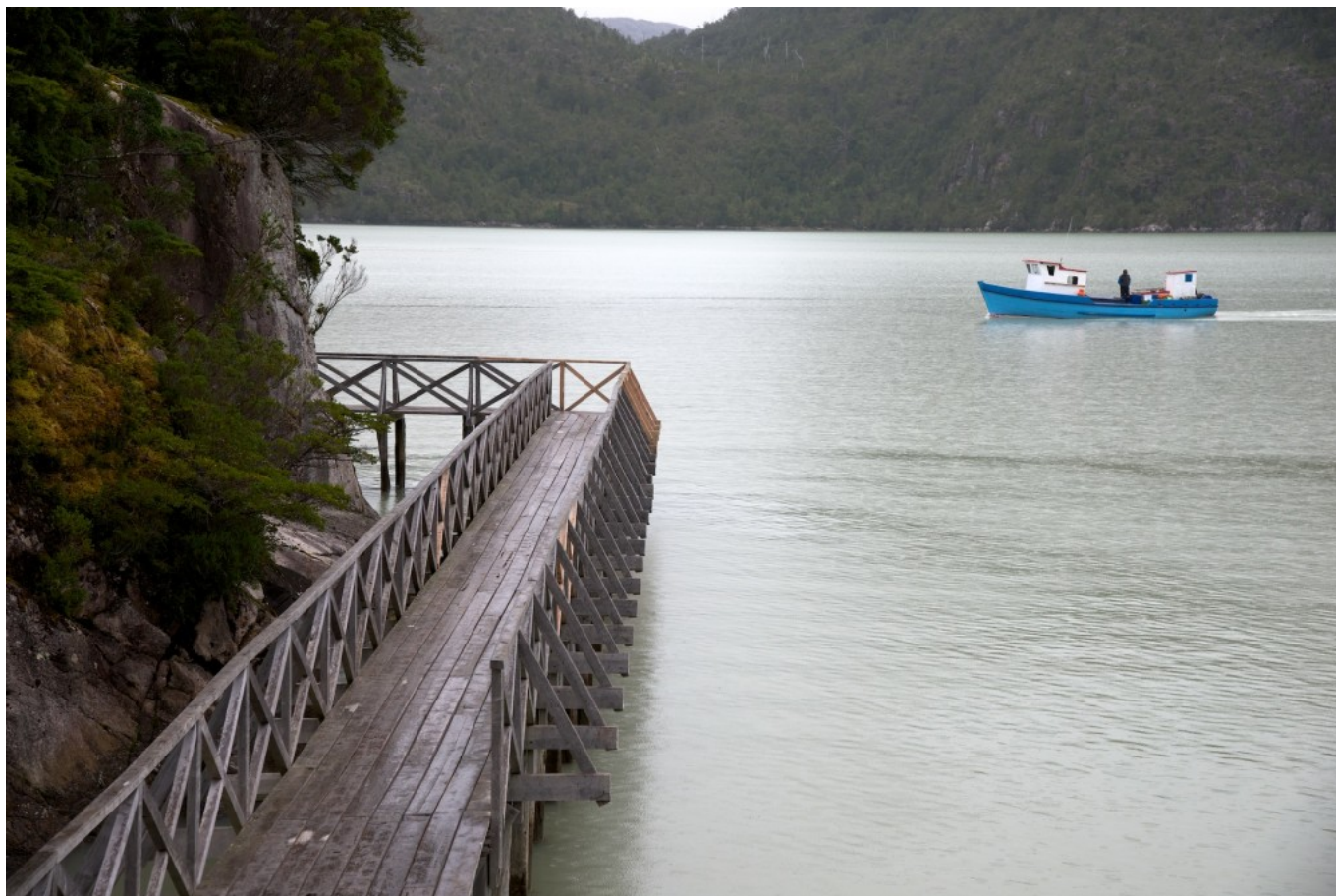
Costanera y barca.