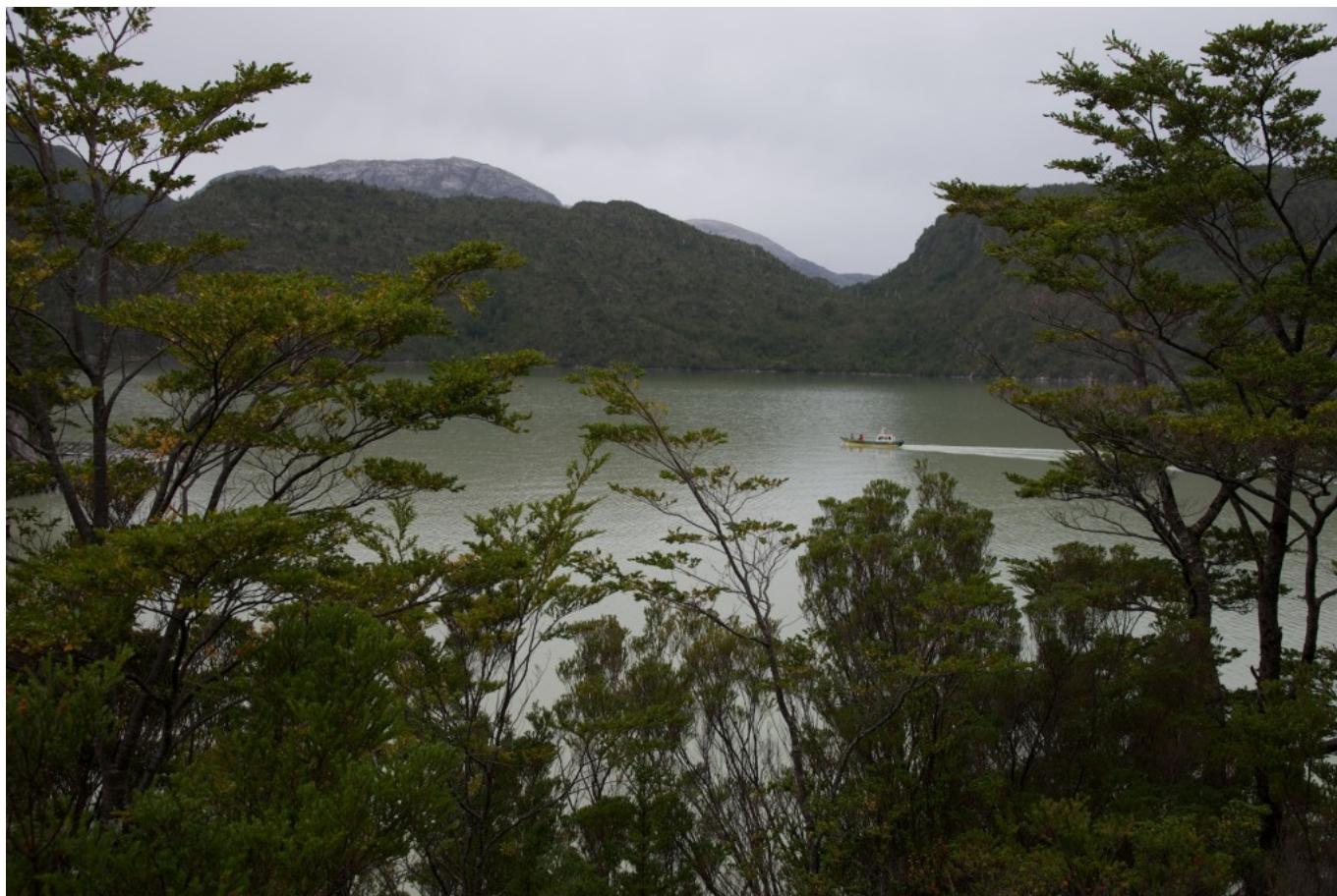
Amplia bahía que constituye el gran puerto natural de Caleta Tortel.