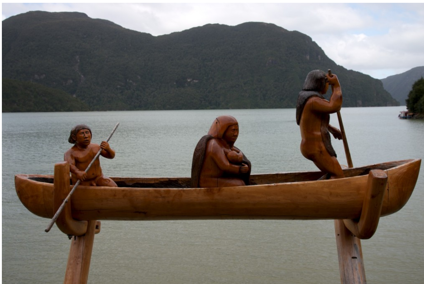
Monumento a los kawesqar, pobladores y grandes navegantes de estos canales australes durante muchos siglos.