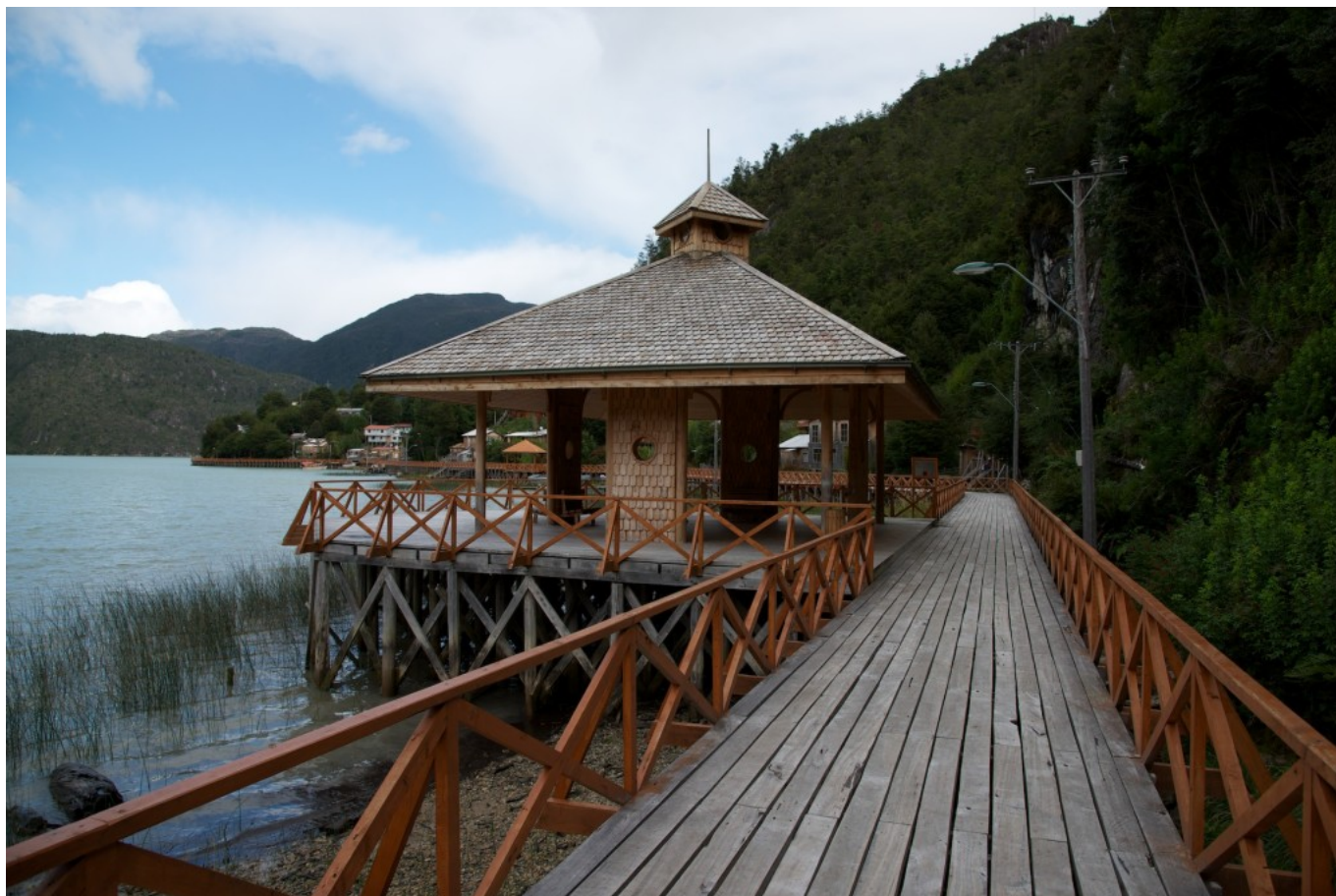
Pasarela costanera y plaza pública cubierta.