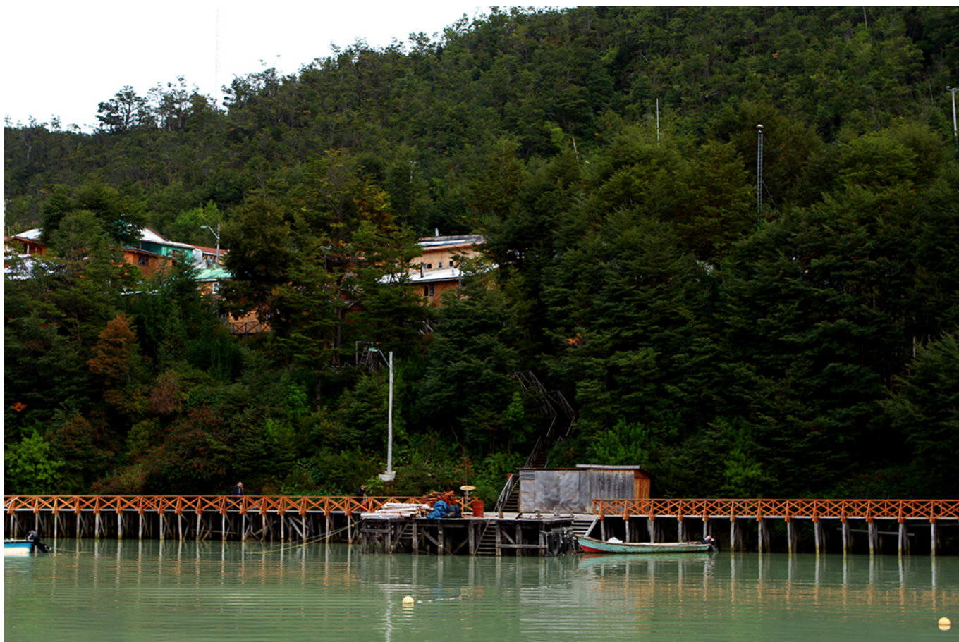
Costanera y casas integradas en la naturaleza.