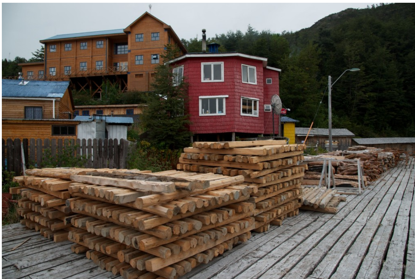
Puerto con estibas de madera para cargar, Biblioteca publica (edificio de la derecha) y Municipalidad (edificio más alto).