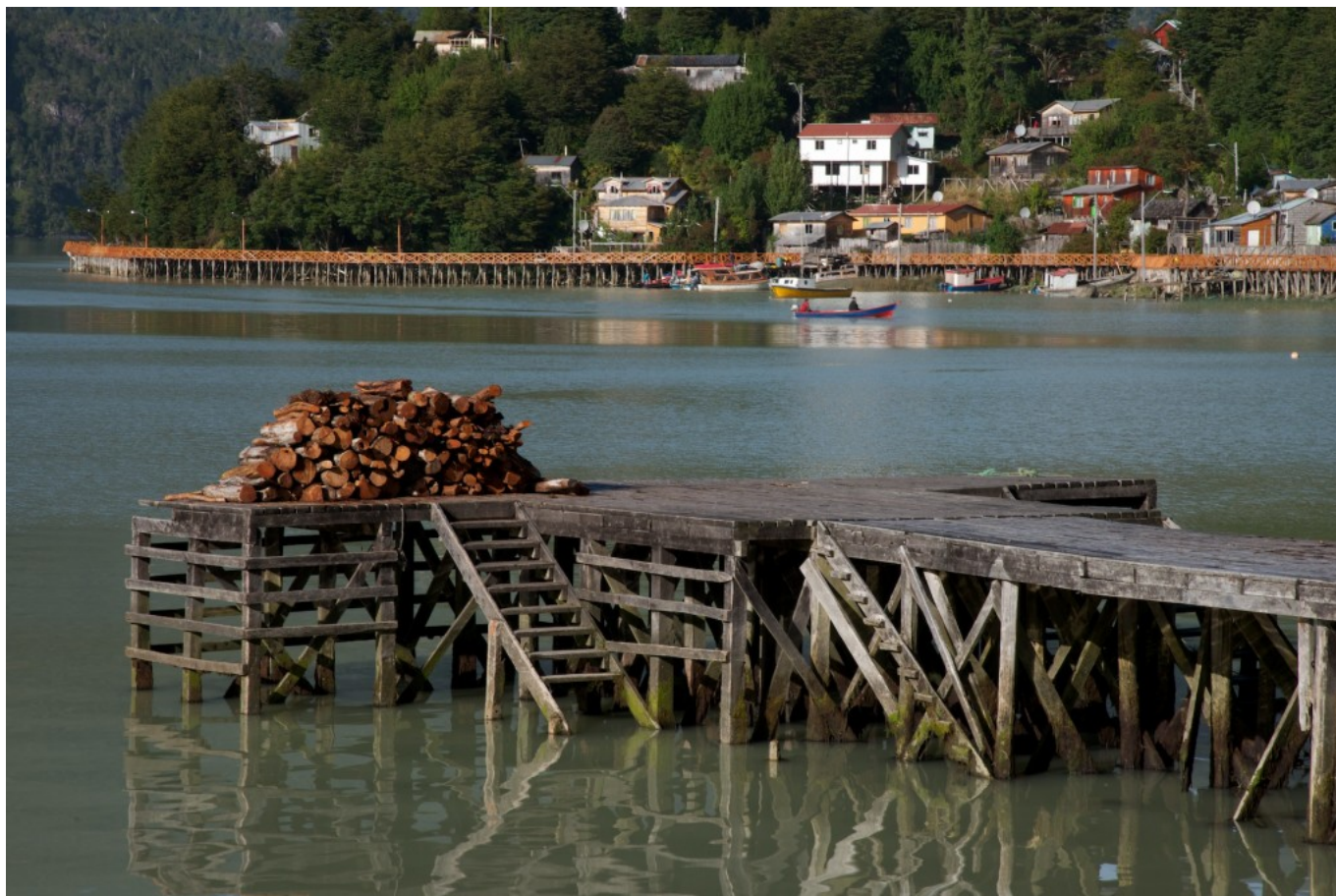
Muelle, costanera y barrio.