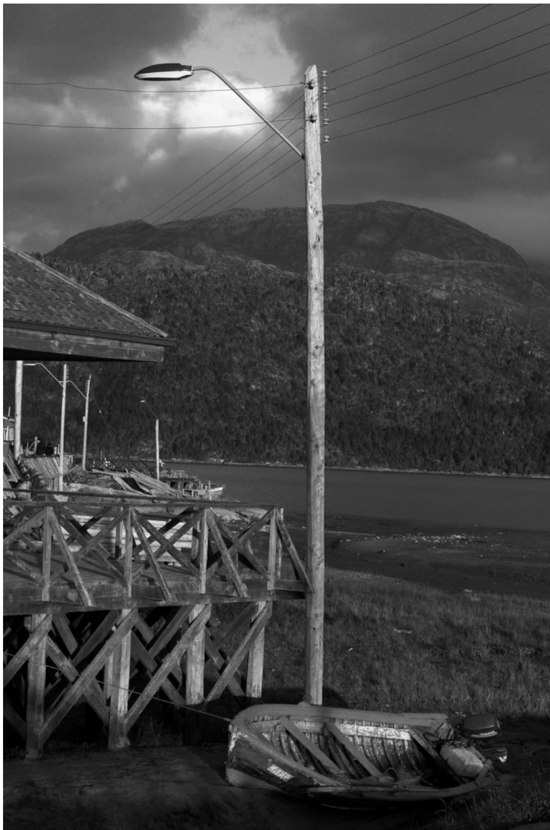
Casa, pasarela y