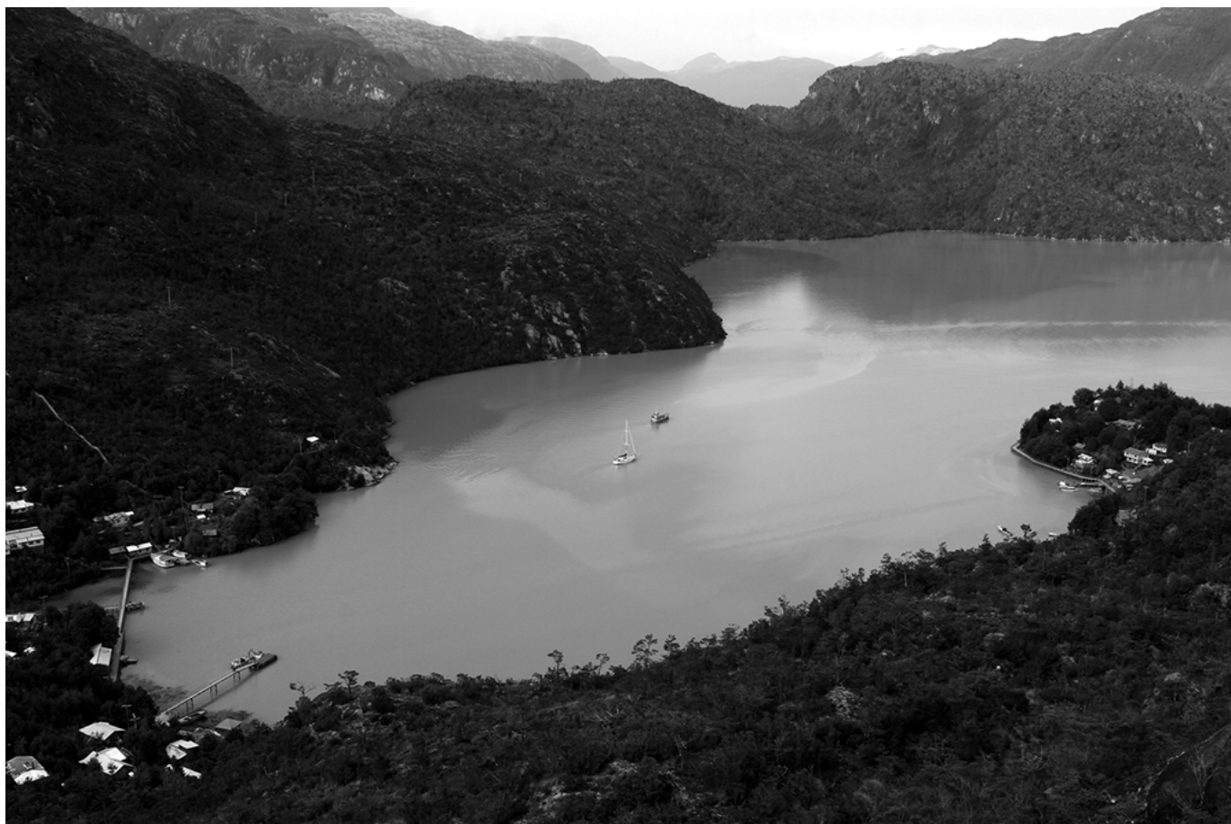
Área interior (derecha) y central (izquierda) de Caleta Tortel.