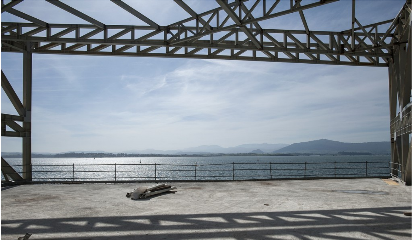
Recuadro vista Bahía desde Centro Botín Santander.

Las obras se iniciaron en junio de 2012 en un terreno propiedad de la Autoridad Portuaria y que la Fundación Botín ocupa en concesión. El presupuesto para el edificio, el paso subterráneo y la ampliación y remodelación de los Jardines, así como de las calles adyacentes, rondará los 80 millones de euros, aportados íntegramente por la Fundación Botín, la mayor inversión privada en una infraestructura cultural en España. La construcción está a cargo de OHL-Ascan y la gerencia y dirección de ejecución de obra a Bovis.