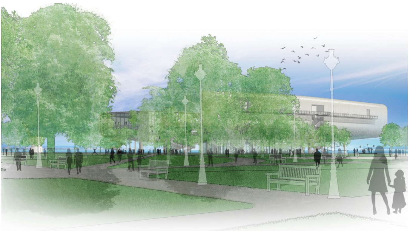
Infografía Centro Botín desde los Jardines de Pereda.