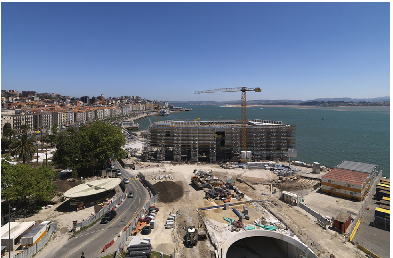
Vista aérea del Centro Botín en construcción, mayo 2014.

Por último, el Centro Botín será el proyecto más social de la Fundación, porque se convertirá en un lugar de referencia en el mundo para el desarrollo de la creatividad a través de las artes. El Centro usará las artes para generar actitudes que potencien la creatividad. Lo hará con talleres, cursos y actividades formativas para niños, jóvenes y adultos. El Centro también investigará la relación entre las artes, las emociones y la creatividad, y se convertirá en un punto de encuentro internacional para los expertos en estos ámbitos. Todo ello será posible gracias a la larga experiencia de la Fundación en el desarrollo de la inteligencia emocional y social y al proyecto de investigación desarrollado con la Universidad de Yale para definir cómo se puede potenciar la creatividad con las artes a través de las emociones.