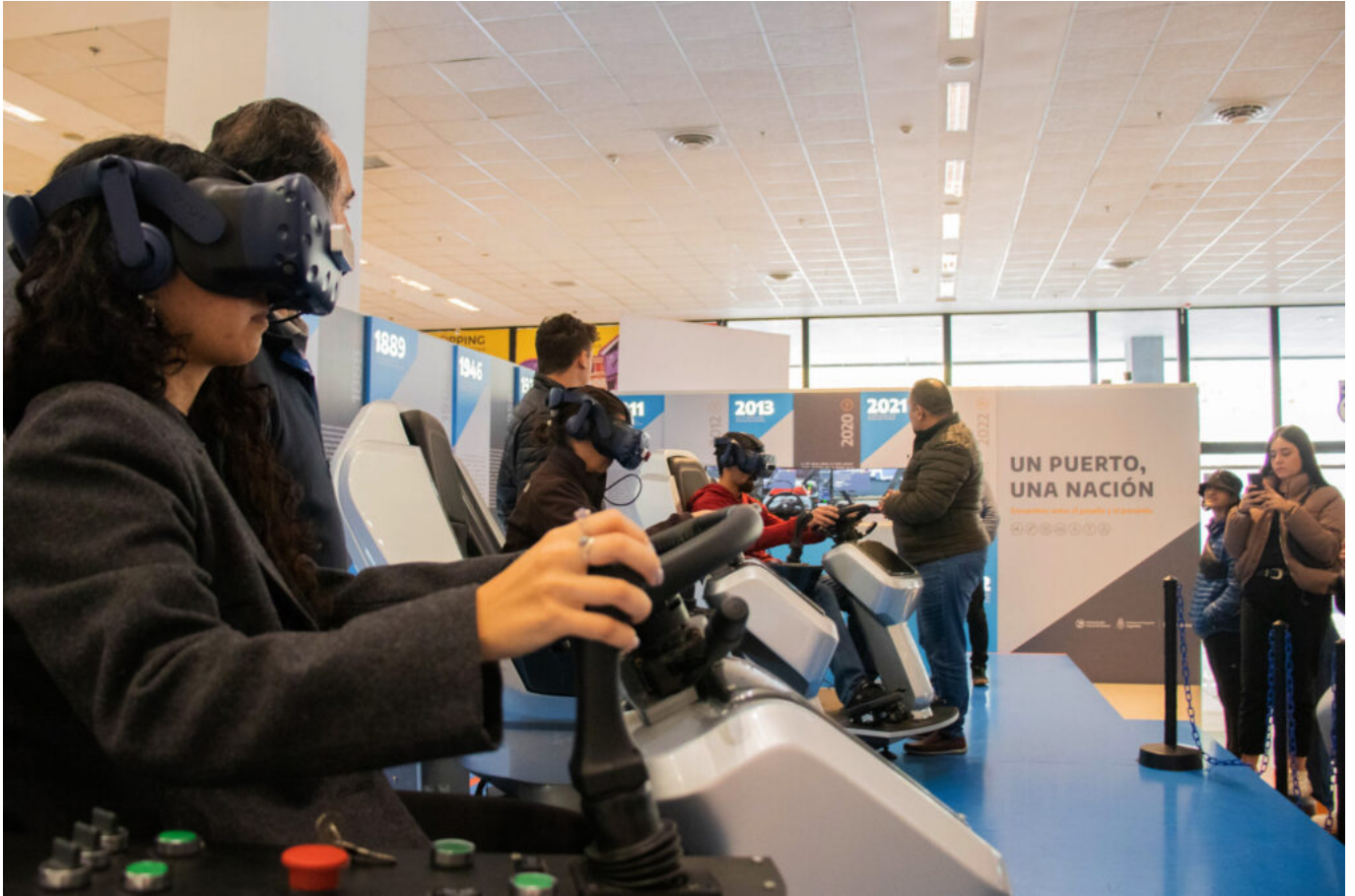
Vagón restaurado con instalación de flora autóctona en espacio de la muestra Identidad Portuaria Argentina. (Fuente: Administración General de Puertos, 2023).