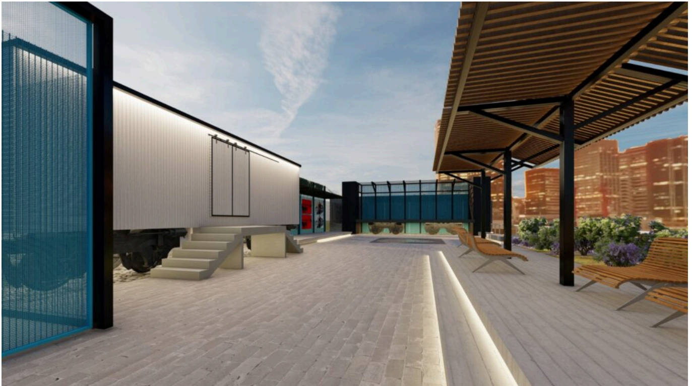
Boceto en croquis 3D del Centro de Exposiciones a Cielo Abierto, en desarrollo.

La articulación de estos cuatro espacios ubicados estratégicamente define un circuito turístico - cultural que acrecienta el conocimiento y la visibilización de las acciones de la AGP en contacto con la comunidad.