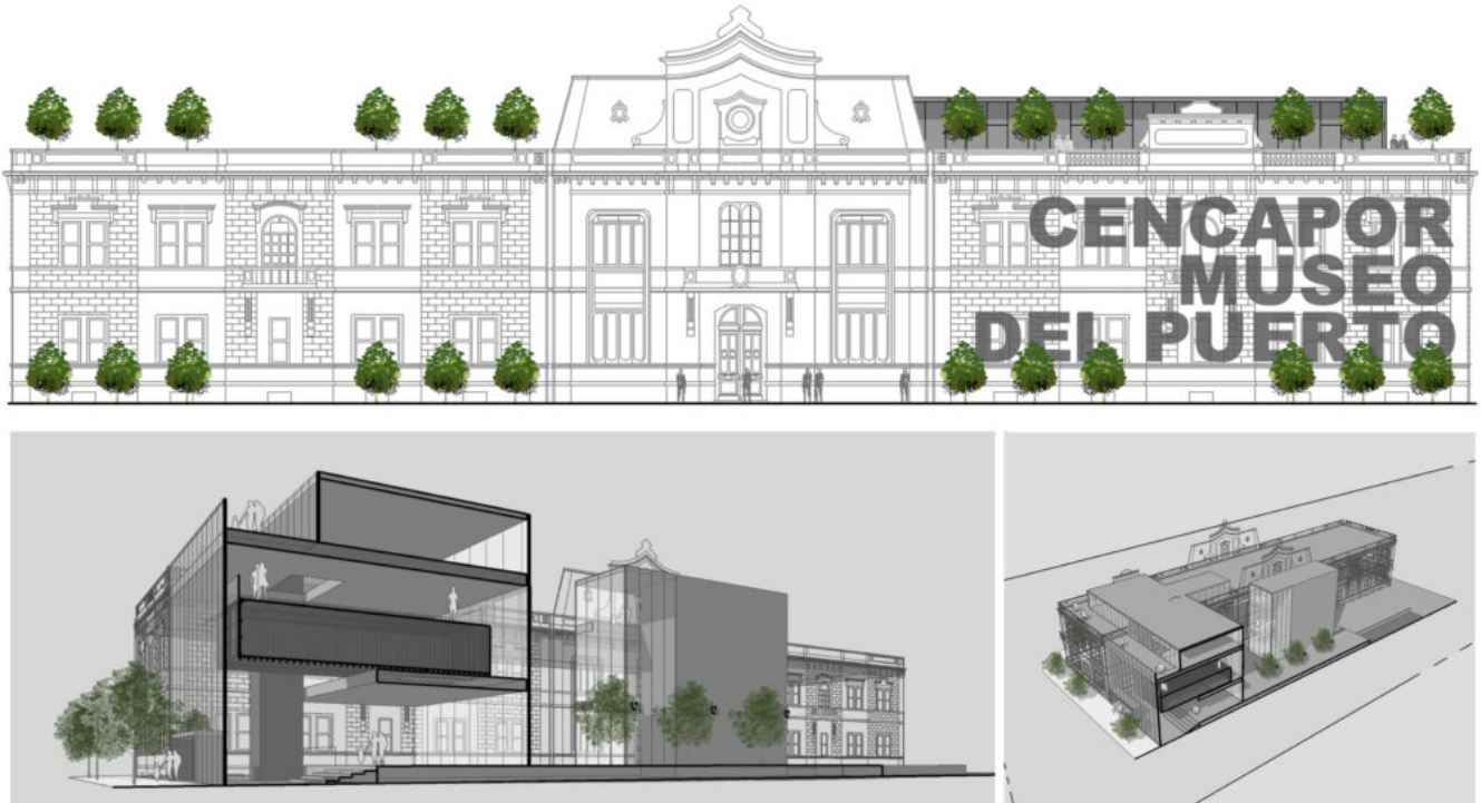
Vista de frente y croquis 3D del nuevo edificio CENCAPOR, actualmente en desarrollo.