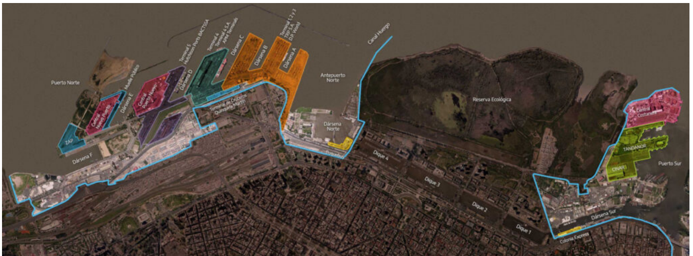
Imagen satelital de delimitación de jurisdicción de Puerto Buenos Aires.

La Administración General de Puertos es la responsable de garantizar la seguridad y la navegabilidad en la Vía Navegable Troncal [3], compuesta por más de 1477 km fluviales que atraviesan 7 provincias, y de administrar el Puerto Buenos Aires, que opera el 62% de la carga nacional de contenedores. Su puerto se divide en dos grandes sectores: Puerto Norte y Puerto Sur, que suman más de 450 hectáreas, en la cuales se entrelazan todas las instituciones públicas y privadas que componen la comunidad portuaria. Esta jurisdicción, intercalada con espacios urbanos tales como el paseo de Costanera Norte y el paseo de Costanera Sur (en el barrio de Puerto Madero) ocupan la totalidad de la costa de la ciudad.