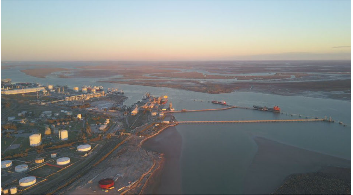
Foto aérea de Puerto Bahía Blanca.