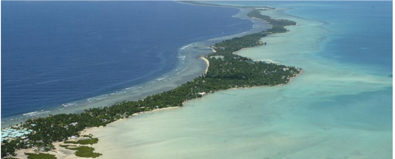
The archipelago of Kiribati in the South Pacific to the North East of Australia.

Not only the developing countries will be confronted with these issues to identify possible solutions in a short-term; the effects produced by climate change and sea level rise will affect many of the countries overlooking the water.