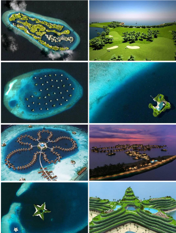
Some artificial islands designed by Dutch Docklands in Maldives: Royal Indian Ocean Club – golf course; Amillarah – private floating islands; Ocean Flower – waterfront villas; Greenstar – Floating hotel.

Also the Republic of Kiribati, a small island state consisting of an archipelago located in the South Pacific to the North East of Australia, risks seeing disappear its 33 coral atolls (811 sq km, about 6 meters above sea level, 102,300 inhabitants). Mitigation actions and adaptation strategies to climate change, flooding, coastal erosion that threaten the islands may not be enough, therefore the solution considered by the government is the population transfer on artificial islands, whose construction would require substantial international aid and could be entrusted to a some companies in the United Arab Emirates, particularly expert in this field.