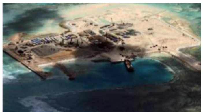
Some of Spratly Islands, the artificial archipelago created in the South China.

Differently of China, Japan has chosen to solve a legal problem with a natural solution. To